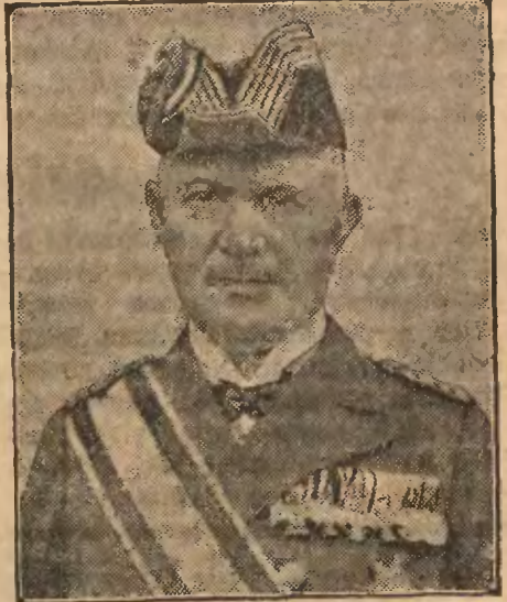
Admirał Reinhard Scheer

był ostatnim szefem sztabu admirałskiego cesarsko-niemieckiej floty bojowej.