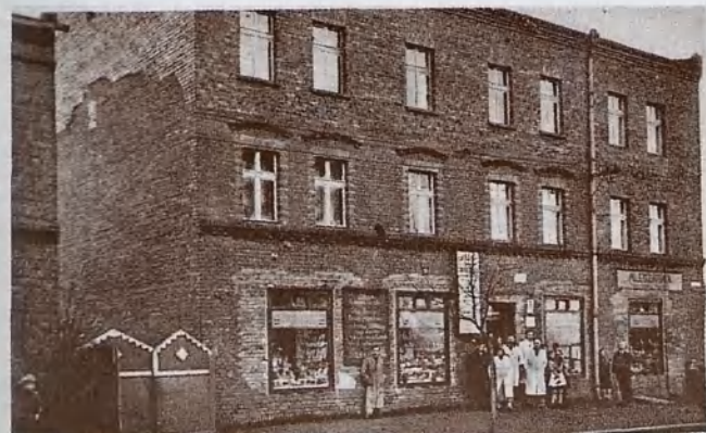
Dom towarowy Pigula