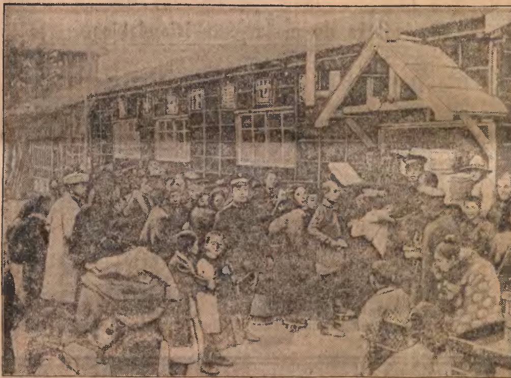
Armja zbawienia dokonuje rozdziału środków żywności i ubrań wśród ludności japońskiej, która wszystko straciła skutkiem trzęsienia ziemi, połączonego z zalaniem wybrzeży potwornymi falami morskimi.

Kobiety w ciąży, muszą się starać o usunięcie każdego zaparcia stolca przez używanie naturalnej wody gorzkiej Franciszka Józefa. Kerownicy uniwersyteckich klinik chorób kobiecych, chwalał jednogłośnie naturalną wodę Franciszka Józefa, gdyż łatwo się ją zażywa i łagodne działanie takiej bez ubocznych skutków następuje w krótkim czasie. Do nabycia wszędzie.