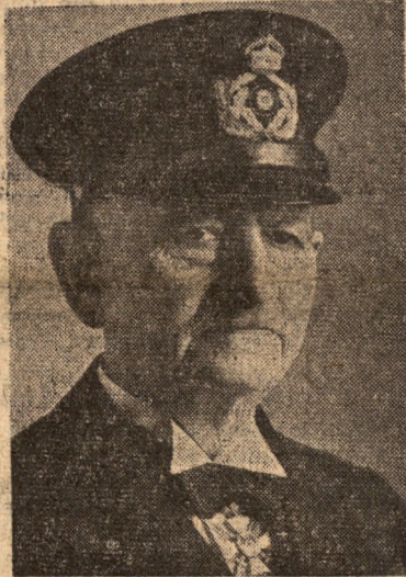
Admiral v. Reuter

Berlin, 22. Dezember. Am 18. Dezember ist, wie wir bereits meldeten, fast 75 Jahre alt, Vizeadmiral Ludwig von Reuter gestorben. Er erlag auf dem Wege zu einer Sitzung der Potsdamer Ratsherren einem Herzschlag. Der Ver-