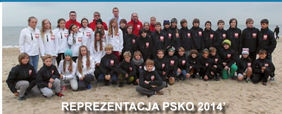
REPREZENTACJA PSKO 2014'