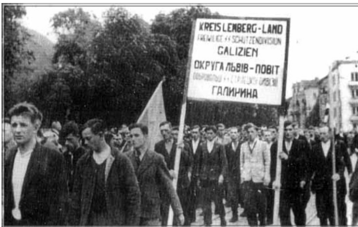
18. Młodzi Ukraińcy tłumnie zgłaszali się do służby w podległych niemieckiej władzy formacjach, które odznaczały się udziałem w mordowaniu Żydów, a potem Polaków i przedstawicieli innych narodowości, zamieszkujących dawne Kresy. Na fot. ochotnicy do Dywizji SS Galizien z okolic Lwowa