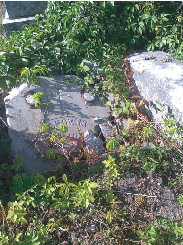
20. Cmentarz rzymskokatolicki w Tarnopolu, stan w 2011 r.