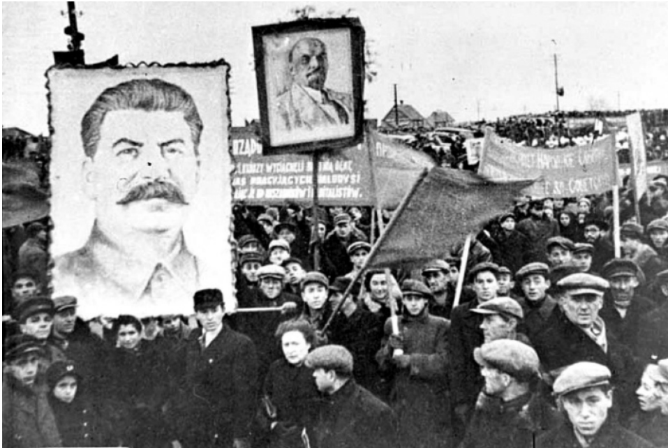
17. Po wkroczeniu wojsk sowieckich na kresy ludność zmuszano do udziału w tzw. mitingach, czyli wiecach, podczas których opluwano Polskę, głosząc chwałę Stalina i Związku Sowieckiego