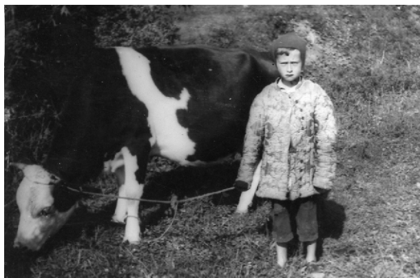
5. Brat autorki wraz z krową Kaliną. Jego „kufajka” uszyta została przez matkę ze stor, zdobiących niegdyś okna ich lwowskiego domu.