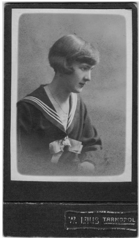
14. Uczennica gimnazjum w Tarnopolu, NN. Lata trzydzieste