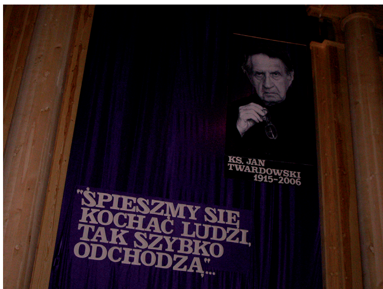
Warszawa — bazylika Świętego Krzyża (2006).

kowano bowiem o tej poezji już wiele artykułów i recenzji, powstało sporo prac magisterskich oraz rozpraw doktorskich, trudno więc o rewolucyjne odczytania. Już w 1981 roku Jerzy Kwiatkowski sformułował trafną diagnozę stanu badań nad tą liryką, pisząc, że „wszyscy już napisali o tej poezji — jeśli zaś nie wszyscy, to w każdym razie wszystko, a przynajmniej bardzo