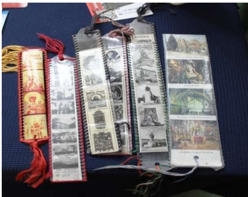
Wybrane zakładki z kolekcji organizatorki wystawy.

Była ona wynikiem zainteresowań bibliotekarza, pasji zbierania zakładek z podróży, wizyt w galeriach, muzeach. Wystawiono przeszło 200 zakładek, najczęściej będących pamiątką z odwiedzanych miejsc. Inne, to wykonane przez uczniów, z różnego materiału i wyszukaną techniką, o najrozmaitszych kształtach. Zachwycają kreatywnością. Na pewno budzą wspomnienia, sentyment. Szczególnie te najstarsze, przekazywane z pokolenia na pokolenie. Służą nie tylko zaznaczaniu stron w lekturze, ale także stanowią przedmiot kolekcjonerski. Ponadto należy zaznaczyć, że coraz częściej są używane w reklamie, stąd dostajemy je jako darmowy dodatek do danego produktu, książki.