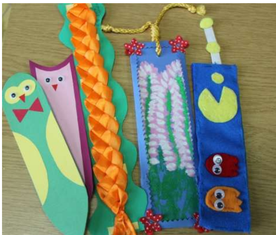
Zakładki konkursowe.