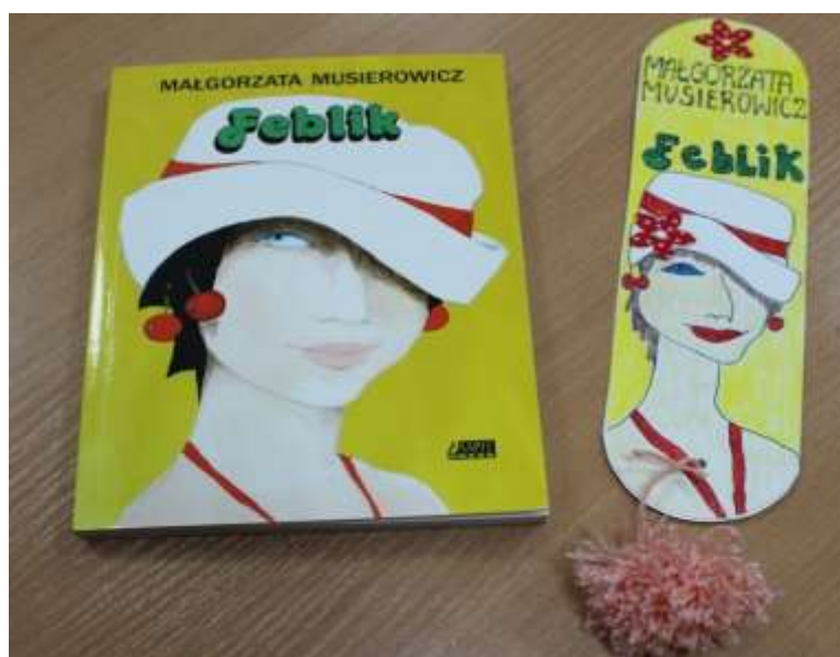
Zakładka konkursowa nawiązująca do Feblika M. Musierowicz.

Uczniowie biblioteki szkolnej SP w Morzyczynie wzięli udział w konkursie bibliotecznym pod hasłem Najładniejsza zakładka czytelnicza . Celem konkursu było kształtowanie poczucia estetyki, pobudzenie aktywności twórczej dzieci i młodzieży oraz doskonalenie sprawności manualnych. Uczniowie wykazali się zaangażowaniem, wykonując różnego rodzaju zakładki z materiału, papieru, drewna. Najładniejsze zostały nagrodzone oraz zaprezentowane na wystawie.