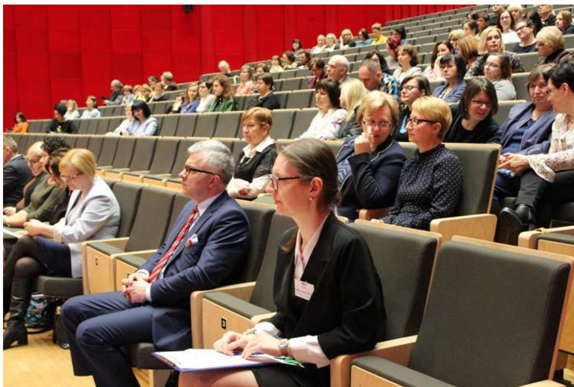
W XV Forum uczestniczyło ponad 170 bibliotekarzy.