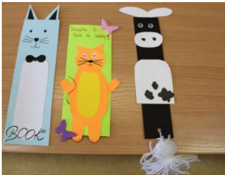
Zakładki konkursowe.

Zainteresowani uczniowie nie tylko oglądali zaprezentowane eksponaty, ale również poznali historię każdej z zakładek. Bibliotekarz krótko wprowadził uczniów w genezę ich powstania. Pojawienie się pierwszych zakładek datuje się na czasy średniowiecza, ale być może były używane już wcześniej. Jedną z pierwszych była wąska jedwabna tasiemka. Przyczepiona u góry grzbietu książki i tak długa, aby wystawała poza jej dolną krawędź. Najczęściej używane były w Biblii i modlitewnikach. Później pojawiały się zakładki jedwabne, haftowane, papierowe, metalowe i inne.