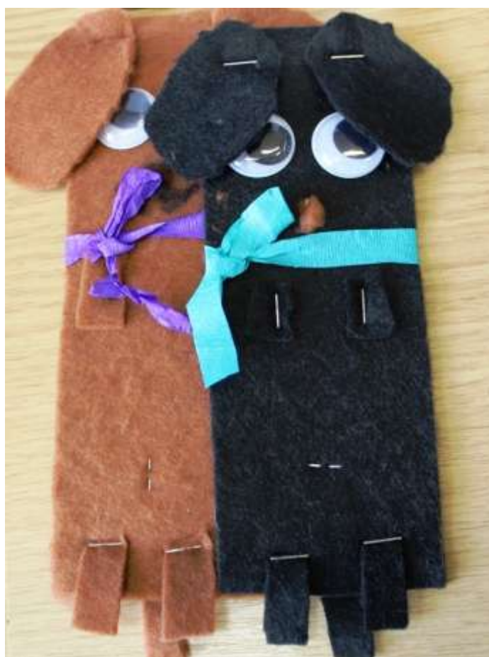
Zakładki konkursowe.