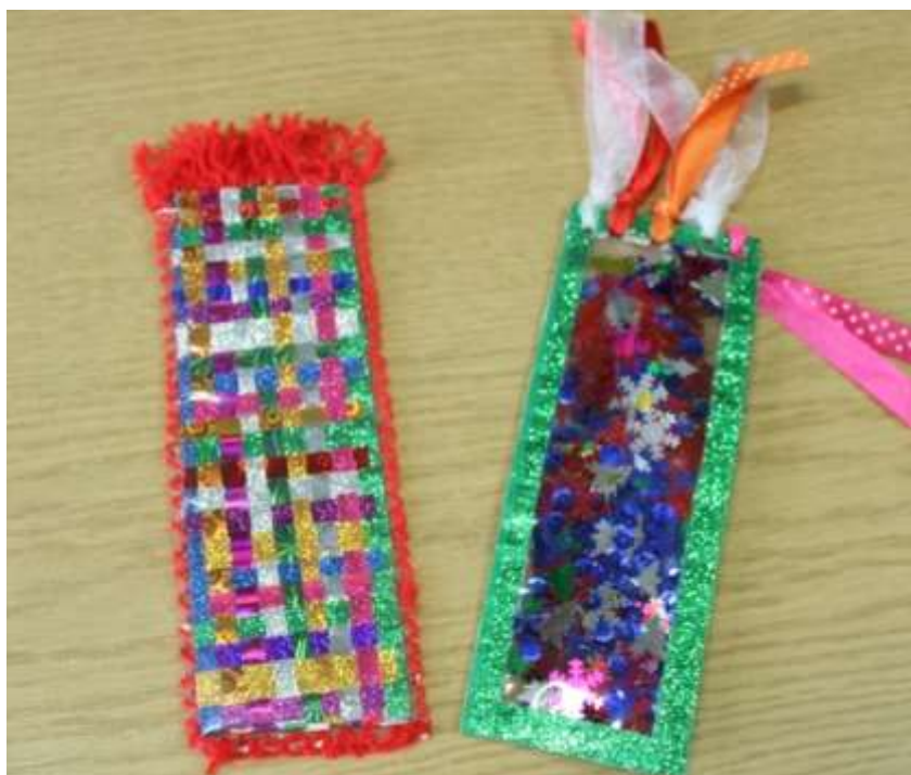
Zakładki konkursowe.