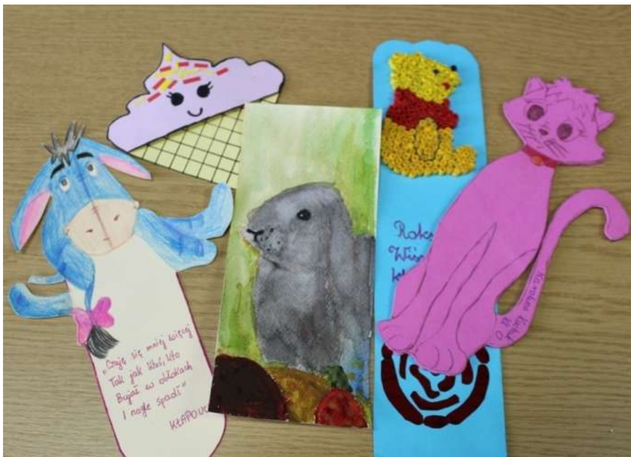
Zakładki konkursowe.