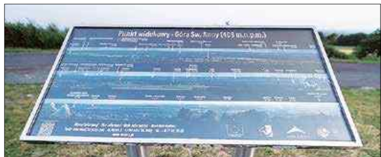
Punkt widokowy ma nową tablicę

Panorama została wzbogacona o nowe ciekawe punkty do tej pory niezapisane. Przy dobrej pogodzie można dojrzeć stąd Tatry, Babią Górę, Beskid Śląski czy nawet Czantorię. Niestety przy tablicy