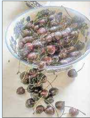
Sezon na czereśni! Jakie potrawy z nich robicie?

Piszcie na maila: redakcja@strzelecopolski.pl lub wysyłajcie listy: Redakcja Strzelca Opolskiego, ul. Piłsudskiego 9, 47-100 Strzelec Opolskie. Jeśli możecie, dołączcie zdjęcie. Najlepsze propozycje nagrodzimy.