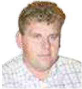
Redaktor strony: Piotr Warner

✉ piotrwarner@opole.home.pl ☎ 501 533 669