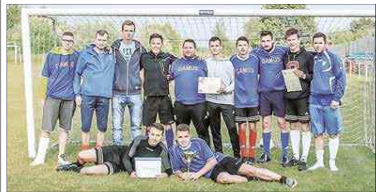
Drużyna zwycięskiej dzielnicy