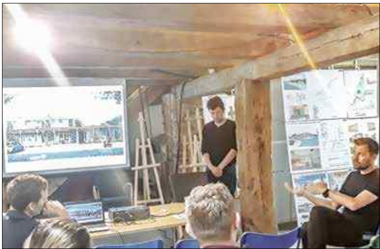
Architekci przedstawili szczegóły koncepcji przedszkola