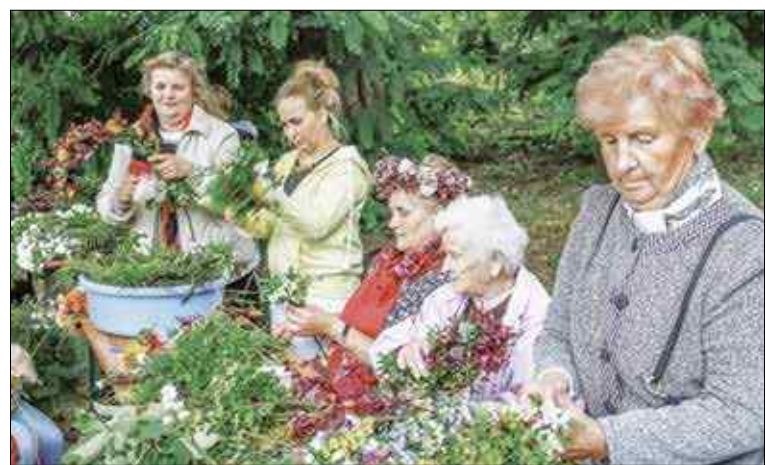
Zanim wianki rzucono na wodę, trzeba je było upleść...