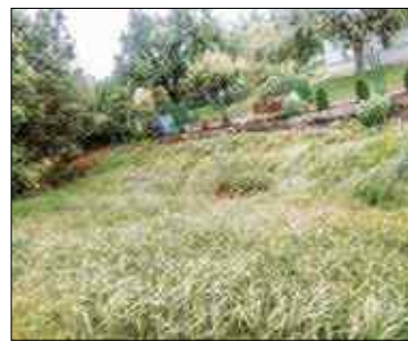
Tak wygląda rów wzdłuż ogródków działkowych na Budowlanych