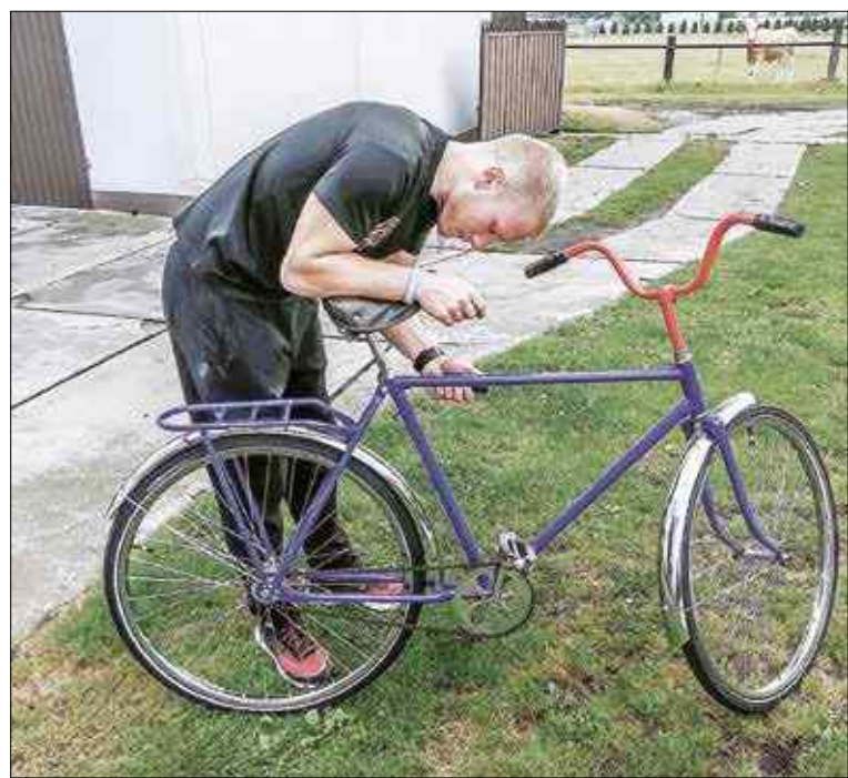
...i po renowacji

Renowacją roweru zajmował się chłopak spod Torunia. Poszczególne elementy skręcił Jacek Haber z serwisu eBikes w Strzelcach Opolskich.