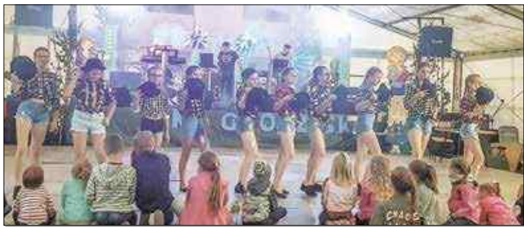
Zgrani Fojermani - to oprócz kabaretu, występy taneczne

Niedzielne biesiadowanie również rozpoczęło się od występów dzieci. Na scenie wystąpiły przed-