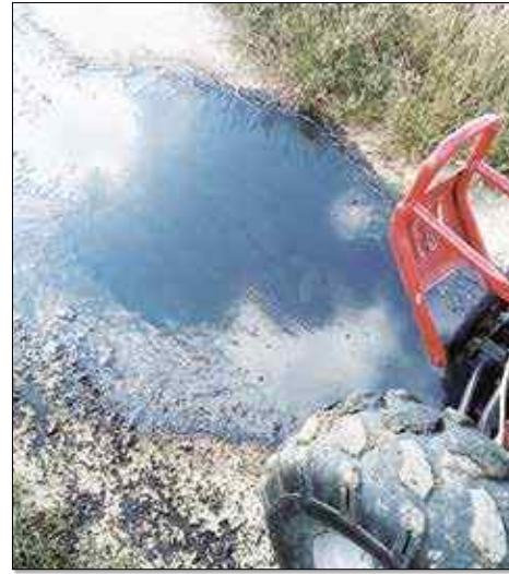
Pobrano próbki materiału do badań