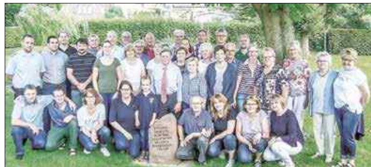
W przyszłym roku minie 35 lat partnerstwa pomiędzy jednostką OSP Wysoka a strażakami z Hoppensen