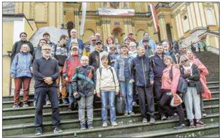
Uczestnikom wycieczki nie straszny był deszcz