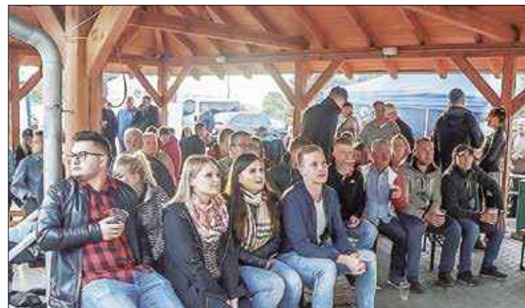
Strefę kibica wydzielono pod wiatą. Więcej zdjęć z festynu na Facebooku Nogowczyc