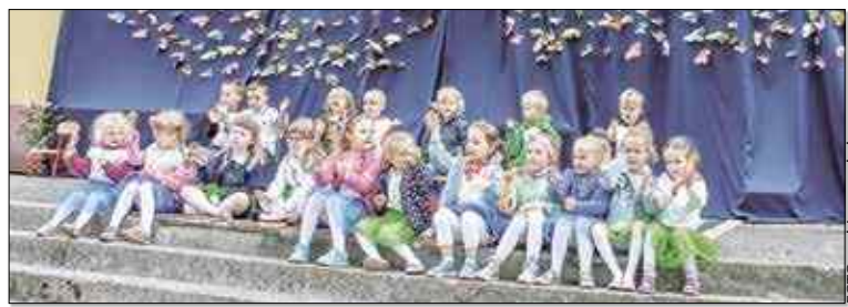
Na scenie zaprezentowali się mali artyści