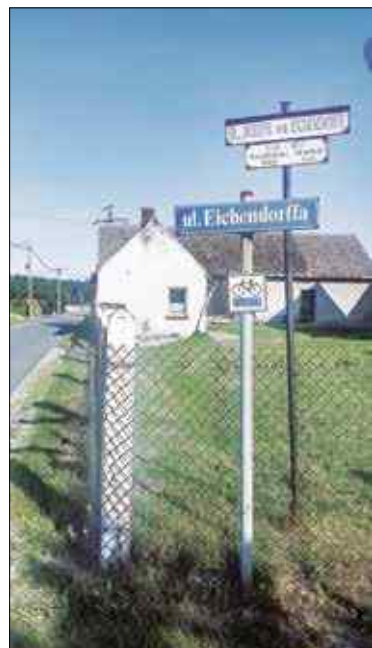
Tabliczka postawiona w 1990 roku w Staniszcach Małych, choć wyblakła, stoi do dziś

Źródła: Zeszyty Eichendorff, informacje uzyskane od Józefa Kotysia i Krystyny Kunysz.