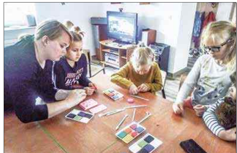
Robieniem biżuterii zainteresowane były przede wszystkim dziewczynki