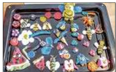
Dzieła małych artystek

Zajęcia będą odbywać się średnio raz w tygodniu do 30 września. Dzieci będą robić biżuterię, magnesy z motywem pszczołki,