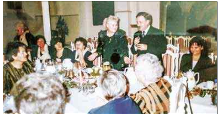
W ciągu 20 lat seniorzy spotykali się wielokrotnie

Na początku, kiedy seniorzy nie mieli stałego lokum, działali w domu kultury i urządzenie miasta. Po pewnym czasie udało im się otrzymać dwa pomieszczenia przy OPS przy ulicy Krakowskiej, gdzie pracują do dziś. Mają tam biuro i salę wykładową. Tematyka prowadzonych zajęć była ściśle związana ze statutem Uniwersytetu Trzeciego Wieku, jednak członkowie UTW postanowili ją posze-