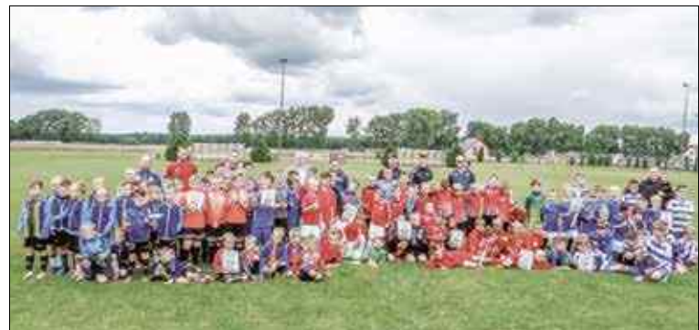
Skrzaty, żaki i orliki z niedzielnej części turnieju Bena Długosza

W minioną sobotę oraz niedzielę w Rozmierce odbył się tradycyjny, 22. już turniej imienia Bena Długosza. Zaprezentowały się drużyny Jedności Rozmierka w różnych kategoriach wiekowych, odbył się również festyn dla wszystkich.