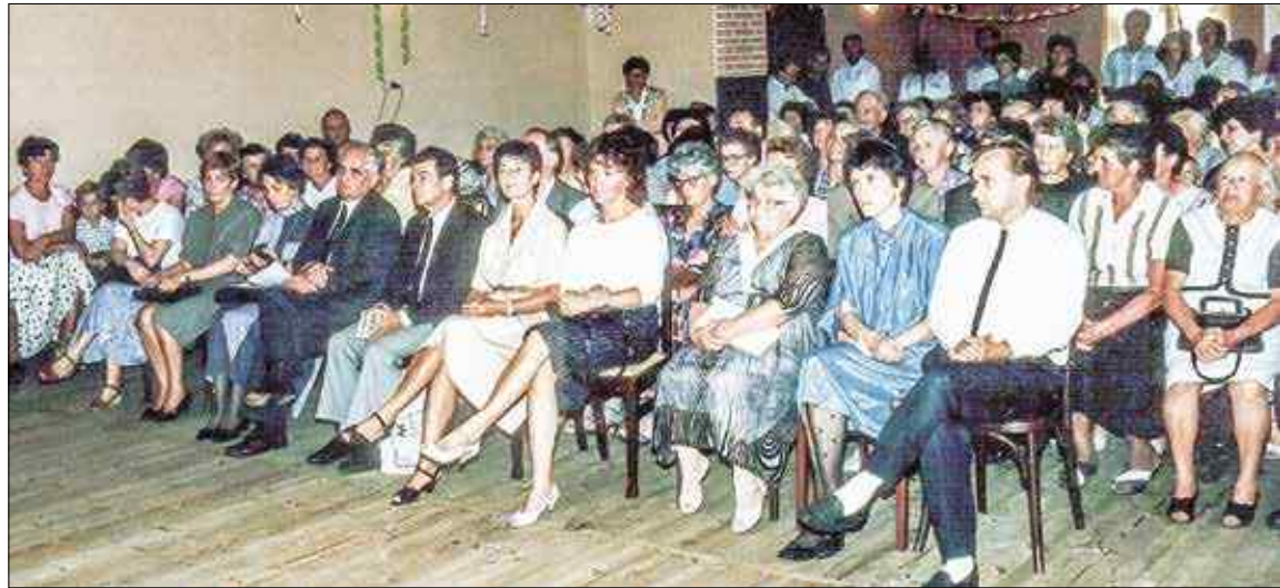
Festyn nadania ulicom nazw Eichendorff i Hauptstocka odbył się w sali, która została wybudowana w miejscu starej karczmy

Później Eichendorff pracował w Królewcu. Miejsce to bardzo mu