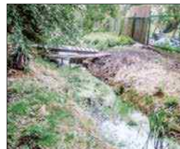
Podczas upałów z rowu unosi się smród

D o naszej redakcji zgłosił się działkowicz, który narzekał na stan rowu wzdłuż działek przy ulicy Budowlanych w Strzelcach.