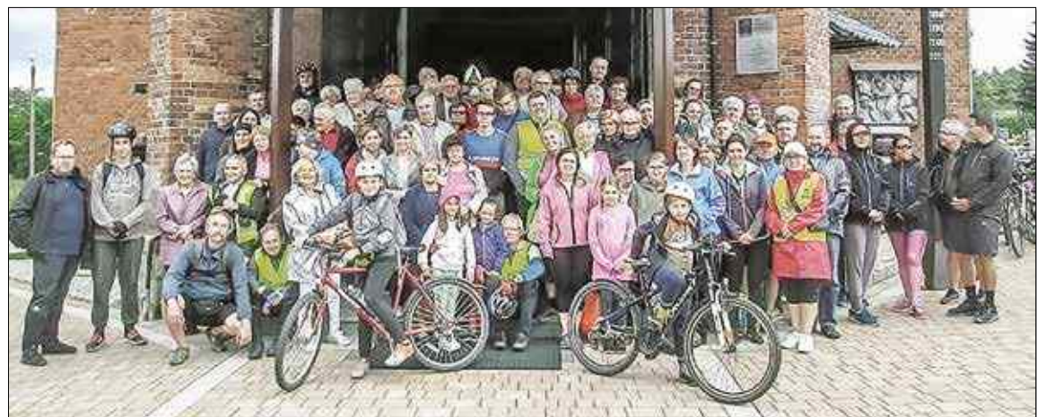
Pamiątkowe zdjęcie przy kościele pw. św. Jadwigi Śląskiej w Brzezince

W ten sposób uczestnicy zwiedzili Ostropę - drewniany kościół św. Jerzego i pomnik ofiar wojen, Kozłów - kościół św. Mikołaja, Brzezinkę - kościół św. Jadwigi i grób księży zamordowanych tam w 1945 r., Taciszów - klasztor oo. kamilianów i Poniszowice - Szurową Górę, gdzie w czasie wojny trzydziestoletniej doszło do bitwy.