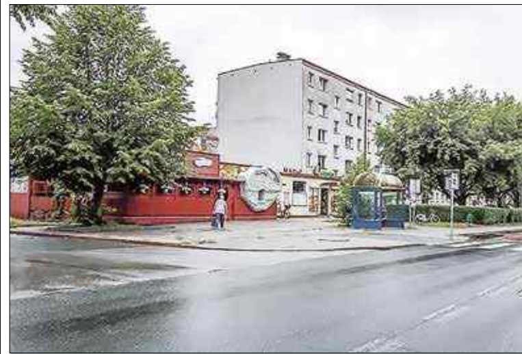
To miejsce ma się zmienić dzięki pieniądzom gminnym i unijnym

M ieszkańcy gminy często skarżą się, że miasto nie wygląda zachęcająco, że jest tu brudno, brzydko, a wiele miejsc jest zaniedbanych. Urzędnicy starają się sytuację poprawić. Wkrótce wypięknieją krajobraz Zawadzkiego przy Nowym Osiedlu. Dzięki środkom pozyskanym z LGD Kraina Dinozaurów zagospodarowany zostanie skwer na skrzyżowaniu ulic Opolskiej i Nowe Osiedle, przed sklepem i lokalem gastronomicznym, które się tam znajdują.