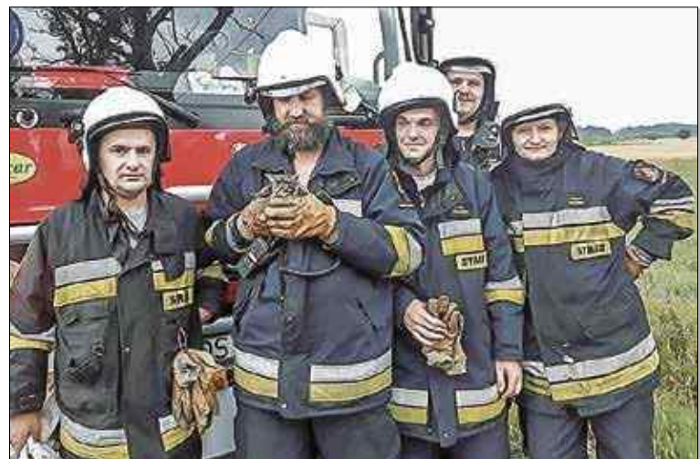
Strażacy z uratowanym kociątkiem