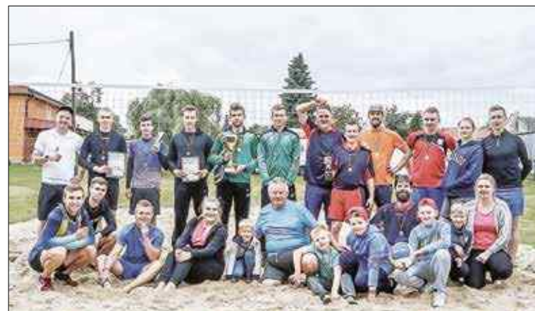
Organizatorzy wraz z drużynami, które stanęły na podium