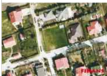
DZIAŁKA BUDOWLANA Jędrzychów ul. Orła działka 8,7ar, uzbrojenie woda, energia, kanalizacja przy działce CENA - 110 000zł