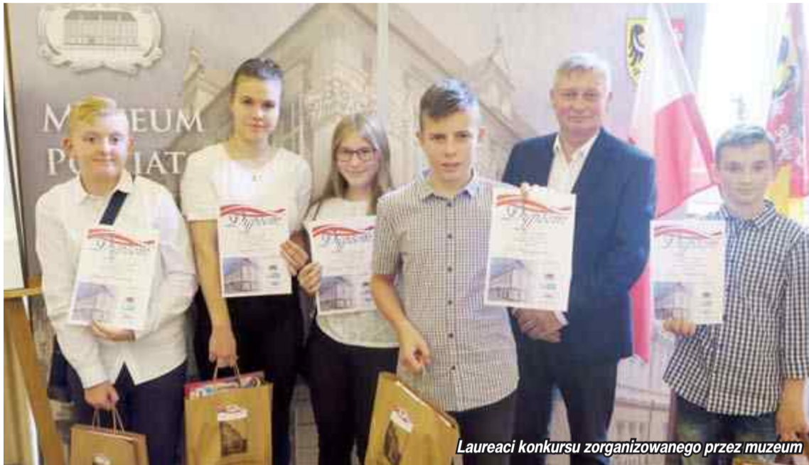
Laureaci konkursu zorganizowanego przez muzeum

W nyskim muzeum odbył się finał konkursu „Niepodległa. Dla wszystkich” - w ramach Europejskich Dni Dziedzictwa. Konkurs został przeprowadzony w dwóch formach: turnieju wiedzy oraz konkurencji plastycznej. W każdej z form mogli uczestniczyć uczniowie w wieku 12-17 lat.