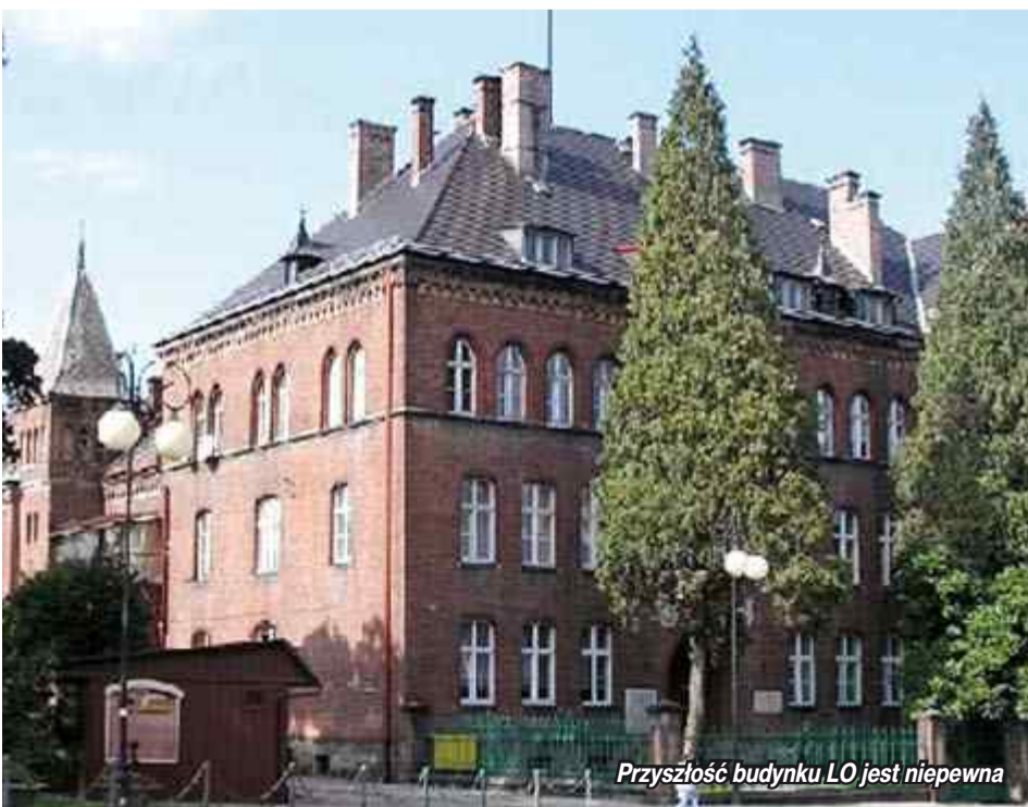
Przyszłość budynku LO jest niepewna

Zdaniem wicestarosty budynek zespołu szkół powinien pomieścić bez problemu wszystkich uczniów. Naboru do liceum nie ma już drugi rok. Nie bez znaczenia jest również fakt, iż właścicielem budynku liceum jest gmina Głucholązy a nie powiat nyski. Przypomnijmy, dotychczasowy plan zakładał, że uczniowie z LO będą się uczyć w budynku zespołu szkół, a po remoncie budynku LO z powrotem wrócą do swojej szkoły. Wolne pomieszczenia w ZS miały zostać zagospodarowane na cele publiczne. Na razie nie wiadomo, przy której szkole powstanie nowe wielofunkcyjne boisko. K