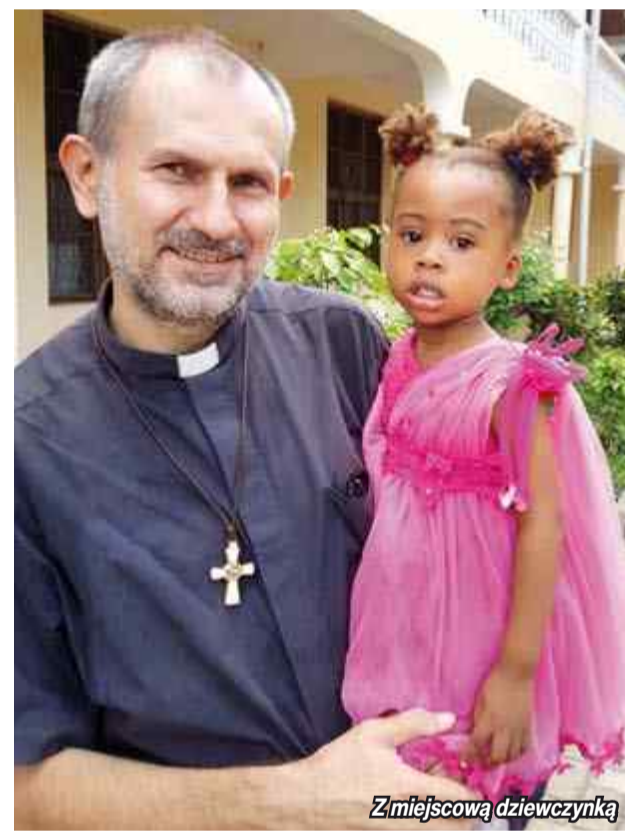
Z miejscową dziewczynką