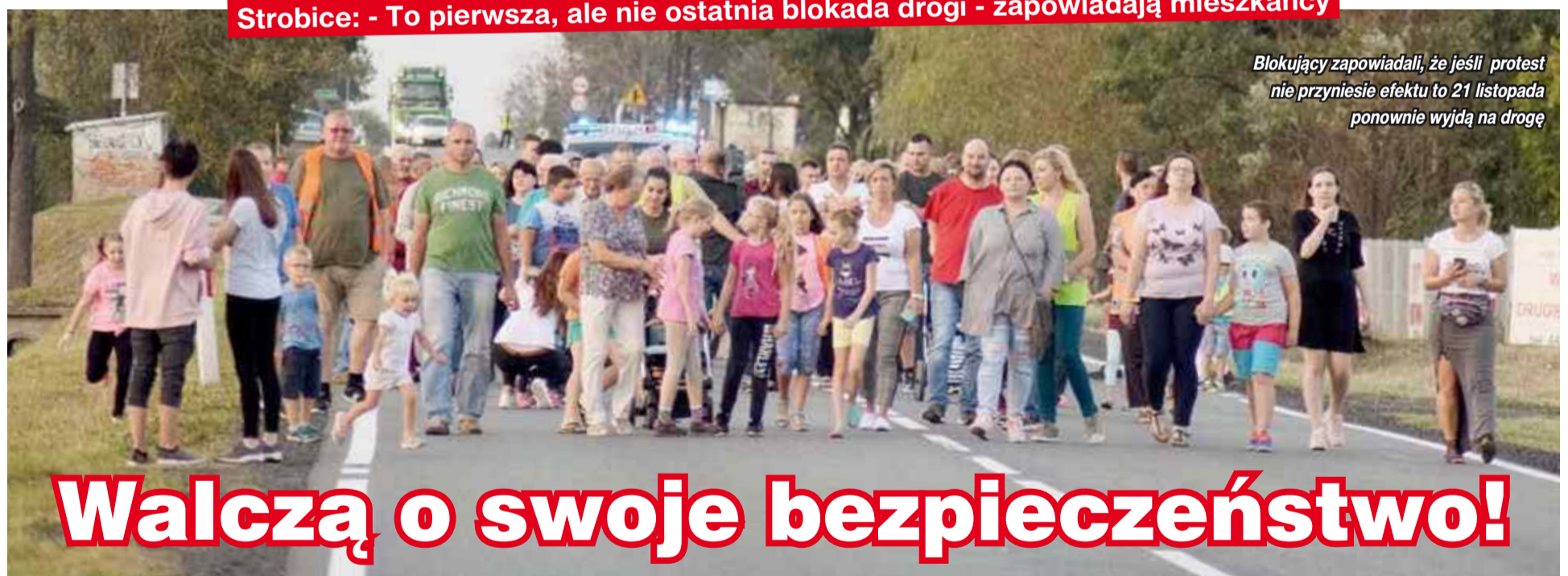
Blokujący zapowiadali, że jeśli protest nie przyniesie efektu to 21 listopada ponownie wyjdą na drogę