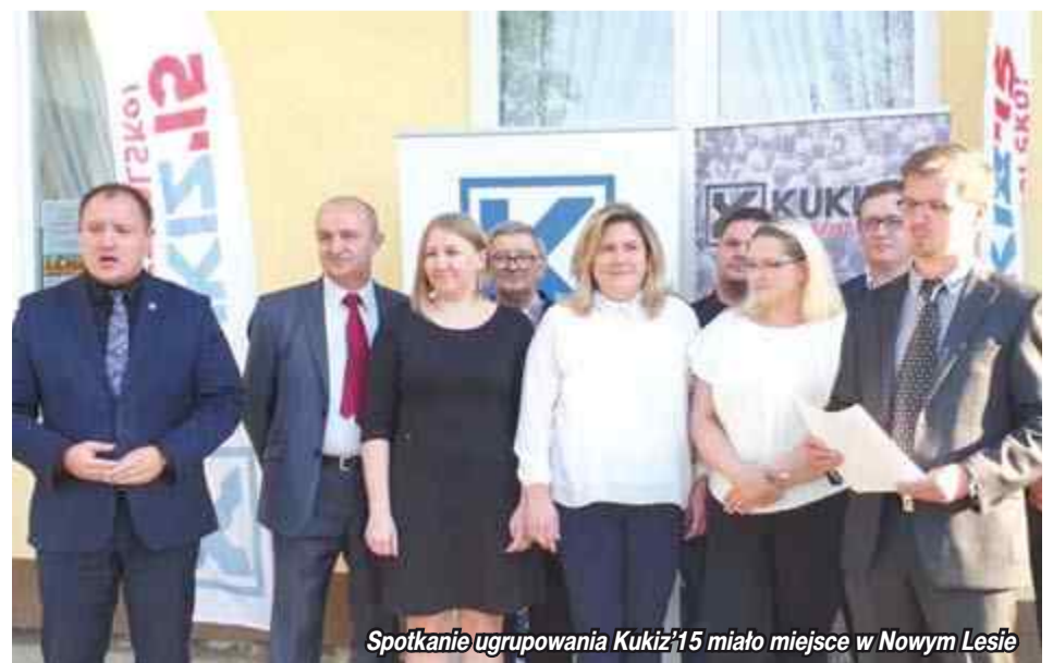
Spotkanie ugrupowania Kukiz'15 miało miejsce w Nowym Lesie