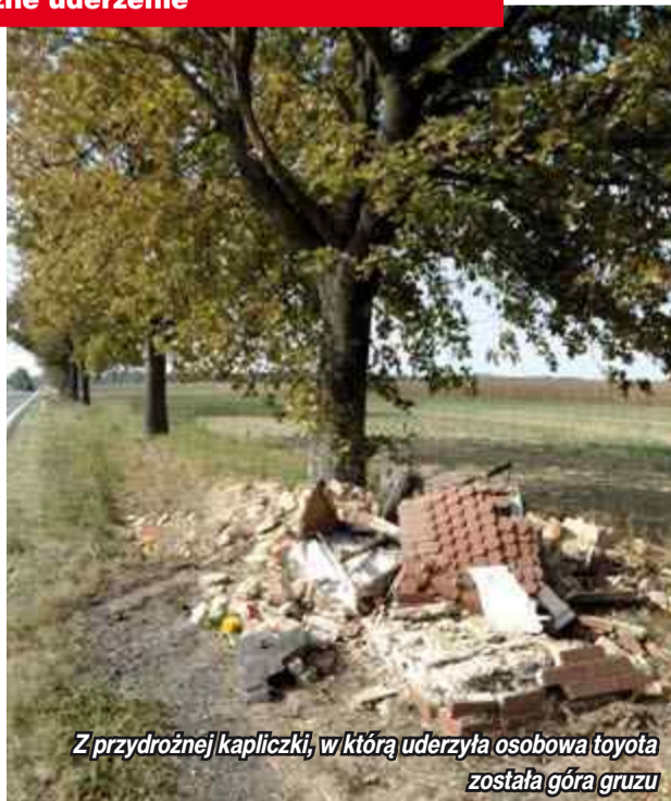
Z przydrożnej kapliczki, w którą uderzyła osobowa toyota została góra gruzu

skiej twierdząc, że dobrze się czuje. Na miejscu pracowali policjanci a ruch na trasie odbywał się wahałdowo - informuje mł. asp. Magdalena Skrętkowicz rzecznik prasowy KPP w Nysie. w