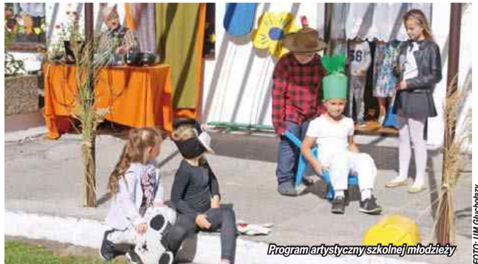
Program artystyczny szkolnej młodzieży

W trakcie imprezy zaprezentowano wiele lokalnych produktów wytworzonych przez miejscowe Koła Gospodyń Wiejskich. Swoje wyjątkowe produkty zaprezentowali członkowie ze Stowarzyszenia Sami Sobie z Wilamowic, Stowarzyszenia na rzecz Rozwoju Wsi Koperniki oraz pań z Kół Gospodyń Wiejskich ze Sławniowic, Burgrabic i Biskupowa. Oczywiście wszystkich tych potraw można było spróbować. W trakcie festynu można było także obejrzeć występ artystyczny uczniów Państwowej Szkoły Podstawowej w Sławniowicach. K