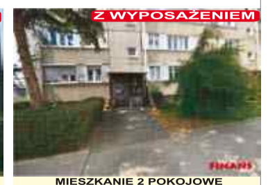
MIESZKANIE 2 POKOJOWE Nysa ul. Podzamcze 48m2, piętro I, CO-miejskie, balkon, piwnica, czynsz 340zł CENA - 180 000zł