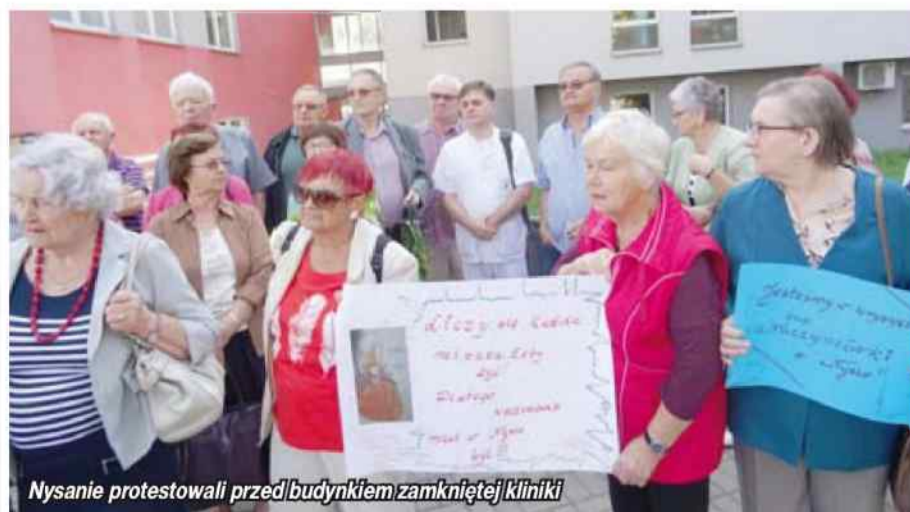
Nysanie protestowali przed budynkiem zamkniętej kliniki

Nysanie ze związku emerytów oraz związku diabetyków domagają się uruchomienia chirurgii naczyniowej Polsko - Amerykańskich Klinik Serca. Nowy obiekt, z nowoczesną salą operacyjną, stoi zamknięty od dwóch lat bo opolski NFZ nie chce podpisać kontraktu.