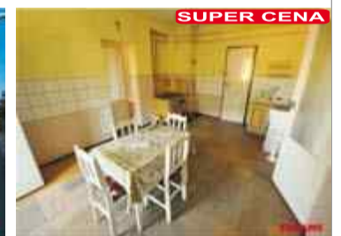
MIESZKANIE 3 POKOJOWE Maciejowice 63m2, piętro I, działka 5ar, garaż, piwnica, beczynszowe CENA - 60 000zł