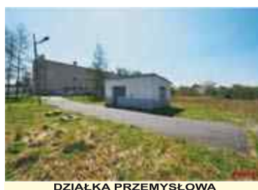
DZIAŁKA PRZEMYSŁOWA Kamiennik działka 5,75ar, uzbrojenie woda, prąd, szambo CENA - 25 000zł