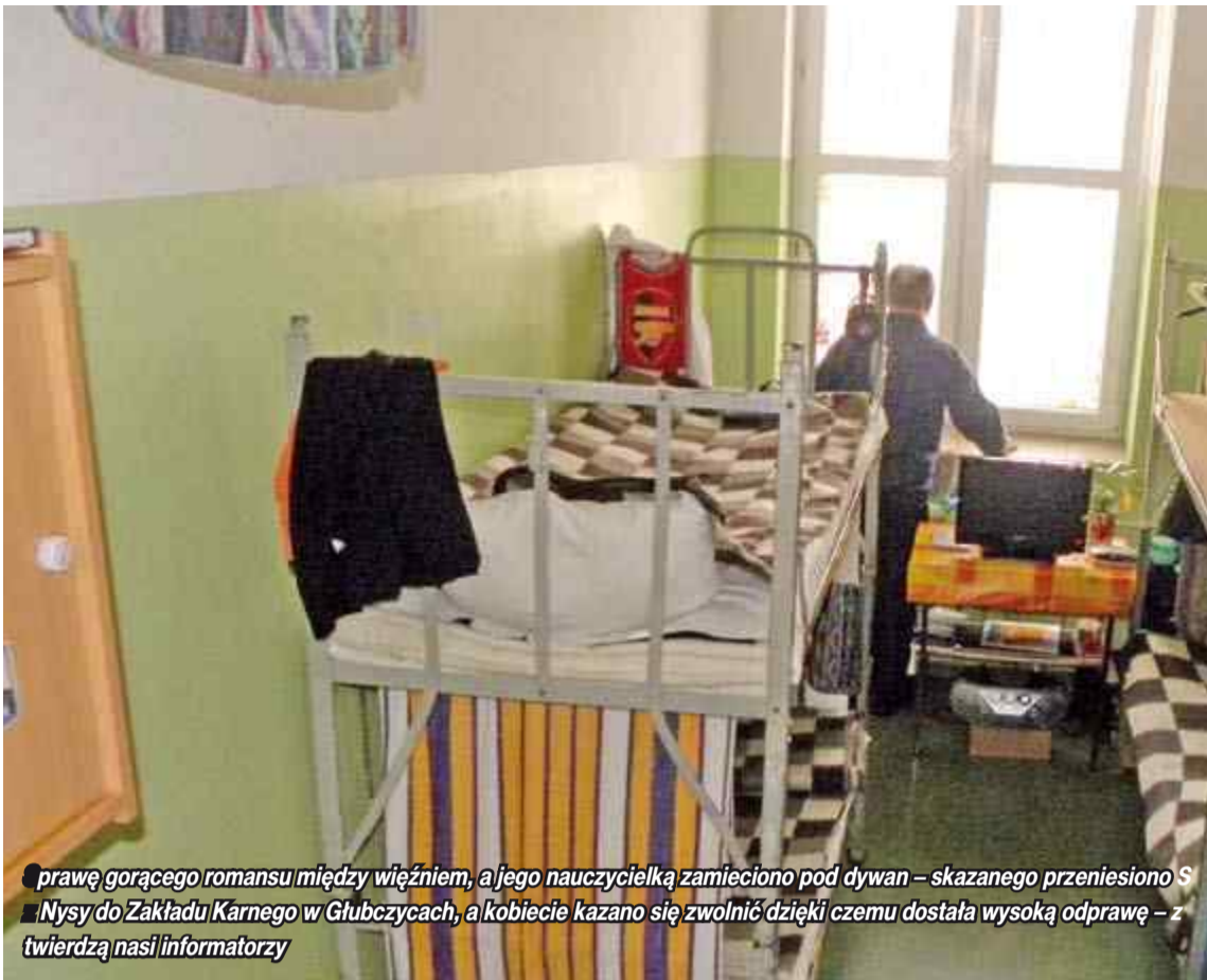
Prawę gorącego romansu między więźniem, a jego nauczycielką zamieciono pod dywan – skazanego przeniesiono S Nysy do Zakładu Karnego w Głubczycach, a kobiecie kazano się zwolnić dzięki czemu dostała wysoką odprawę – z twierdzą nasi informatorzy

Zapytaliśmy panią rzecznik, czy w związku z doniesieniami na temat sytuacji w ZK w Nysie zostanie przeprowadzona kontrola zewnętrzna. Ten temat został jednak pominięty czyli... kontroli nie będzie. Pani rzecznik przyznała, że przekazała nam wersję uzyskaną od kierownictwa ZK w Nysie. – Kierownictwu placówki nikt nie zgłaszał, aby na terenie szkoły miało dojść do nieprawidłowości. A wszystkie dotychczasowe informacje opierają się na anonimowych ustaleniach, nie popartych konkretnymi dowodami – dodała pani rzecznik.