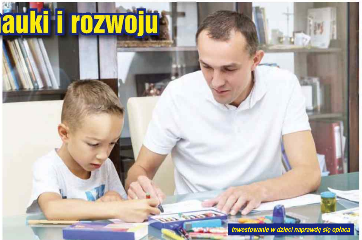
Investowanie w dzieci naprawdę się opłaca

Tak mówiłem w trakcie obrony przed likwidacją Gimnazjum nr 3 w Nysie. Tak twierdzą do dziś. Edukacja na wysokim poziomie powinna wyróżniać nas w Polsce i być znakiem firmowym Nysy. Na początek wprowadzimy we wszystkich świetlicach szkolnych program „języki dla wszystkich” z podziałem na poziom uczniów, ponieważ lekcje językowe są jednym z najczęściej wybieranych zajęć dodatkowych i trzeba zapewnić dostęp do dodatkowych lekcji każdemu chętnemu dziecku za darmo - w szkole. Dla porównania: