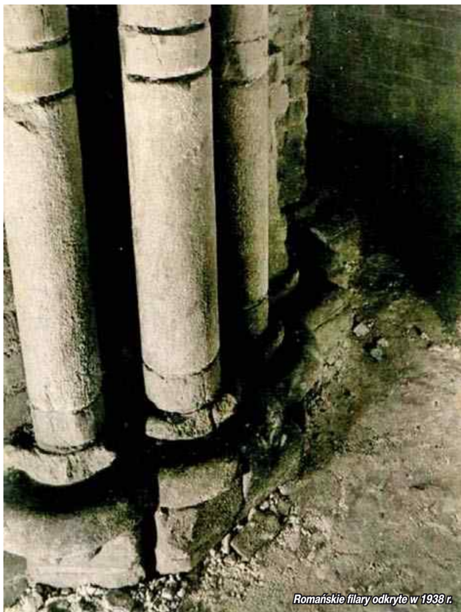
Romańskie filary odkryte w 1938 r.