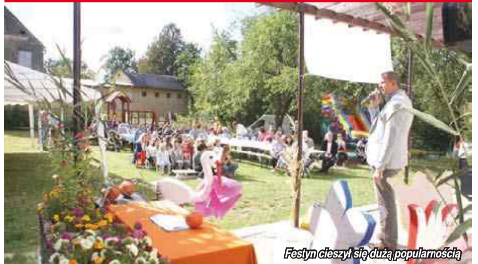
Festyn cieszył się dużą popularnością

W sobotę 22 września na placu szkolnym w Sławniowicach miał miejsce festyn pod nazwą Raz Na Ludowo - Bogactwo Wsi.