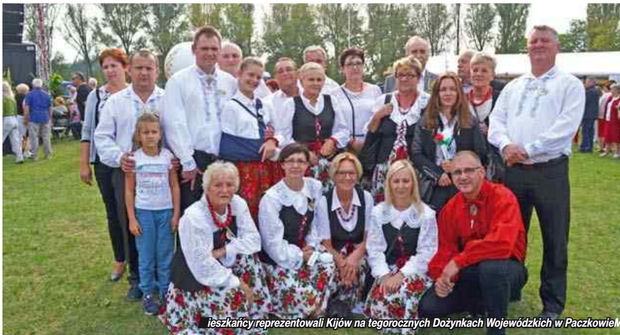
Mieszkańcy reprezentowali Kijów na tegorocznych Dożynkach Wojewódzkich w Paczkowie

Mieszkańcy mówią, że we wsi brakuje kanalizacji, nadal są szamba. Przydomowe oczyszczalnie ścieków, które buduje gmina też nie podobają się ludziom. Są brzydkie i wystają z ziemi. Najlepsza byłaby kanalizacja. Brakuje chodnika przy wyremontowanej drodze powiatowej. Nie ma też przepustów pod mostkami prowadzącymi do pól. Podczas ulewy woda będzie wylewała się na drogę. Przydałby się też gaz i lepsza komunikacja autobusowa. Na wakacjach do wioski jeździ tylko jeden gminny bus. - Chcielibyśmy, aby przy wszystkich drogach w Kijowie rosły azalie, które pięknie kwitną. Sami będziemy o nie dbać jak o nasze sołectwo – podsumowują mieszkańcy.