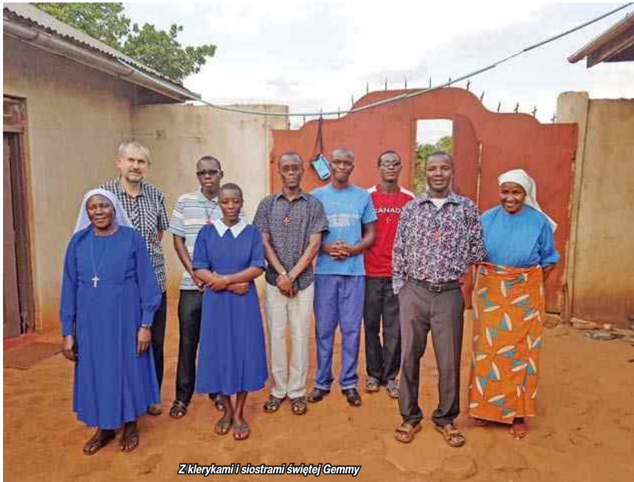
Z klerykami i siostrami świętej Gemmy

Co dwa lata misjonarz otrzymuje 2-miesięczny urlop. Odpoczywa w rodzinnym kraju, ale z radością wraca do swoich podopiecznych w Tanzanii, gdzie jest już bardziej u siebie...#