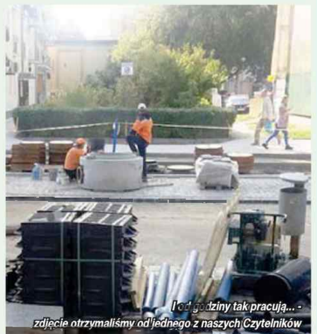
od godziny tak pracują...