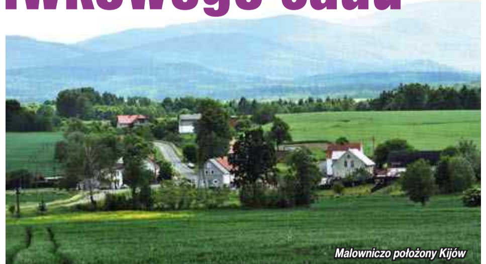
Malowniczo położony Kijów