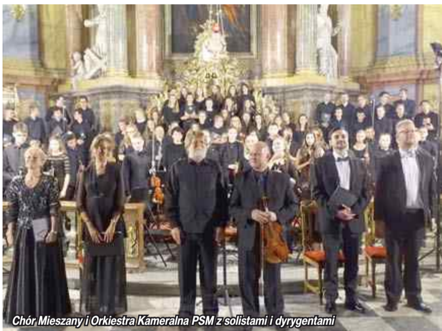
Chór Mieszany i Orkiestra Kameralna PSM z solistami i dyrygentami

Dokładnie po sześciu latach nyscy melomani ponownie mieli okazję wysłuchania słynnego Requiem Wolfganga Amadeusza Mozarta.