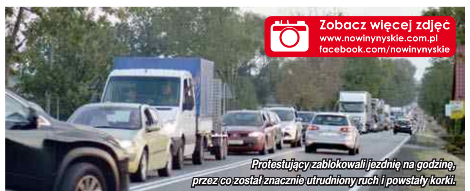
Protestujący zablokowali jezdnię na godzinę, przez co został znacznie utrudniony ruch i powstały korki.

W dniu protestu mieszkańcy otrzymali pismo od GDDKiA z propozycją tymczasowego rozwiązania sprawy, jednak nie wierzą, że rzeczywiście coś w końcu zostanie zrobione, bo obietnice i bagatelizowanie ich