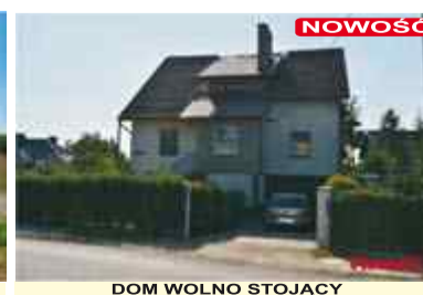
DOM WOLNO STOJĄCY Pakostawice 200m2, 6 pokoi, działka 8ar, CO-węglowe, balkon, garaż CENA - 330 000zł