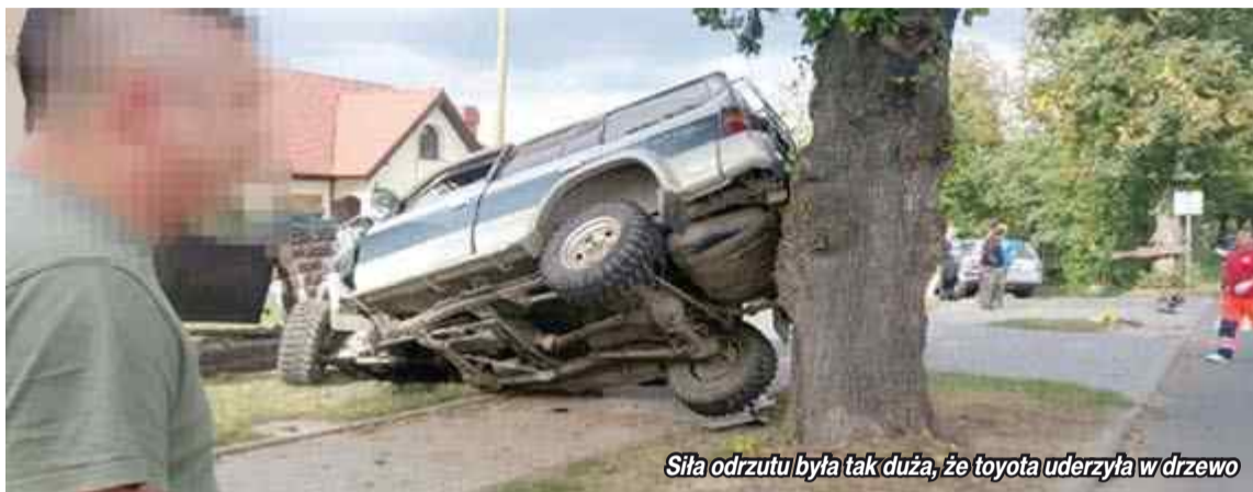
Sila odrzutu była tak duża, że toyota uderzyła w drzewo

W sobotę 22 września około godziny 14.40 w Korfantowie na ulicy Kościuszki doszło do poważnego wypadku drogowego. W wyniku czego poszkodowana kobieta oraz 11-letni pasażer zostali przetransportowani śmigłowcem LPR do szpitala. Sprawca wypadku również został przewieziony do szpitala.