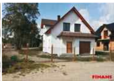
DOM WOLNO STOJĄCY Nysa ul. Brata Fludera 118m2, 5 pokoi, działka 5ar, uzbrojenie pełne w drodze, garaż CENA - 379 000zł