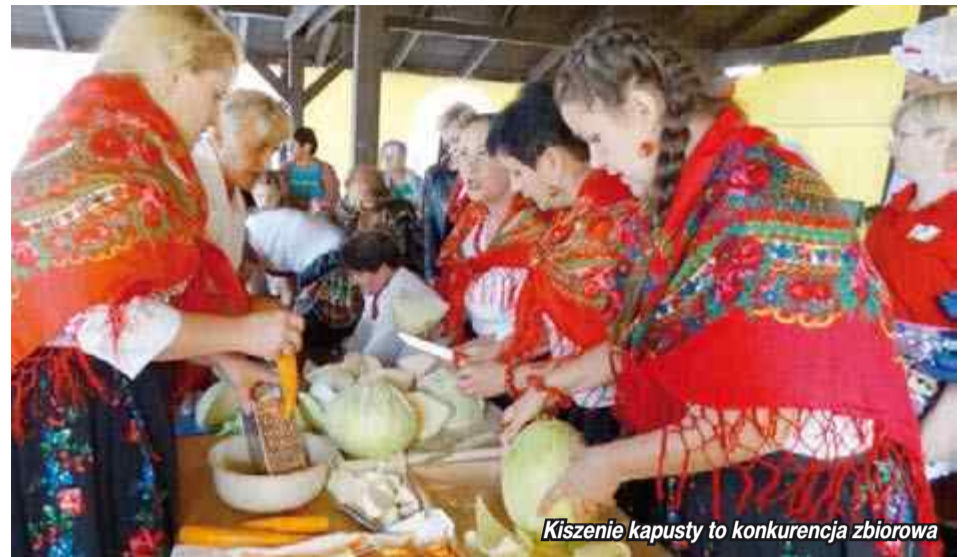
Kischenie kapusty to konkurencja zbiorowa

ugniatając warzywo w naczyńiu dbała, by odcisnąć jak największą ilość soku. Sok był bowiem odmierzany przez komisję konkursową i oczywiście im większa jego ilość tym więcej punktów. Nie mniej ważny był także czas, w jakim dana drużyna