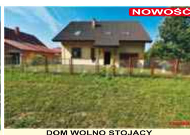
DOM WOLNO STOJĄCY Nysa ul. Brata Wagnera 150m2, działka 5,21ar, balkon, garaż, woda, energia, kanalizacja, gaz w drodze CENA - 309 000zł