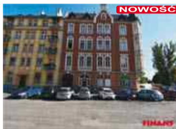
MIESZKANIE 4 POKOJOWE Nysa ul. Poznańska 93m2, piętro III, CO-miejskie, duża loggia, piwnica, strych CENA - 225 000zł