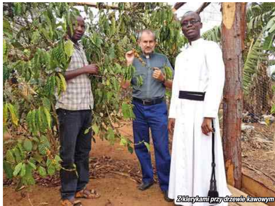
Z klerykami przy drzewie kawowym