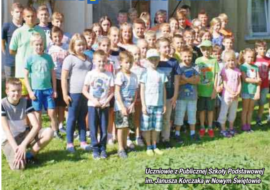
Uczniowie z Publicznej Szkoły Podstawowej im. Janusza Korczaka w Nowym Świętowie

Rzeźba św. Jana Nepomucena stojąca w niszy zabytkowego pałacu rodziny von Maubeuge świeci nowym blaskiem.