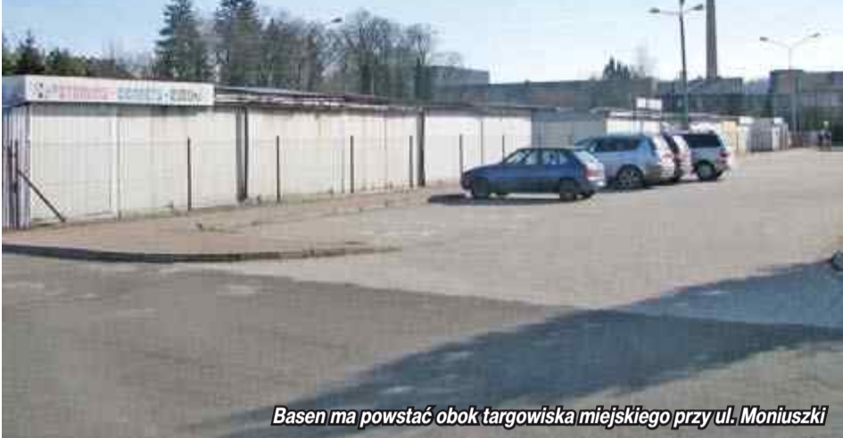
Basen ma powstać obok targowiska miejskiego przy ul. Moniuszki

Koszt budowy krytej pływalni może przekroczyć nawet czterdzieści milionów złotych, wszystko wskazuje na to, że całkowita realizacja inwestycji potrwa wiele lat.