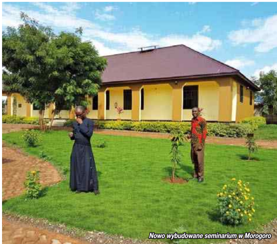
Nowo wybudowane seminarium w Morogoro