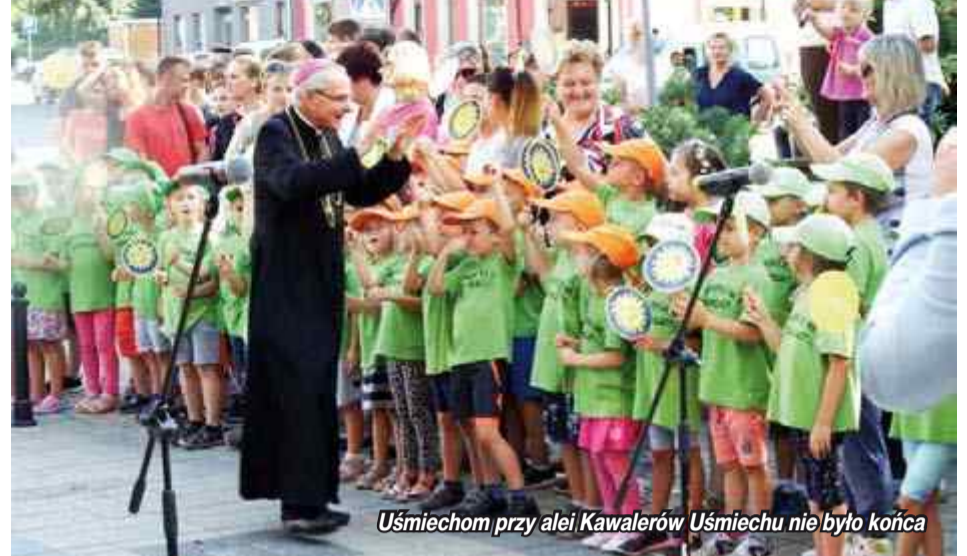
Uśmiechom przy alei Kawalerów Uśmiechu nie było końca