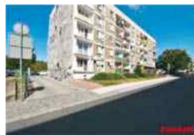
MIESZKANIE 2 POKOJOWE Nysa ul. Wita Stwosza 34m2, parter, CO-miejskie, czynsz 220zł CENA - 145 000zł