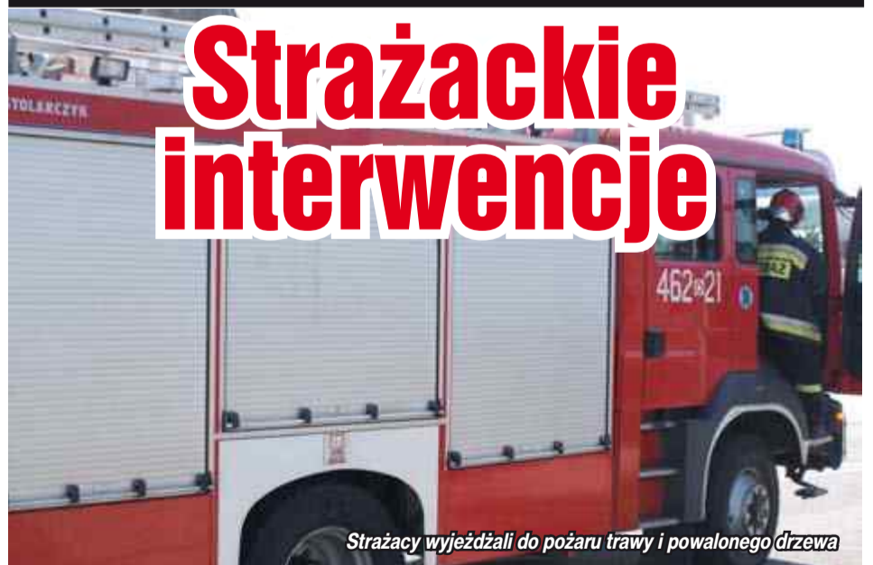
Strażacy wyjeżdżali do pożaru trawy i powalonego drzewa

19 września około godziny 15.30 strażacy zostali wezwani do gaszenia pożaru suchej trawy w Pławniowicach. Do akcji zadysponowane zostały dwa zastępy straży pożarnej.