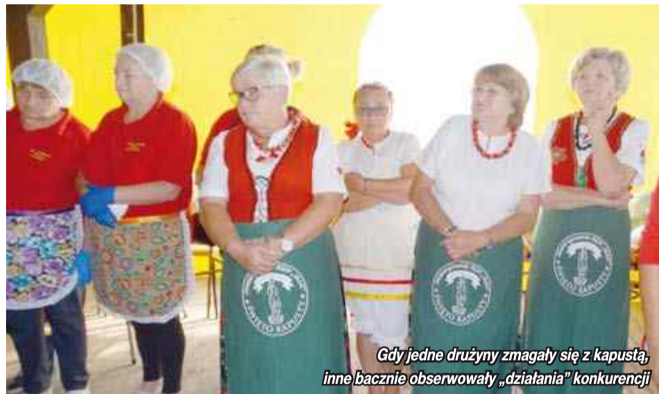
Gdy jedne drużyny zmagaly się z kapustą, inne bacznie obserwowaly „działania” konkurencji

na wykonała powierzone zadanie. A że cała impreza ma charakter zabawy panie kisiły kapustę w pięknych przebraniach i z piosenką na ustach (estetyczna oprawa kischenia kapusty też była brana pod uwagę). Po ukończeniu kischenia należało także solidnie posprzątać swoje stanowisko pracy.