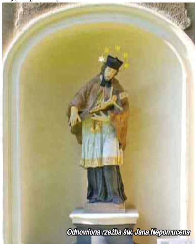
Odnowiona rzeźba św. Jana Nepomucena