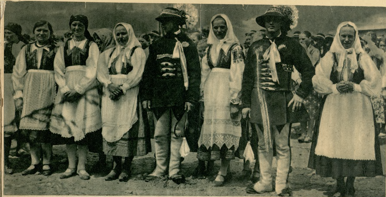
„Święto Gór“ 1935 — Grupa regionalna ze Spisza.