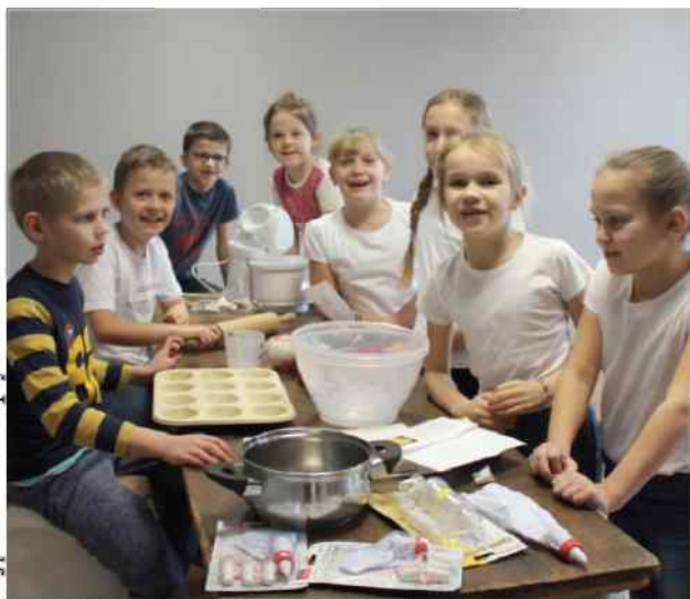
Coroczne zajęcia kucharskie przyciągają wielu milusińskich, którzy lubią gotować.