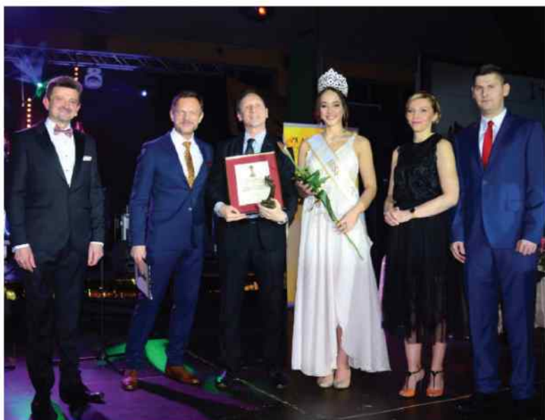
Spółdzielnia Socjalna „Gród” otrzymała Plaster Miodu w kategorii turystyka.