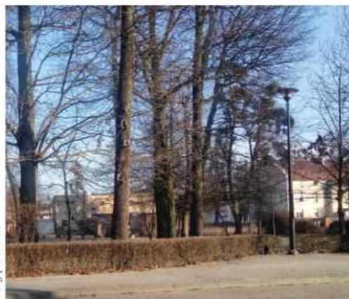
W mieście wiele miejsc czeka na uatrakcyjnienie. Być może budżet obywatelski jest dla nich szansą.

Propozycje zmian są przegłosowywane przez mieszkańców. Decyzje mieszkańców są dla władz wiążące.