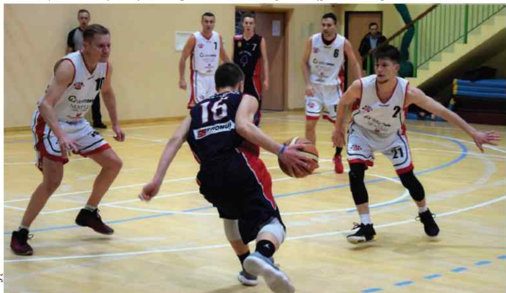
Zabrzanie postawili graczom Startu (białe koszulki) nieoczekiwane trudne warunki.