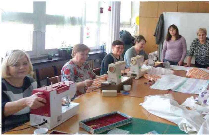
W tegorocznej akcji szycia jaśków wzięło udział osiem pań, głównie z sekcji rękodziela artystycznego.