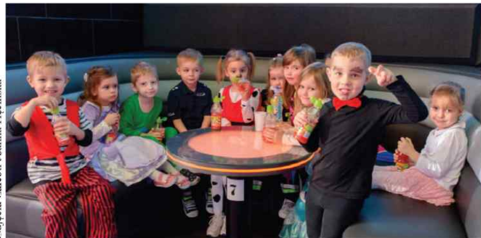
Milusińscy siadali tylko na chwilę, by zregenerować siły po szaleństwie.

Milusińscy z przedszkola nr 4 w Oleśnie co najmniej już dwa tygodnie przed przeżywali swój bal karnawałowy.