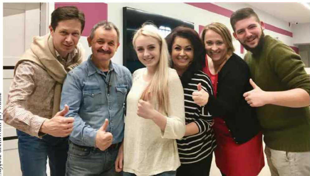
Spółecznicy z Kluczborka i okolic skrzyknęli się, aby wspólnie pomagać innym.

nie z karnawalem odbędzie się w Palacu w Pawłowicach. Tam również na balowiczów czekać będzie wspaniała zabawa i