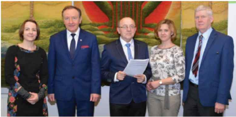
Umowa na dofinansowanie rozbudowy i modernizacji oczyszczalni ścieków i sieci kanalizacyjno-wodociągowej podpisana została w Warszawie.