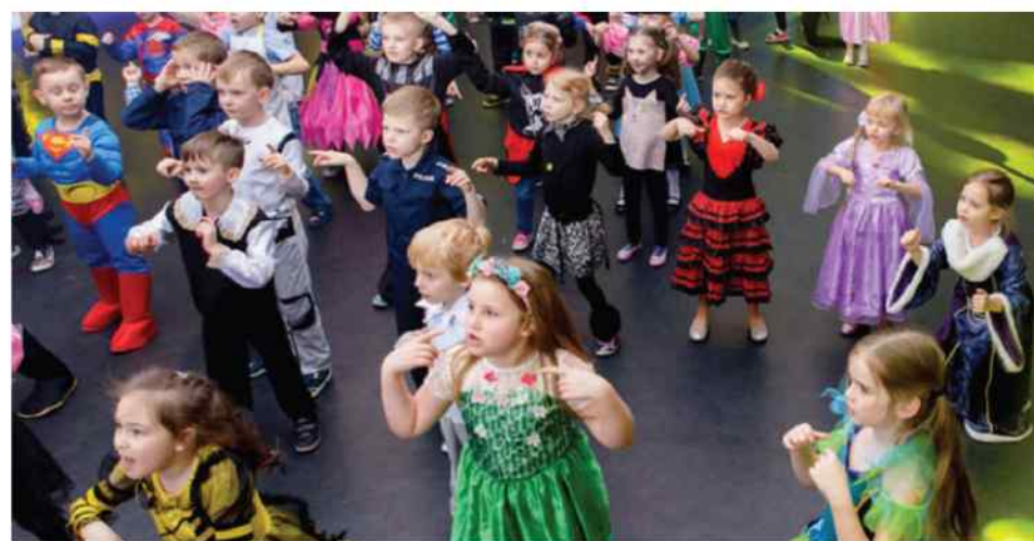
Parkiet dyskoteki nie pustoszał ani na moment.

- Jeszcze przez kilka następnych dni dzieci nie mówiły o niczym innym jak o balu, naprawdę był udany - podsumowuje dyrektorka. MK