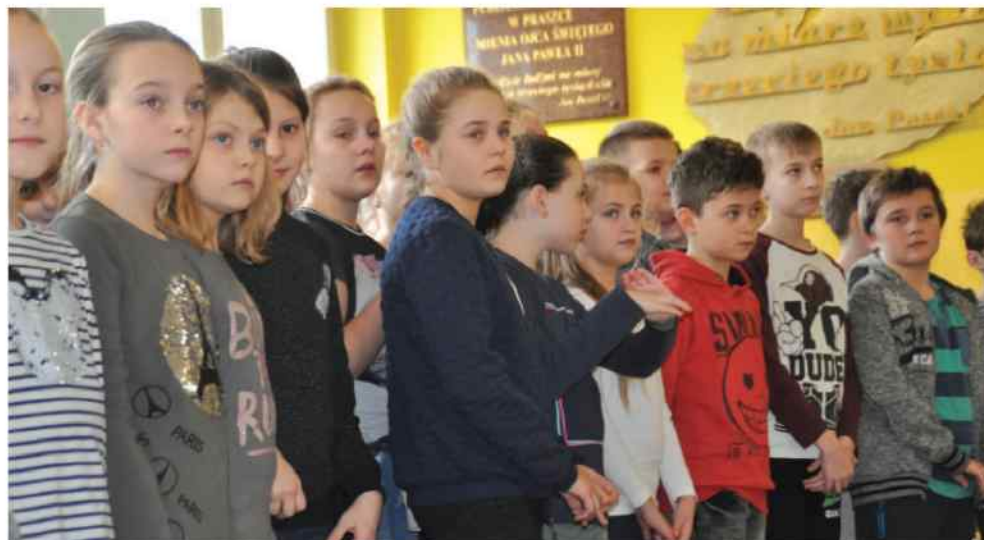
Na Pracownię Orange dzieci i młodzież z placówki czekali z niecierpliwością od kilku miesięcy. W dniu otwarcia nie ukrywali zadowolenia z tego powodu.