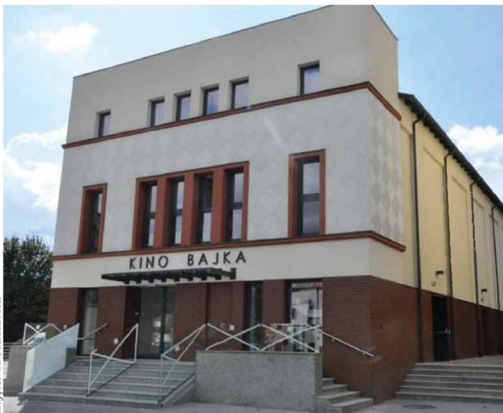
Kino „Bajka” zostało wyremontowane kilkanaście miesięcy temu. Niedawno jego ściany oszpecili wulgarne napisy i rysunki. Okazało się, że ich autorkami były kilkuletnie dziewczynki.