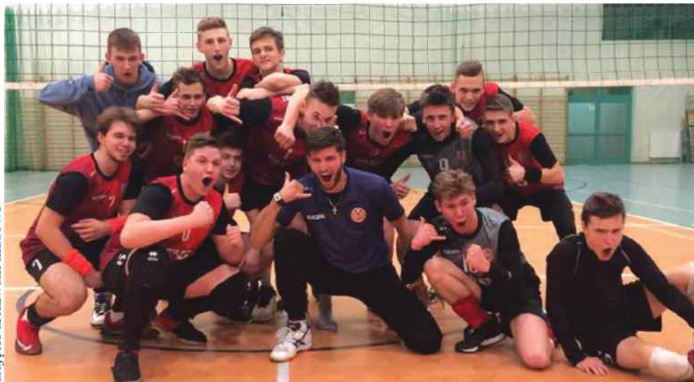
Gesty i twarze trenera oraz zawodników świadczą o olbrzymiej radości, jaką sprawił im awans do ćwierćfinałów mistrzostw Polski.

O awansie kluczborczyków zdecydował - rozegrany w środę 31 stycznia - mecz z UKS-em Strzelce Opolskie.