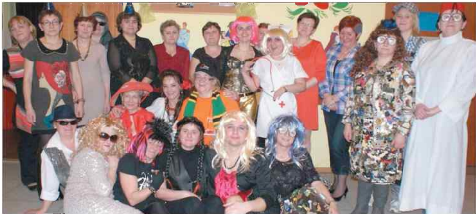
Na imprezie bawiło się prawie 30 pań

Podsumowano pierwszy rok prac związanych z rewitalizacją centrum Połomi