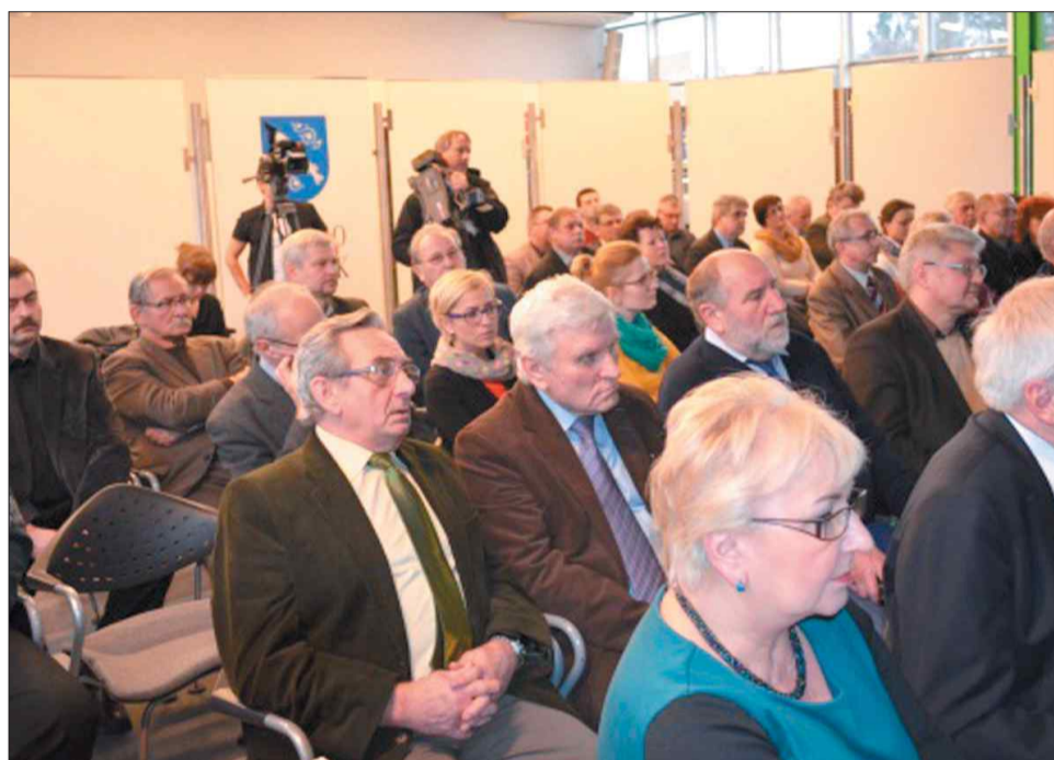
Spotkanie zainteresowało kilkudziesięciu mieszkańców

Najwięcej emocji wśród dyskutantów wzbudziły prezentowane podczas konferencji wnioski ze spotkania polskich i czeskich