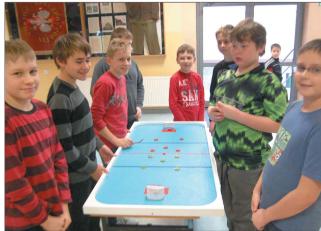
Chętnych do gry w hokeja stołowego w Skrzyszowie nie brakuje

Hokej stołowy, gra jeszcze przed kilkoma laty u nas prawie zupełnie nieznaną, zatacza coraz szersze kręgi. Właśnie zaczęli w nią grać uczniowie Zespołu Szkół w Skrzyszowie.