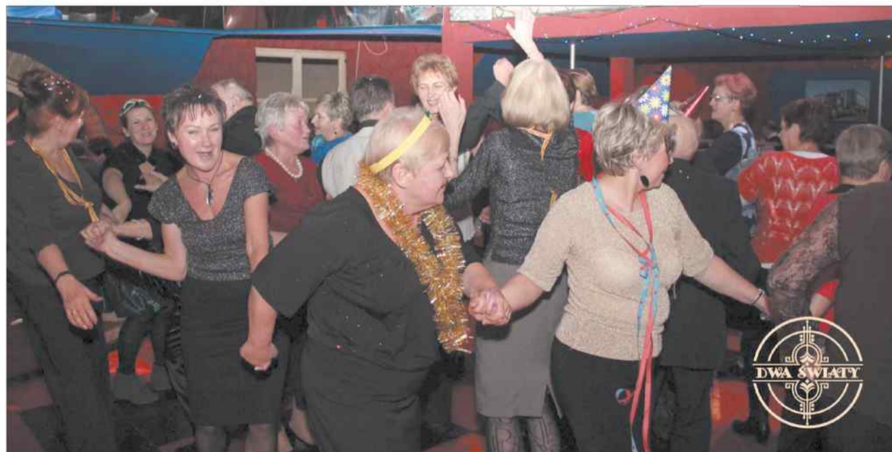
▲ Członkowie uniwersytetu bawią się w rytm muzyki, którą wybierają z didżejem