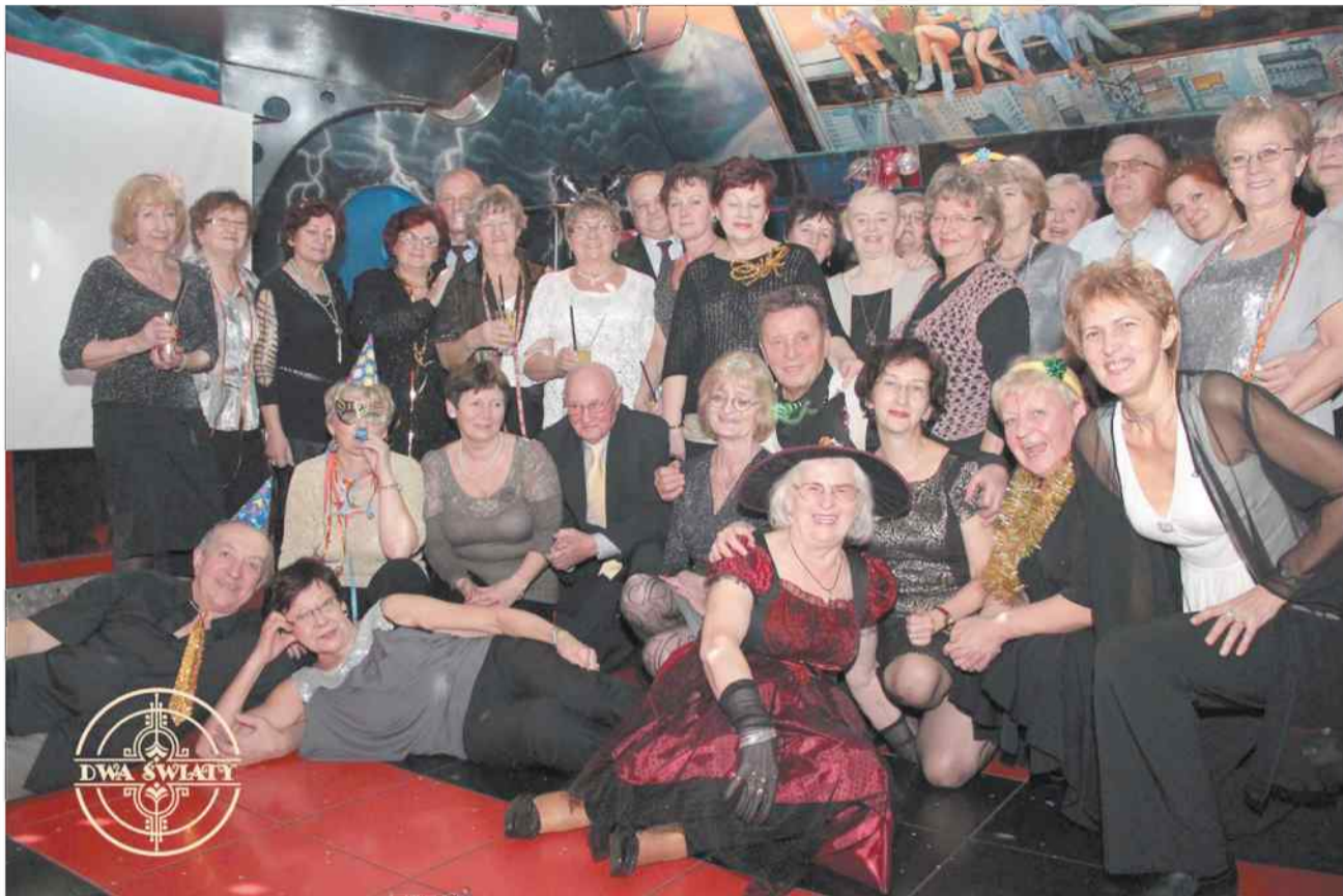
Chętnych do zabawy nie brakuje