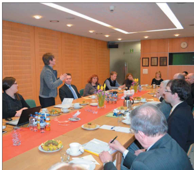
Na spotkaniu dyskutowano jak przeprowadzić nową akcję Funduszu

Kilkunastu przedstawicieli pozarządowych organizacji ekologicznych działających w województwie śląskim wzięło udział w zorganizowanym 29 stycznia w siedzibie Wojewódzkiego Funduszu Ochrony Środowiska i Gospodarki Wodnej w Katowicach spotkaniu konsultacyjno-informacyjnym.