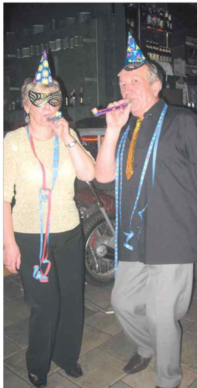
▲ Seniorom dopisują humory