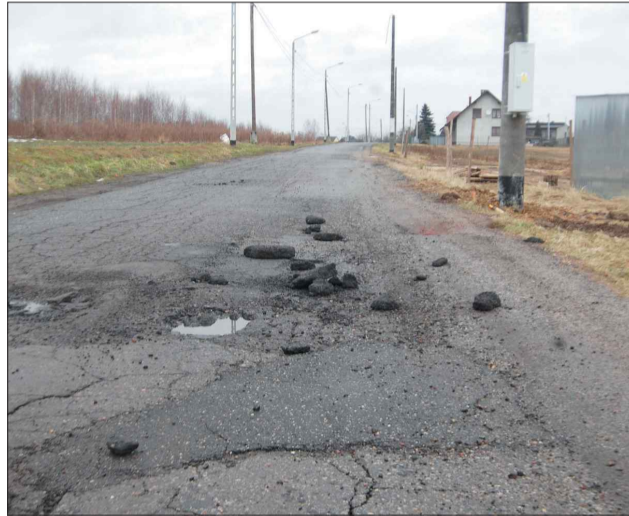
Jeszcze kilka dni temu w wielu miejscach drogi na ulicach Wodzisławskiej i Czarneckiego zalegały spore fragmenty asfaltu

PS Pod koniec tygodnia drogowcy z PZD uprzątnęli zalegające na jezdni kawały asfaltu, a powstałe w niej wyrwy zakatali doraźnie grysem asfaltowym.