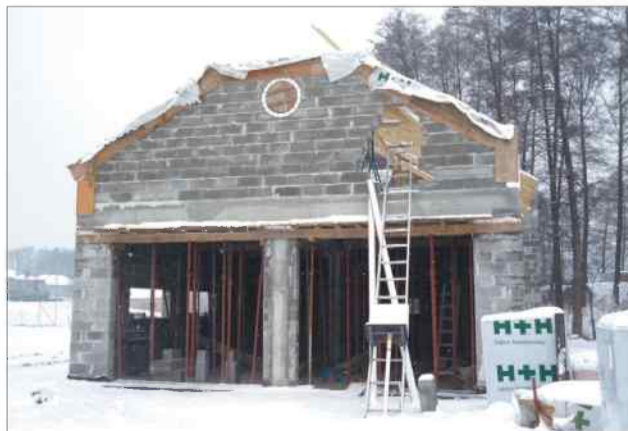
W Połomi zbudowano już budynek remisy OSP

POŁOMIA – Prace idą zgodnie z planem i termin oddania inwestycji 31 października tego roku nie jest zagrożony – mówi Piotr Kowol, inżynier kontraktu nadzorujący inwestycję związaną z rewitalizacją centrum Połomi.