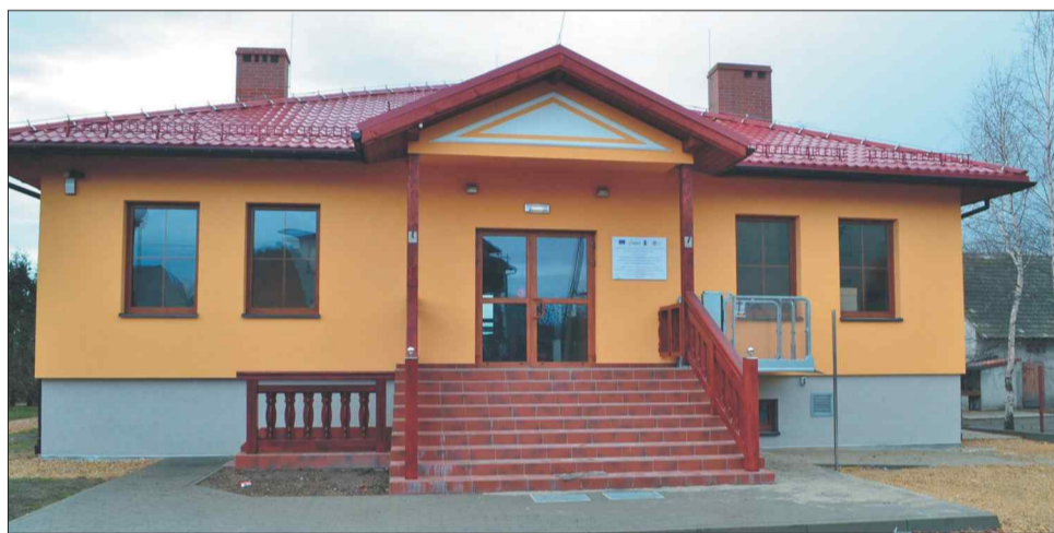
Budynek świetlicy w Osinach

Świetlica będzie czynna 3 razy w tygodniu – w środy od godz. 14.00 do godz. 20.00 oraz czwartki i piątki od godz. 13.00 do godz. 20.00. W sumie będzie więc otwarta 20 godzin tygodniowo. Zatrudniony został tu jeden instruktor na pół etatu. Jednocześnie na czas ferii godziny otwarcia obiektu zostały zmienione. W środy świetlica zaprasza od godz. 9.00 do godz. 15.00, a w czwartki i piątki od godz. 9.00 do godz. 16.00. Można już też zapisywać się na pierwsze dodatkowe zajęcia. Do 15 lutego zbierane są zgłoszenia do uczestnictwa w kursie nauki gry na instrumentach klawiszowych. Zajęcia poprowadzi Lidia Kucharczyk, muzyk-pedagog. Cena zajęć uzależniona będzie od ilości chętnych.