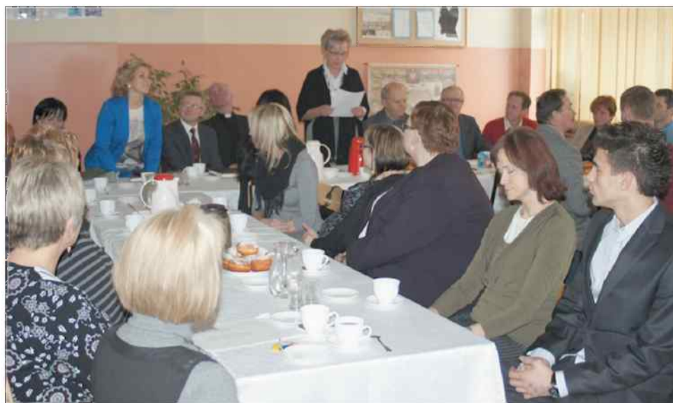
Na spotkanie do Zespołu Szkół w Gogołowej zaproszono rodziców, samorządowców i proboszcza parafii

Początek kampanii inwestycyjnej – „Wszyscy ciągną do Mszany”