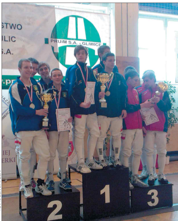
Drużyna Górnika Radlin na drugim stopniu podium Mistrzostw Polski