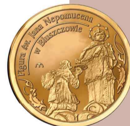
Awers numizmatu wydanego przez gminę z okazji 40-lecia...