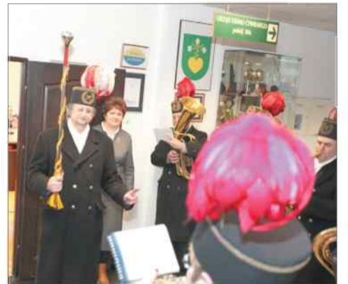
Skoro tradycja, to na uroczystości orkiestry dętej Kopalni Marcel zabraknąć nie mogło

które posługują się śląską mową, uznysłowi, że to nie powód do wstydu a oznacza pielęgnowanie lokalnych tradycji. – Już wcześniej wielu mieszkańców przychodziło i