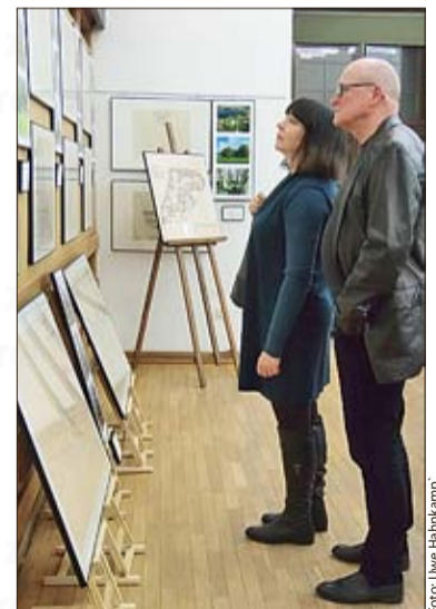
Besucher der Ausstellung vor den Schautafeln