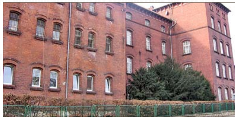
W tym budynku przetrzymywani byli więźniowie obozu w Toszku.