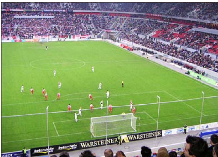
Esprit Arena w Düsseldorfie już za kilka miesięcy może stać się stadionem Bundesligi.