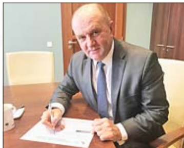
Der Opperler Woiwodschaftsmarschall unterstützt die Minority Safepack-Initiative.

W ubiegłym tygodniu pisaliśmy o posłach Platformy Obywatelskiej, którzy włączyli się w akcję wspierania inicjatywy Minority Safepack. Dla przypomnienia: celem inicjatywy