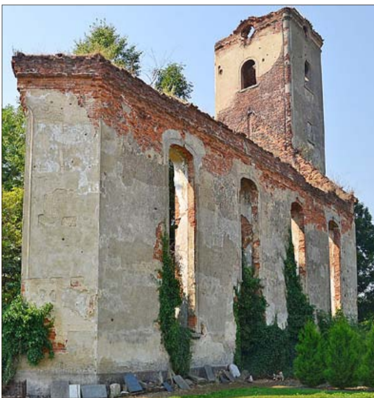
Die evangelische Kirche in Rösnitz, in der Arnold Hitzer wirkte, gibt es noch, allerdings nur als malerische Ruine

Die evangelische Kirche in Rösnitz steht heute noch immer als zerschossene