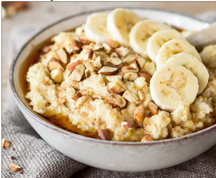
Płatki jaglane nadają się do spożywania z mlekiem, jogurtem czy owocami.

Mają również liczne właściwości upiększające. Dobrze wpływają na cerę, poprawiając stan skóry, a także wzmacniają włosy i paznokcie. Płatki jaglane stanowią też bardzo dobre źródło witamin z grupy B, które odgrywają ważną rolę w organizmie, utrzymując komórki w dobrej kondycji. Szczególny