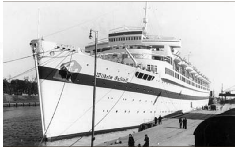
Das ehemalige KdF-Schiff „Wilhelm Gustloff“ in Danzig