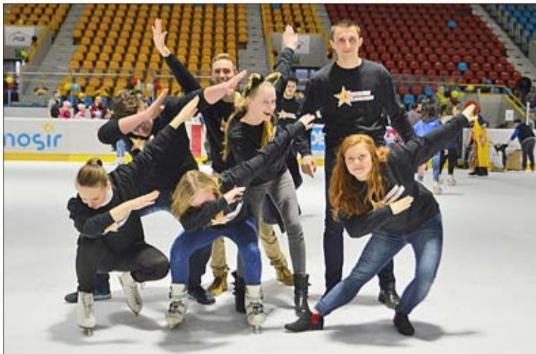
Wie gewohnt findet das Große Schlittern auf der Oppelner Eisbahn Toropol statt

Das Große Schlittern ist eine karitative Aktion, die vom BJDM jedes Jahr organisiert wird. Das diesjährige Motto lautet: „Funkelndes Schlittern – Hilfe vermitteln“. Diese Aktion wird für die Kinder aus den Kinderheimen in der Woiwodschaft Oppeln veranstaltet. Die erwachsenen Interessierten an dem aktiven Zeitvertreib müssen für den Eintritt nur 1 Złoty bezahlen. Der Gewinn aus dem Großen Schlittern, aus dem Verkauf der Eintrittskarten, wird für die Rehabilitation von Miriam Duda aus Sandowitz gespendet. Sie leidet an einer angeborenen unvollständigen Teilung