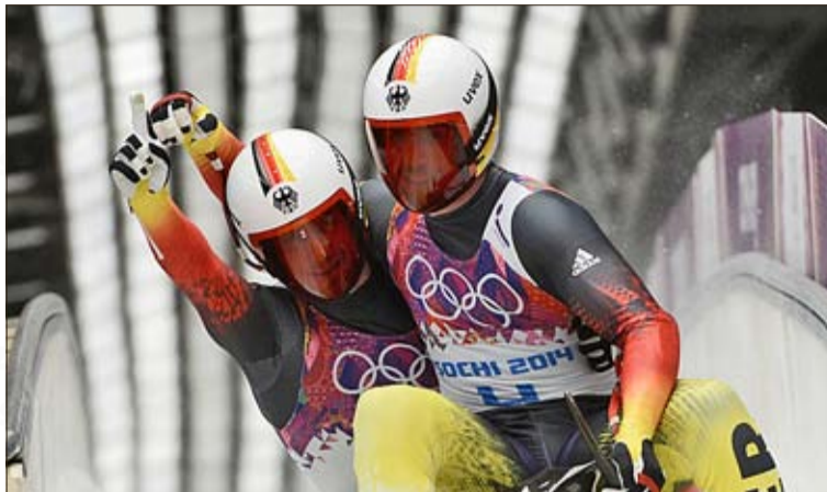
Nie ma co ukrywać – w Pjongczangu bardzo liczymy na niemieckich saneczkarzy.

ni olimpijskiej będzie to już 7. udział w igrzyskach (1992, 1994, 1998, 2002, 2006, 2014). Jeden start więcej na koncie będzie miał jedynie niekwestionowany rekordzista – niesamowity japoński skoczek narciarski, jej równolek – Noriaki Kasai. Przypomnijmy: w Rosji najczęściej wygranych świętowali saneczkarze, którzy zwyciężali we wszystkich konkurencjach – indywidualnie Natalie Geisenberger oraz Felix Loch, a także męski duet Tobiasów (Wendl/Arlt) i sztafeta złożona z wymienionych triumfatorów. W skokach narciarskich po złoto sięgnęła Carina Vogt oraz męska drużyna (Wank, Kraus, Wellinger, Freund). W rywalizacji w kombinacji norweskiej na normalnej skoczni + bieg na 10 km nie do pokonania był Eric Frenzel. Na zakończenie olimpijskiej kariery tytuł z Vancouver w superkombinacji obroniła alpejka Maria Höfl-Riesch. Ze złotego grona wywalczonych w Rosji do obrony tytułu przystąpią wszyscy