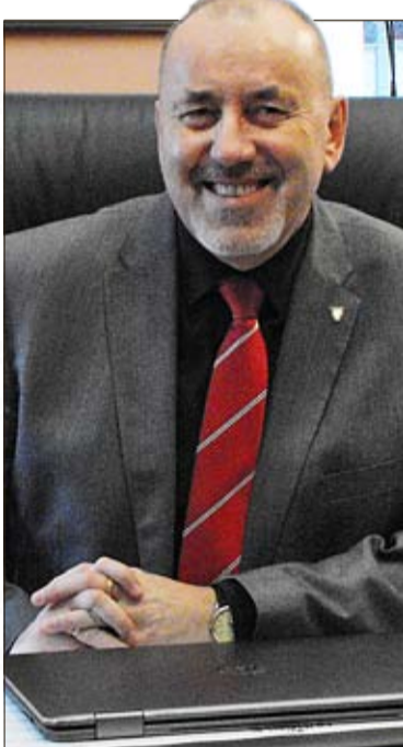
Henryk Lakwa, der Landrat von Oppeln

Ciekaw jestem, jak wyglądają priorytety starostwa opolskiego na najbliższe