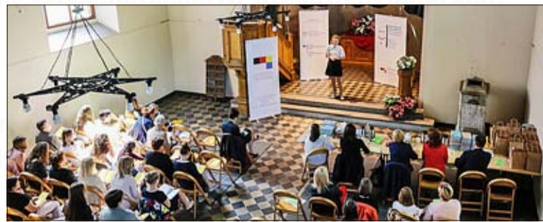
W tym roku finał konkursu po raz pierwszy odbędzie się w Opolu.