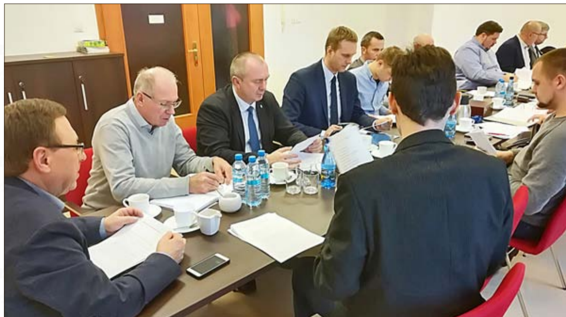
Das Wahlprogramm der Deutschen Minderheit wird auf der Basis früherer Wahlkämpfe aufgebaut

Nebenbei sei erwähnt, dass die viel diskutierte Parteigründung der Deutschen Minderheit zunächst einmal in der Schublade landen soll. Sie wird nur