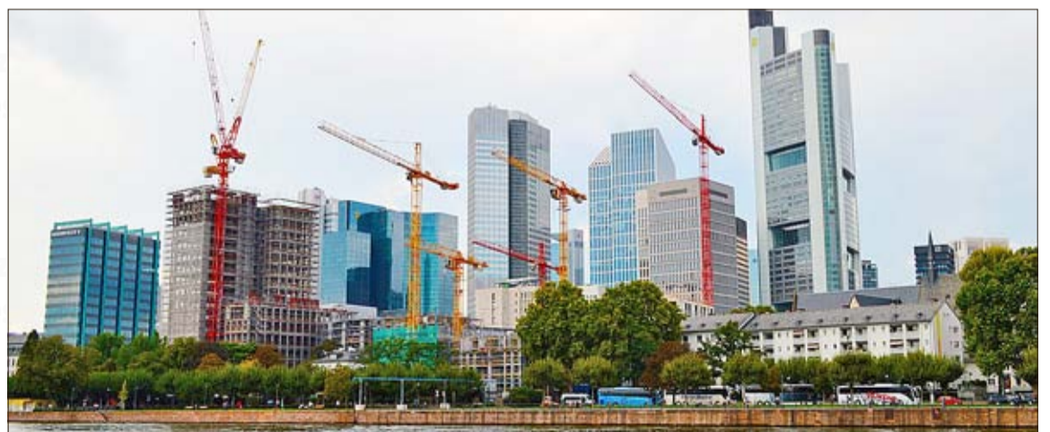
In Frankfurt am Main lässt sich deutschlandweit am besten verdienen

zumindest aus den Daten des Portals Gehalt.de hervor. So verdient beispielsweise ein Akademiker in Frankfurt am Main und in anderen größeren Städten Hessens wie etwa Wiesbaden oder Darmstadt am Anfang seiner beruflichen Laufbahn im Schnitt 51.517 Euro brutto im Jahr. Ein Pendant in Mecklenburg-Vorpommern hingegen – für deutsche Verhältnisse – „nur“ 33.587