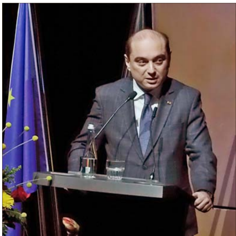
Basil Kerski, Leiter des Europäischen Zentrums der Solidarność in Danzig