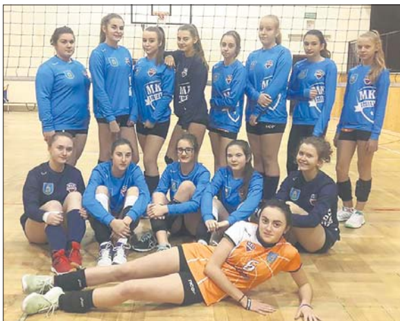
Siatkarki MKS wygrały 2:0