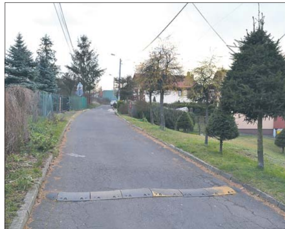
Mieszkańcy chcą zakazu ruchu nieobejmującego ich samych

Łączna to jednokierunkowa droga równoległa do Obrzeźnej Zachodniej, leży pomiędzy ul. Jasińskiego a Oswobodzenia na katowickim Janowie. Do niedawna poruszali się po niej głównie lokalni mieszkańcy, ale w pewnym momencie kierowcy, którzy rano Obrzeźną kierują się na Katowice zorientowali się, że przez Łączną mogą ominąć zator, jaki tworzy się na skrzyżowaniu tej drogi z ul. Oswobodzenia. Wtedy zaczęły się problemy, bo ze spokojnej uliczki Łączna w godzinach porannych zamienia się w autostradę. Tyle tylko, że droga nie jest przystosowana do takiego ruchu. Przede wszystkim nie ma chodnika, wiele kierowców ignoruje ograniczenie prędkości, a zapadnięte progi zwalniające nie spełniają swojej funkcji. Z tych powodów piesi – a w szczególności dzieci, które idą rano do szkoły – czują się zagrożeni. – Ruch jest taki, że mamy nawet problem żeby wyjechać ze swoich posesji. Dlatego zwróciliśmy się do miasta o postawienie znaku zakazu ruchu z wyjątkiem mieszkańców – mówią mieszkańcy ulicy. Takiego samego jak przy starej drodze na Imielin w Kosztowach.