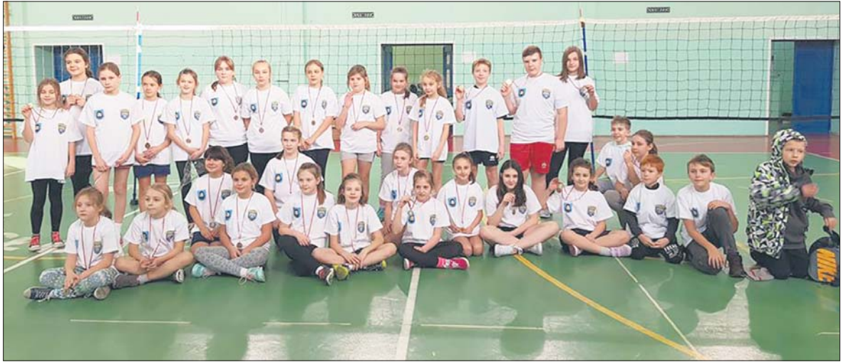
W turnieju wzięli udział dzieci w wieku 9-12 lat

Ta mikołajkowa impreza mogła się odbyć dzięki pomocy finansowej Urzędu Miasta Mysłowice, a także życzliwości MO-SiR Mysłowice, który użyczył nam nieodpłatnie halę sportową. Turniej zorganizowany został dla dzieci z naszego miasta w wieku 9-12 lat. Wiadomo jak trudno teraz oderwać dzieci i młodzież od ekranów laptopów i smartfonów, dlatego też wielkie słowa uznania dla tych kilkudziesięciu młodych adeptów sztuki siatkarskiej, którzy stawili się wraz z grupą swoich najbliż-