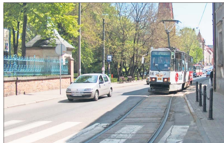
Modernizacja torowiska obejmie odcinek od ul. Bytomskiej do Powstańców