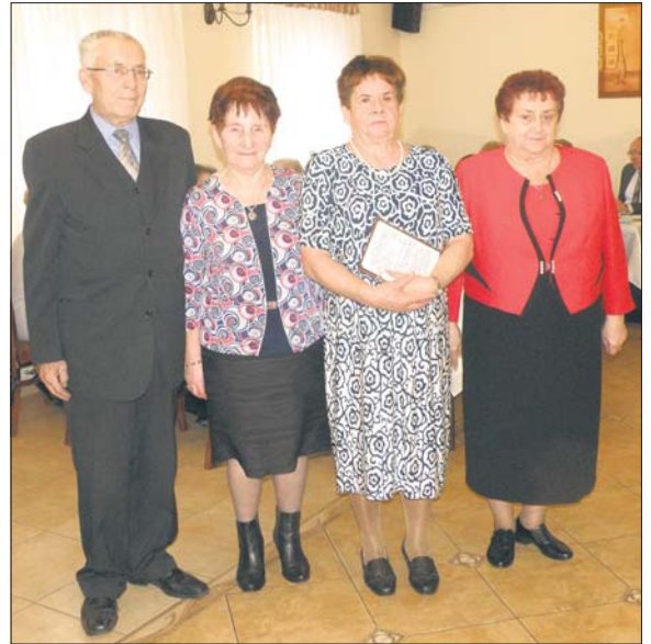
Przedstawiciele zarządu rejonowego złożyli seniorom życzenia świąteczne

Przewodnicząca zarządu przypomniała, że podziękowania za całoroczną pomoc związkowi, za współpracę i okazywane serce emerytom, ale też za wkład w organizację również tego spotkania opłatkowego należą się władzom miasta. (SA)