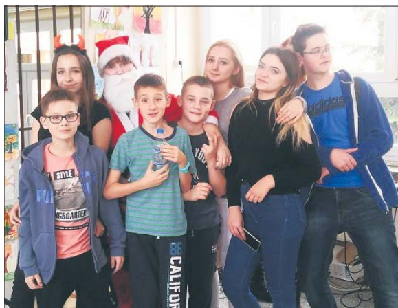
Za wykonane zadania Mikołaj rozdawał słodkie nagrody