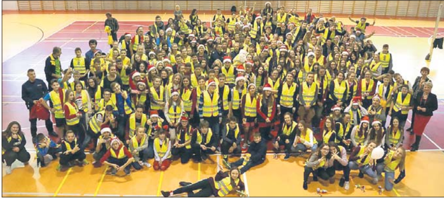
Uczniowie SP1 otrzymali odblaskowe kamizelki

B lisko 300 uczniów Szkoły Podstawowej nr 1 w Imielinie będzie bardziej widocznymi na drodze. O poprawę bezpieczeństwa młodzieży tym razem zadbał nie tylko policjanci, ale też dyrekcja szkoły i samorząd miasta, który zakupił dla dzieci odblaskowe kamizelki.