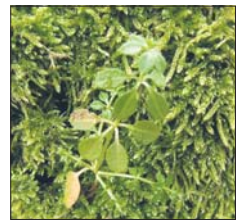
Rokit i przytulia

Penetrację lasu bardzo utrudniał padający deszcz. Poza tym gruba warstwa opadłych liści oraz leżący tu i ówdzie śnieg także nie ułatwiałąś zadania. Tym niemniej to i owo dało się za-