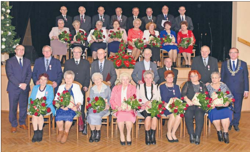
Pamiątkowa fotografia złotych i diamentowych par

W „Sokolni” 7 grudnia spotkały się pary małżeńskie, które w tym roku obchodziły złote gody, czyli pięćdziesięciolecie zawarcia związku małżeńskiego, a także pary, które świętowały swoje diamentowe gody – 60 lat ślubu.