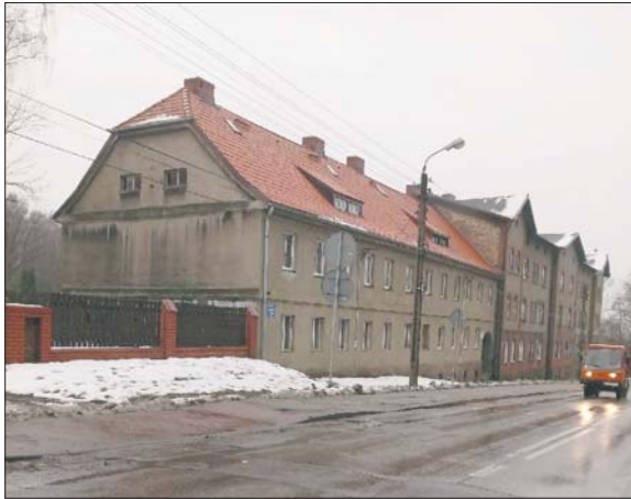
Szkoła na Laryszu z 1914 roku

Ponieważ w kacie między dobrami biskupów krakowskich a dobrami panów pszczyńskich występowały płytkie pokłady węgla, baron Larisch w 1790 roku założył kopalnię, która na jego