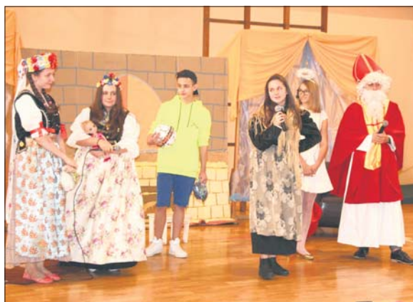
W przedstawieniu przybliżono postać św. Mikołaja