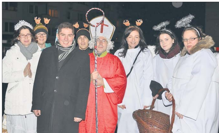
Św. Mikołaj i jego pomocnicy