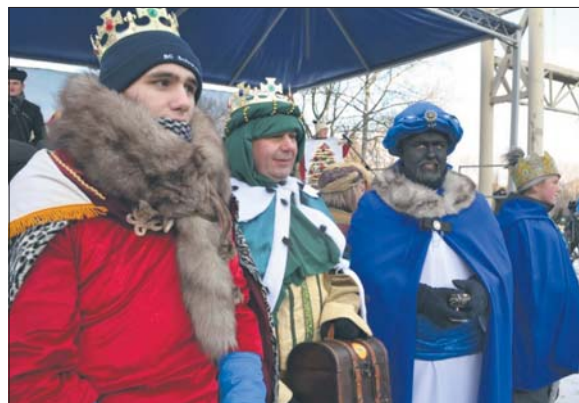
Mysłowiccy Trzej Królowie 2017

Orszak Trzech Króli to ogólnopolskie przedsięwzięcie, w które do roku na rok włącza się coraz więcej miast i miasteczek. Akcja nazywana jest największymi jasełkami ulicznymi na świecie. Przez setki miejscowości 6 stycznia, Święto Trzech Króli, przechodzą trójkolory, radosne orszaki, na czele których kroczą królowie Kacper, Melchior i Baltazar. Tak będzie również w Mysłowicach.