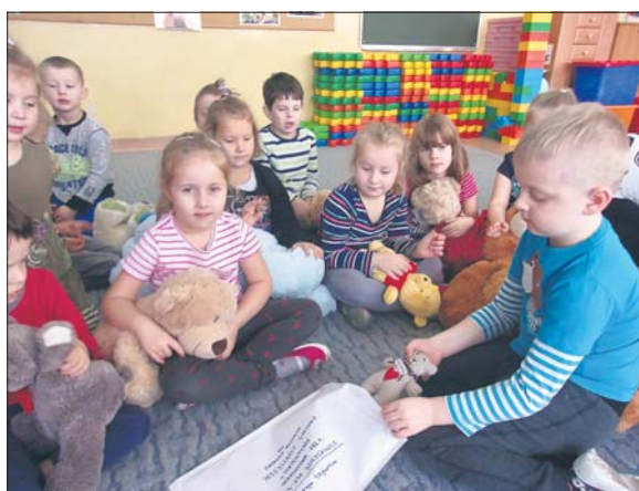
Miś Franek wyruszył z Krasów w podróż po Polsce

W tym samym czasie grupę „Delfinki” odwiedził już miś Tosiek z Przedszkola nr 1 „Bajkowy Zamek” z Poznania i miś Bru-