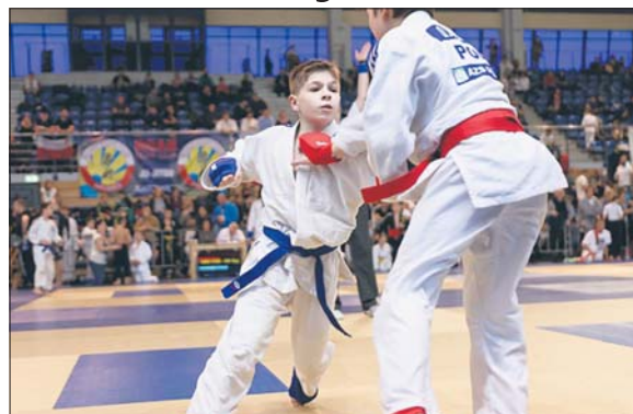
UKS Judo wywalczył kolejne medale