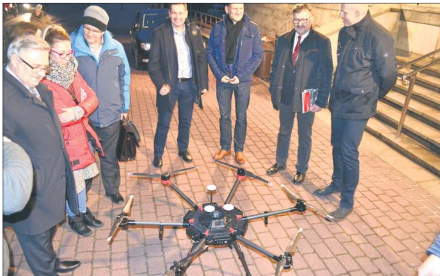
Pracownicy GIG zaprezentowali m.in. nowatorskie latające laboratorium