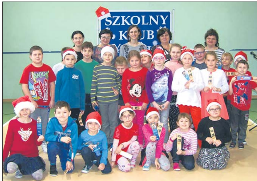
Uczniowie poznali oryginalną japońską sztukę opowiadania historii

W pierwszym tygodniu grudnia Gminna Biblioteka Publiczna w Chełmie Śl. gościła z teatrzykiem obrazkowym Kamishibai w chełmskim Przedszkolu, Szkole Podstawowej nr 1, a także Szkole Podstawowej nr 2.