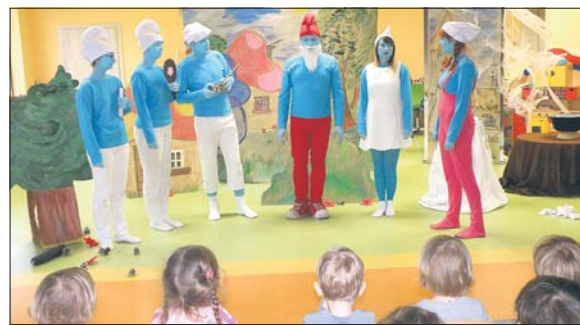
W bajce zagrali rodzice przedszkolaków

W yjatkowym dniem w Przedszkolu nr 10 w Koszowach był 8 grudnia. W tym dniu do dzieci zawały lubiane przez nich smerfy.