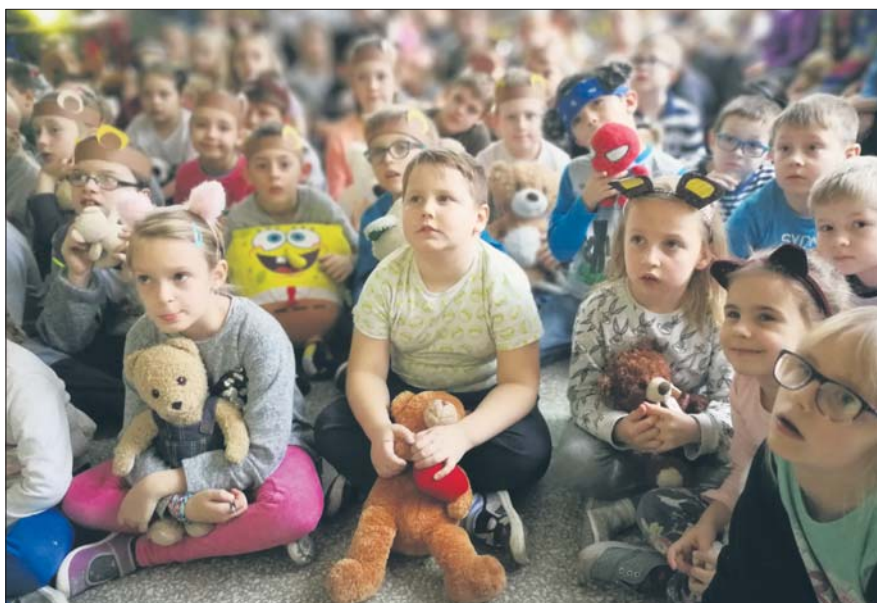
Uroczystość przygotowali dla młodszych kolegów uczniowie klas trzecich

W Szkole Podstawowej nr 10 z Oddziałami Dwujęzycznymi im. Karola Miarki w Mysłowicach 27 listopada był obchodzony Światowy Dzień Pluszowego Misia.