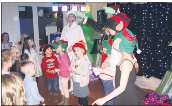
Dzieci bawiły się z elfami i oczekiwały na swoje prezenty

Była to świetna zabawa dla ponad czterdziestu dzieci, które prawie dwie godziny bawiły się z elfami i oczekiwały na swoje prezenty. Były to zimowe i świąteczne gry, zabawy, konkursy które umiliły czas oczekiwania. Na zakończenie zabawy dzieciaki wreszcie doczekały się przyjazdu ulubionego świętego, który rozdał dzieciom paczki i prezenty. Każde dziecko na zakończenie zabawy otrzymało też świąteczne pierniczki. (SA)