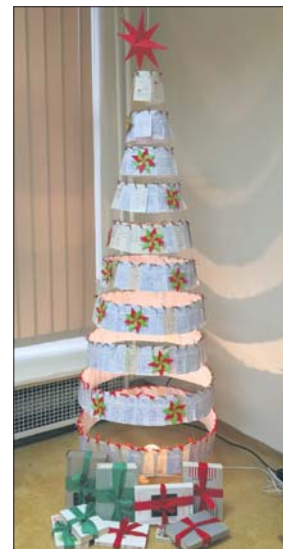
To pomysłowe drzewko można podziwiać w filii MBP przy ul. Oświęcimskiej