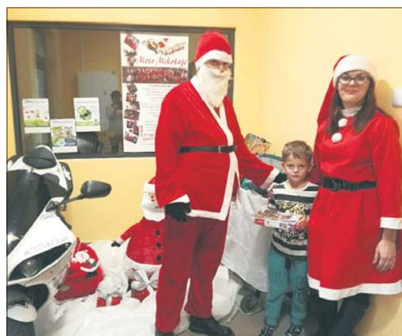
W koszu z prezentami znalazły się zabawki, gry, książeczki i układanki