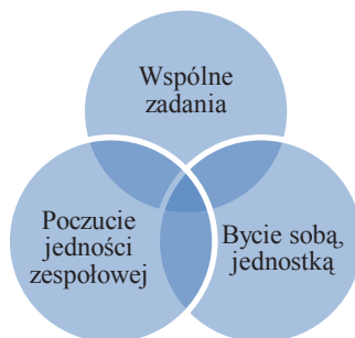
Rysunek 3. Trójczłonowy model potrzeb Figure 3. Tripartite model of needs

Źródło: J. Adair, Anatomia biznesu. Motywacja. W jaki sposób wydobywać z innych to, co najcenniejsze , Wydawnictwo Studio Emka, Warszawa 2000, s. 100.