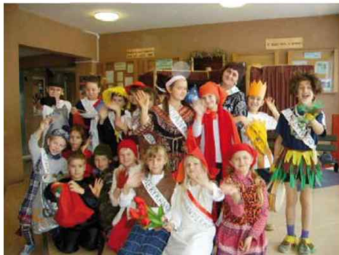
Gimnazjum w Solarni - Grupa teatralna przedstawiająca konkursową sztukę pt. "Europejski Czerwony Kapturek" - więcej na str. 8