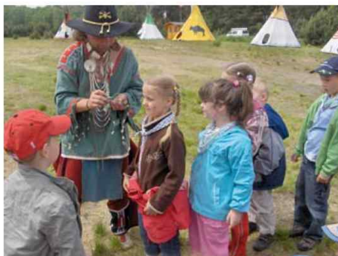
Przedszkolaki z Dziergowic w Indiańskiej Wiosce - więcej na str. 8