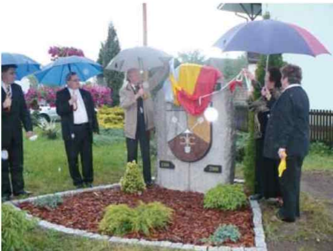
Odpust parafialny połączony z obchodami 700 - lecia Bierawy