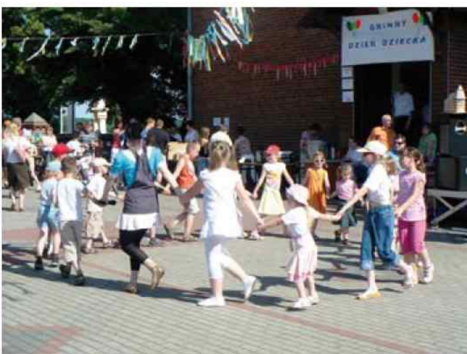
Dzień Dziecka - Stare Koźle - więcej na str. 10