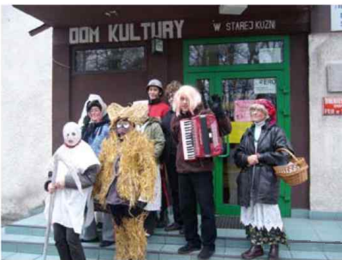
Babski Comber - Stara Kuźnia - więcej na str. 10