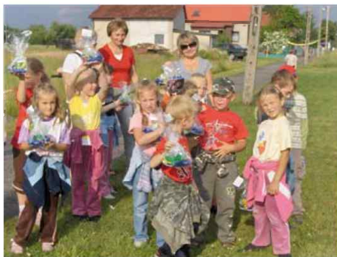
Przedszkolaki z Dziergowic - więcej na str. 8