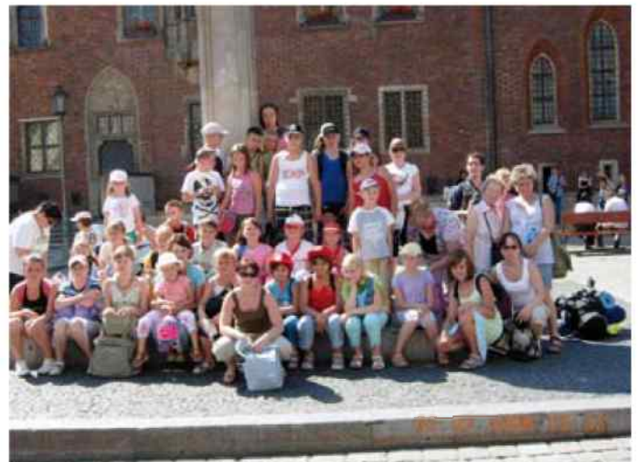
Wakacje - wycieczka do Wrocławia