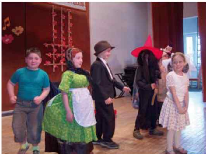
Gminny przegląd twórczości przedszkolnej i szkolnej