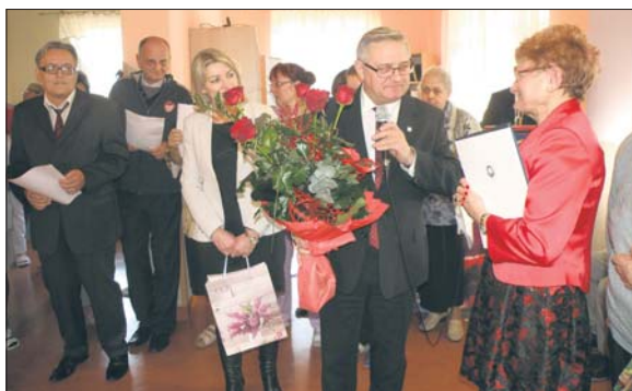
Kwiaty i życzenia dla odchodzącej dyrektorki