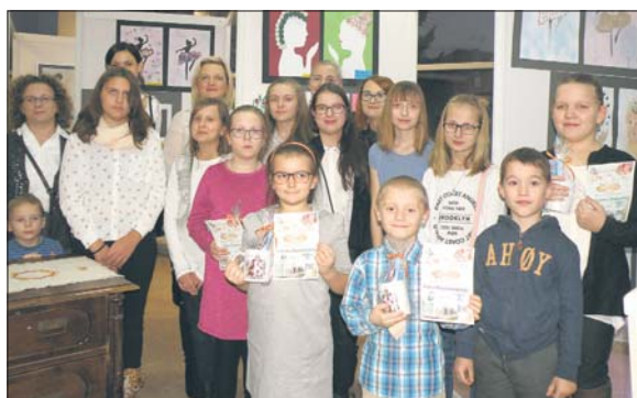
Wystawę prac młodych artystów można oglądać w bibliotece