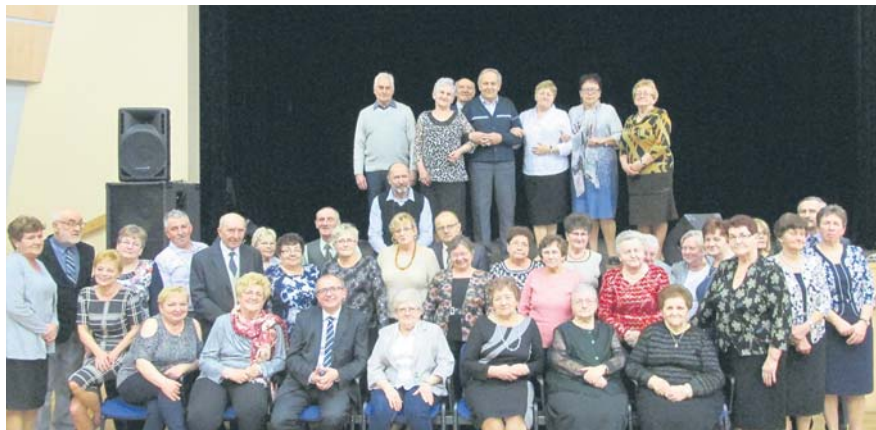
Uczestnicy spotkania z okazji Dnia Chorego

Z okazji Światowego Dnia Chorego i Dnia Inwalidy członkowie Imielińskiego koła spotkali się w „Sokolni”.