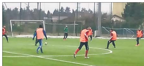
Mimo porażki Kocina pokazała się z dobrej strony

W drugiej połowie gra ponownie była wyrównana, ale Kocina szybko objęła prowadzenie, a tym razem na listę strzelców wpisał