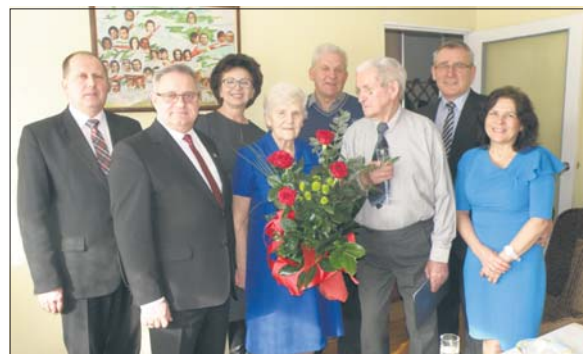
Jubilatcy z przedstawicielami urzędu i bliskimi

Ślub cywilny wzięli w lutym 1952 roku, w kwietniu tego samego roku stanęli przed ołtarzem w kościele. Wierność małżeńską ślubowali sobie w Piaskach, bo pochodzą z poznańskiego. Zraz potem przyjechali na Śląsk,