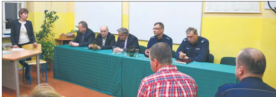
Rada dzielnicy zaprosiła do siebie m.in. komendantów policji i straży miejskiej

Sporo udało się już zrobić, przestępczość w dzielnicy spadła, wiele spraw ciągle jest jednak do załatwienia. Jednym z poważniejszych problemów dzielnicy jest rozkradanie kopalni „Mysłowice” – mówili uczestnicy spotkania, jakie w zeszły czwartek odbyło się w dzielnicy Piasek.