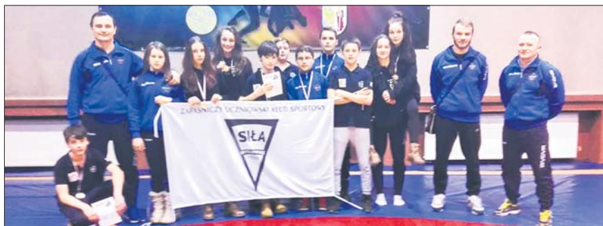
Zawodnicy Siły Mysłowice zdobyli siedem medali