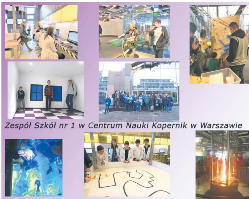
Zespół Szkół nr 1 w Centrum Nauki Kopernik w Warszawie

W mroźny piątek, 10 lutego o godzinie 4 rano młodzi miłośnicy przedmiotów matematyczno–przyrodniczych z Zespołu Szkół nr 1 w Mysłowicach wyruszyli do stolicy, by uczyć się w Centrum Nauki Kopernik.