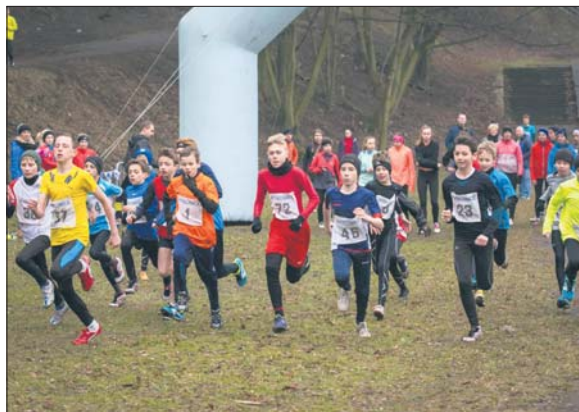
Tak było w ubiegłym roku