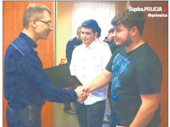
Komendant osobiście podziękował mężczyznom za pomoc w zatrzymaniu kierowcy

Dwóch młodych mieszkańców Myślowic 29 stycznia uniemożliwiło dalszą jazdę pijanemu kierowcy. Za godną naśladowania postawę dzisiaj mężczyznom podziękował osobiście komendant myślowickiej policji.