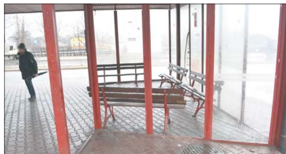
Wartość szkód wyrządzonych przez wandalów to 1500 zł

Skąd zatem się bierze ten strach przed odwołaniem prezesa wodociągów? Można odnieść wrażenie, jakby to prezes miał w rękach prezydenta, a nie odwrotnie. Osobiście radzę coś z tym z zrobić, zanim nie dojdzie do katastrofy gospodarczej. Co daję pod rozwagę.