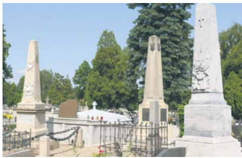
Pomniki poległych: pierwszy od prawej – pruski, pierwszy od lewej – austriacki. Po środku późniejszy – polski z 1939 r.