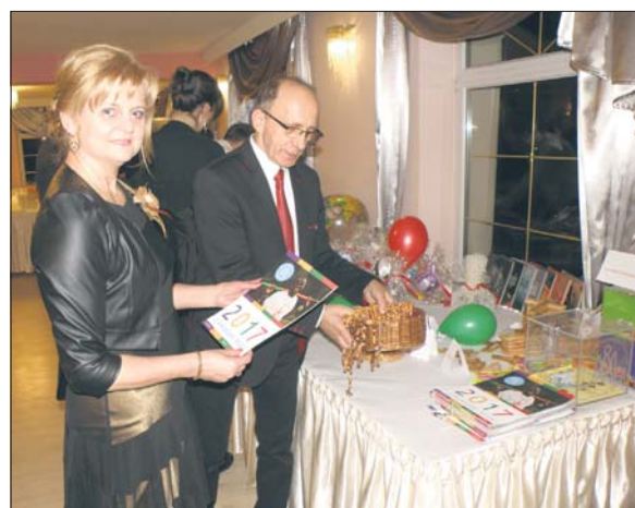
Na balu można było nabyć wyroby z krajów azjatyckich i afrykańskich

Oprócz stoisk, dodatkową atrakcją imprezy była również licytacja przedmiotów przywiezionych przez misjonarzy i loteria na 300 fantów.