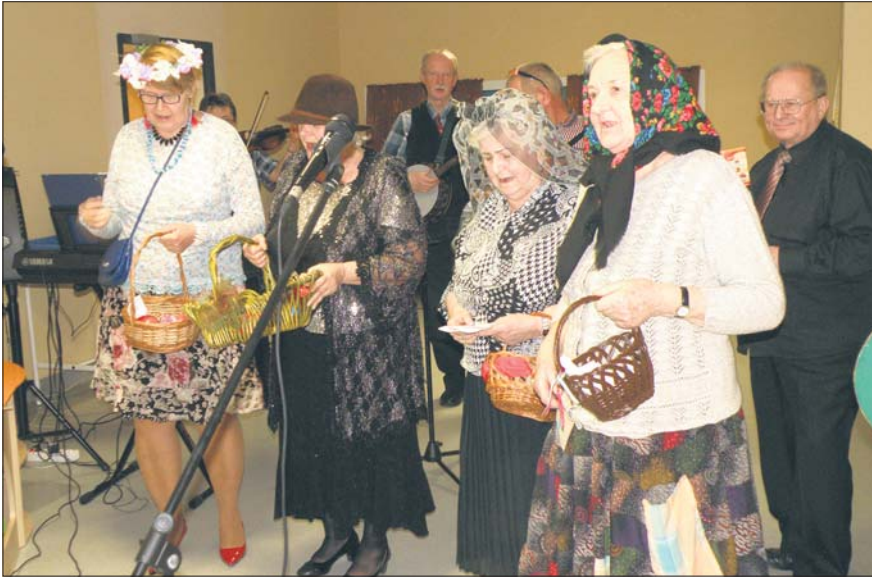
Kabaret bawił do łez

W Dziennym Domu Senior Wigor w Brzezince odbył się bal karnawałowy, w którego organizację włączyła się Mysłowicka Rada Seniorów.