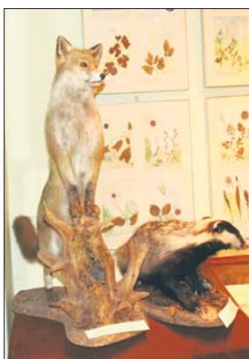
Lis i borsuk

Na wystawie poza gablotą znajdują się między innymi lis i borsuk. Ten pierwszy także wprowadził się do miast, ale mniej rzuca się w oczy niż dziki. Nasz drugi celebryta został znaleziony w Trzebinii, niedaleko tamtejszego wysypiska śmieci, kiedy zaklinał się pomiędzy sztachetami pyłkiem w stronę ulicy. Dlatego piszę o nim, że jest ofiarą nieudanej próby skoku przez płot. To zwierzę na swoją kolej czekało zalane sporą ilością skażonego spirytusu. Potem dorzuciłem mu do towarzystwa kolejne zwłoki. Tak po-