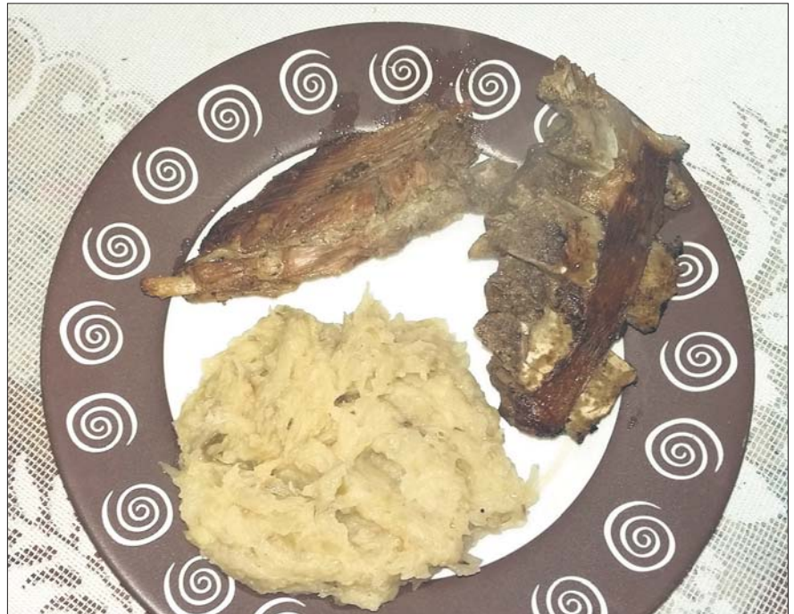
Ciapkapusta z zęberkami

Kapusta była przez wieki bardzo ważnym elementem śląskiej kuchni. Nie jest ona rośliną rodzimą, ale dosyć wcześnie zadomowiła się na śląskiej ziemi, bo zapewne już w XVI wieku. Przywieziono ją z kręgu śródziemnomorskiego. Jednak bardzo szybko zakrólowała na śląskich stołach.