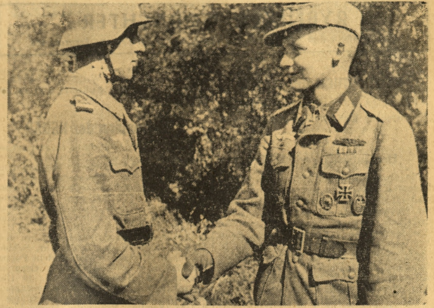
PK-Aufnahme: Kriegsber. Hodea (Sch)

Diese hatte ihre Verbände weit rückwärts konzentriert und es dabei deutschen Divisionen allein überlassen, den übermächtigen Feinddruck aufzuhalten. Dieser Bruch der Vereinbarungen und diese jeder Bündnisverpflichtung hohnsprechende Handlungsweise, die nur mit dem Einverständnis Ambrosios unternommen werden konnte, erschien bereits zu diesem Zeitpunkt als Tarnung eines mehr oder weniger bewußten Verrats, der durch die allgemeine Gleichgültigkeit der italienischen Führung nur noch unterstrichen wurde.