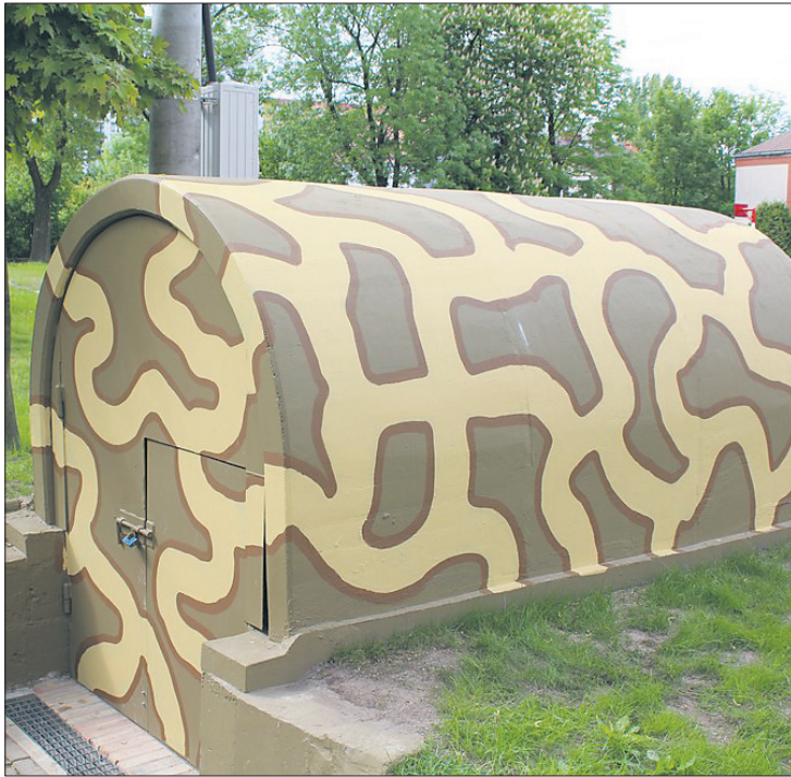
Miechowski schron to spora atrakcja turytyczna.

Prace remontowe w podziemnym obiekcie prowadzono niemal przez rok. W tym czasie między innymi oczyszczono i zaadaptowano zalany wodą korytarz, u wejścia do niego zamontowano żelbetowe łuki, które go przykryły, a po wszystkim doprowadzono do obiektu prąd. Dzięki tym inwestycjom, ale przede wszystkim dzięki ogromnemu zaangażowaniu członków wspomnianego