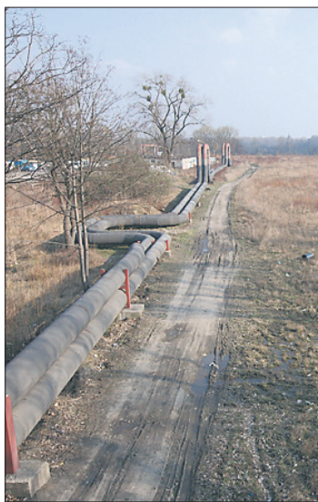
Becetka ma biec m.in. przez tereny dawnej kopalni Szombierki.