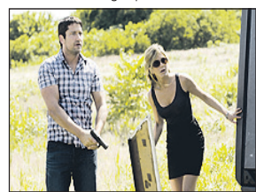
20.05 Dorwać byłą - komedia romantyczna 22.40 Księżniczka i żołnierz - melodramat, USA 0.25 Kabaretowa Ekstraklasa