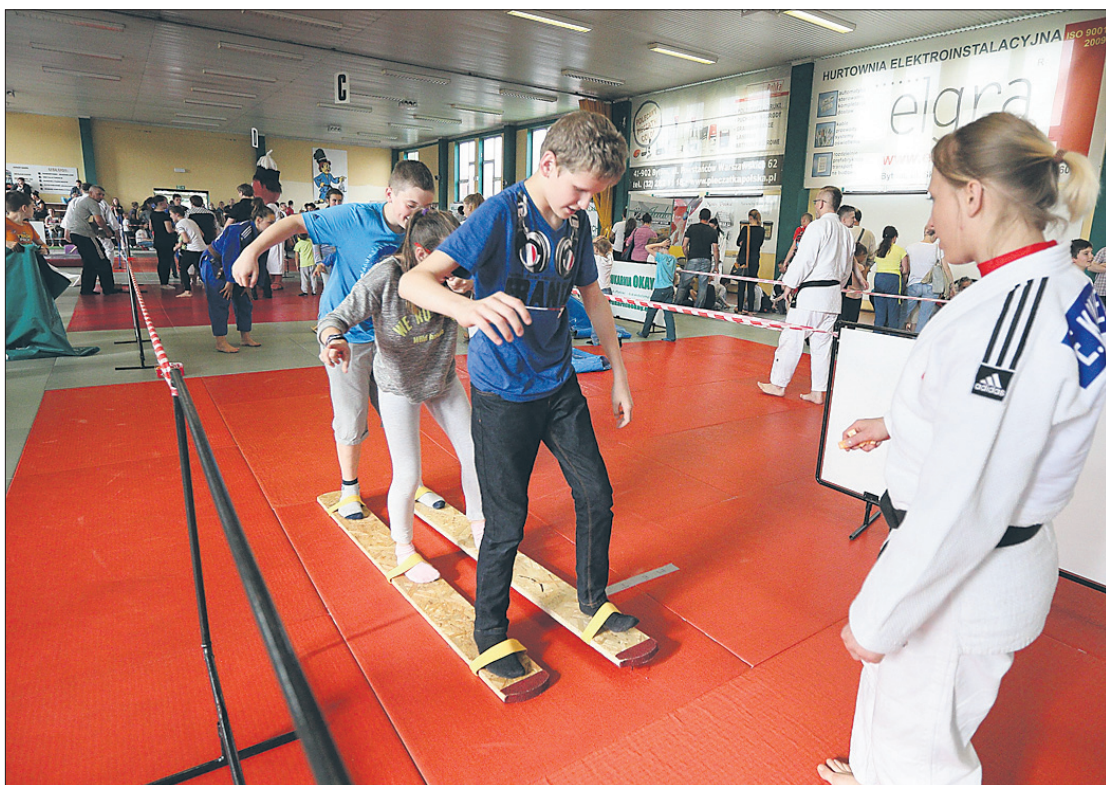
Niekóre zabawy wymyślone przez Czarnych okazały się trudne do wykonania.