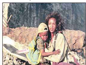
20.50 Dzień niepodległości - film sci-fi, USA, 1996, reż. Roland Emmerich, wyk. Will Smith, Bill Pullman, Mary McCormack, Jeff Goldblum, Randy Quaid 23.55 Highlights EURO 2016 - magazyn 0.10 Trzy cale - film akcji USA, 2011, reż. Jace Alexander 2.00 Tajemnice losu