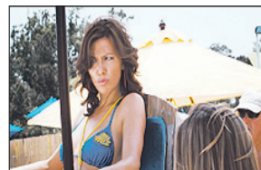
23.30 Pirania - horror, USA, 2010, reż. Alexandre Ajaja 1.15 Tajemnice losu