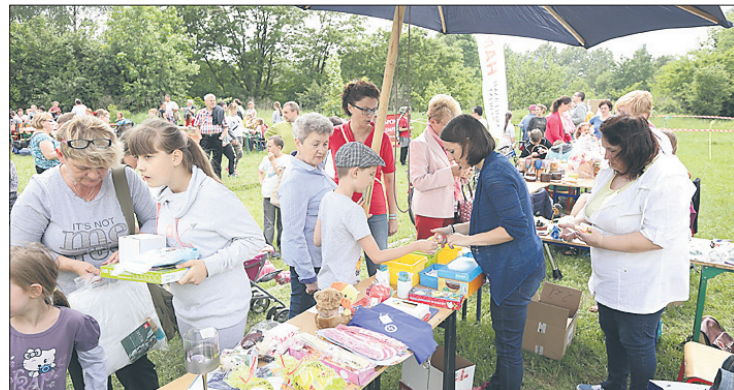
W programie festynu znalazło się mnóstwo atrakcji.

strażaków, tresury psów policyjnych oraz teakwon-do w wykonaniu zawodników BSK Sonso. Dzieci malowały twarze, wzięły udział w warsztatach plastycznych, zabawy z chustą animacyjną „Klanza”, w zawodach strzeleckich, grze w piłkarzyki i w meczu ringo. Odbyły się warsztaty kulinarne Erasmus + European food passport z degustacją potraw kuchni portugalskiej, łotewskiej i holenderskiej. Maskotka „Haluś” z tarnogórskiego CHU Hala częstowała najmłodszych słodyczkami. Imprezę wsparło wielu sponsorów.