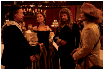
Dziewczyna, która została królem