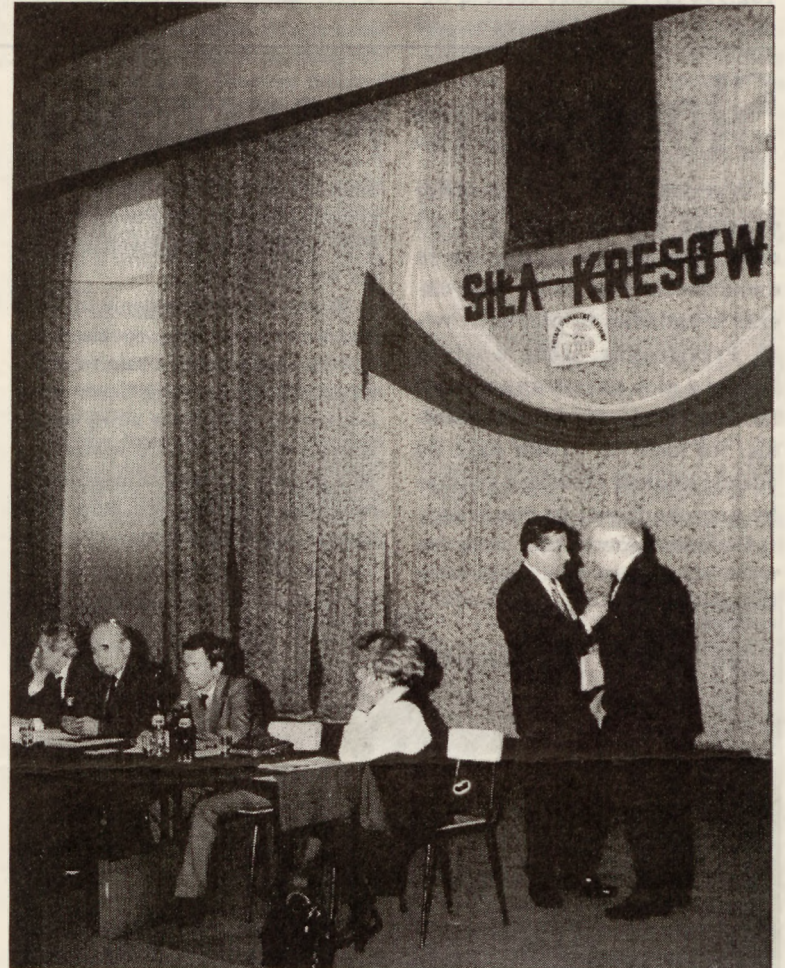
W oczekiwaniu na ogłoszenie wyników głosowania