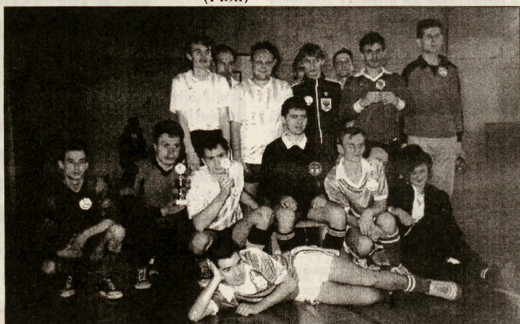
Zwycięcy I Turnieju Wiosennego

Zwycięska drużyna otrzymała pamiątkowy puchar i dyplomy, a pozostałe „czwórki” statuetki i dyplomy.