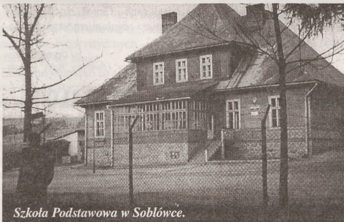
Szkoła Podstawowa w Soblówce.