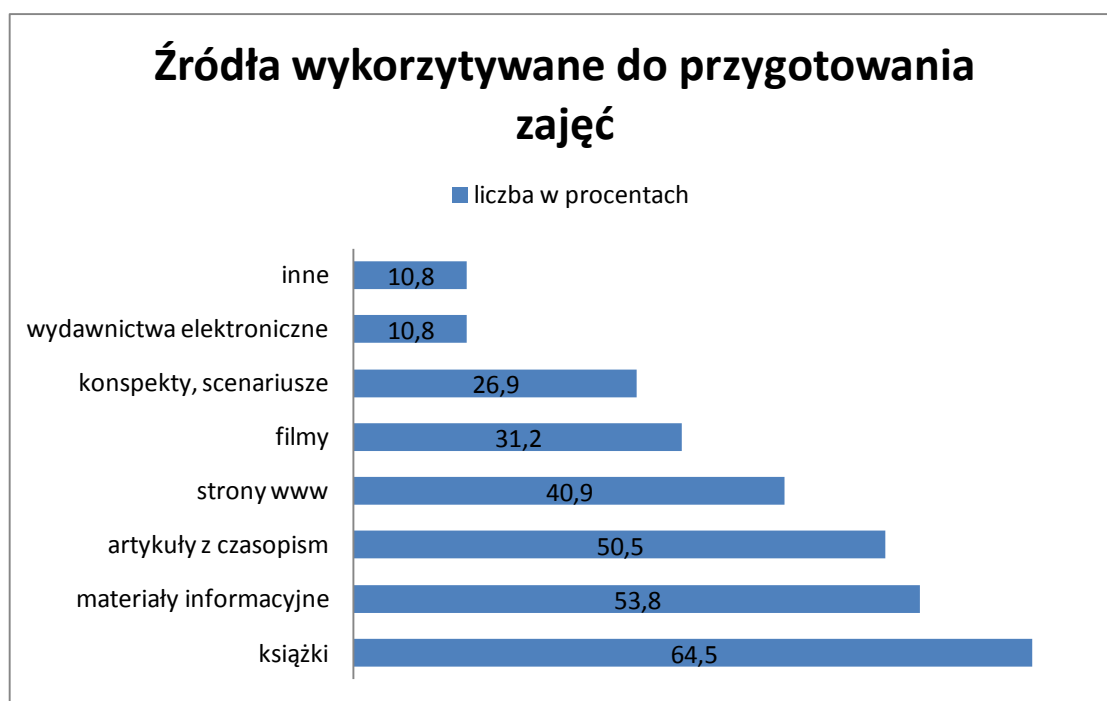
Wykres nr 3. Źródła wykorzystywane do przygotowania zajęć.

Pytanie 8 miało na celu wskazanie przez badanych źródeł wykorzystywanych w przygotowaniu zajęć. Analiza odpowiedzi nauczycieli wykazowała książki (60 respondentów, 64,5%), materiały informacyjne o Częstochowie i okolicach (50 respondentów, 53,8%), artykuły z czasopism (47 respondentów, 50,5%) - jako źródła przydatne do przygotowania zajęć z zakresu realizacji edukacji regionalnej. Badani ponadto wymienili: strony www o Częstochowie i okolicach (38 respondentów, 40,9%), filmy (29 respondentów, 31,2%), konspekty, scenariusze w czasopismach metodycznych i na portalach internetowych (25 respondentów, 26,9%), wydawnictwa elektroniczne (10 respondentów, 10,8%) oraz inne (10 respondentów, 10,8%), np. prywatne zbiory przedmiotów związanych z regionem, stroje ludowe, narzędzia rolnicze; albumy wykonane przez uczniów.