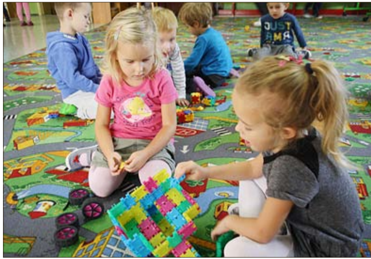
Die Kinder haben die Zweisprachigkeit ganz natürlich hingenommen

„Die Idee kam von unten. Es waren die Eltern, die sich organisiert und gesagt haben, wir wollen hier diesen Kindergarten. Eine maßgebliche Rolle hat auch die