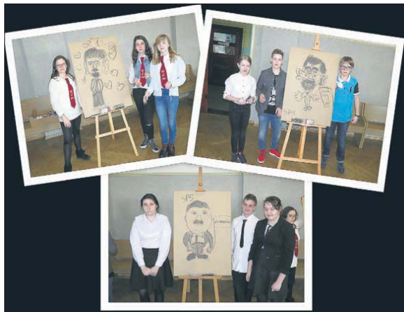
Zawodnicy na tle karykatur wielkich Polaków

Od czterech lat Gimnazjum nr 2 im. Noblistów Polskich organizuje międzyszkolny konkurs „W kręgu przyjaciół Noblistów”. Pomysł na tego rodzaju drużynowe współzawodnictwo łączące pracę twórczą z zabawą okazał się trafiony i każdego roku do udziału zgłasza się wielu chętnych, nie tylko z Mysłowic.