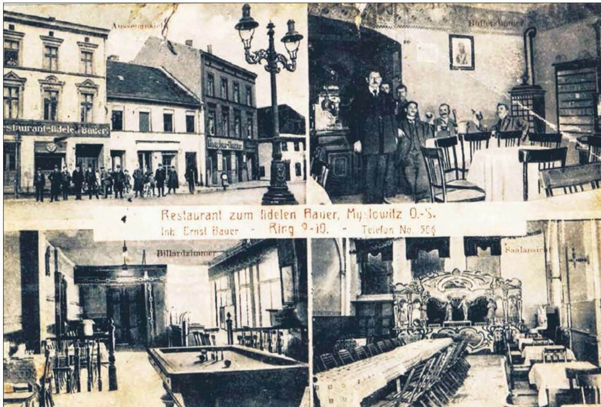
Na pocztówce z 1912 roku widać kamienicę o numerze 11, w której mieści się „Kinophon-Theater”