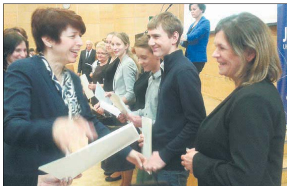
Laureaci z „Trójki” odebrali nagrody i zaświadczenia od Śląskiej Kurator Oświaty

13 kwietnia odbyła się uroczysta gala wręczenia zaświadczeń oraz nagród rzeczowych laureatom wojewódzkich konkursów przedmiotowych.