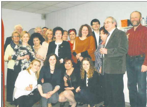
Uczestnicy spotkania jubileuszowego, 1 kwietnia 2016 r.