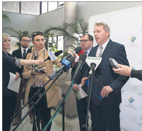
Podczas debaty „Smog w województwie śląskim – jak ochronić mieszkańców przed tym zjawiskiem?”