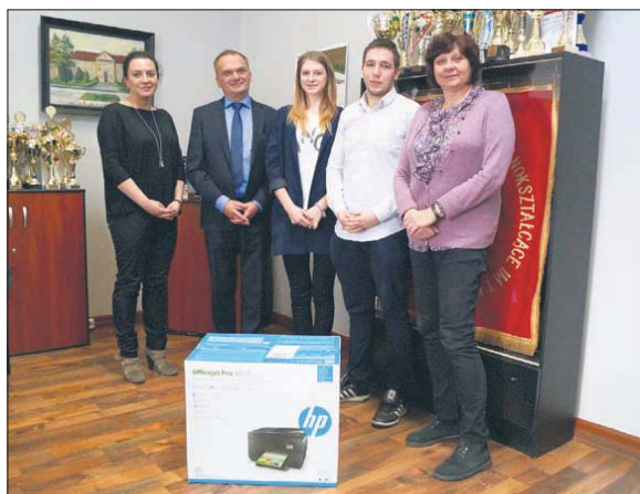
Na sprzęcie młodzież będzie mogła m.in. drukować dokumenty i zdjęcia