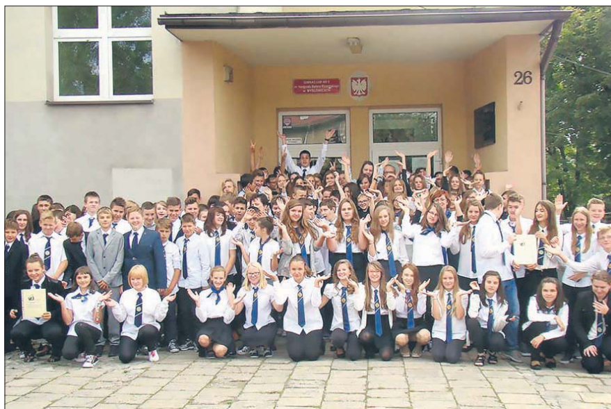
Dyrekcja i grono pedagogiczne Gimnazjum nr 5 im. Kardynała Stefana Wyszyńskiego serdecznie zaprasza uczniów klas szóstych i ich rodziców na dzień otwarty, który odbędzie się 21 kwietnia 2016 r. w godzinach 17.00 – 18.30.