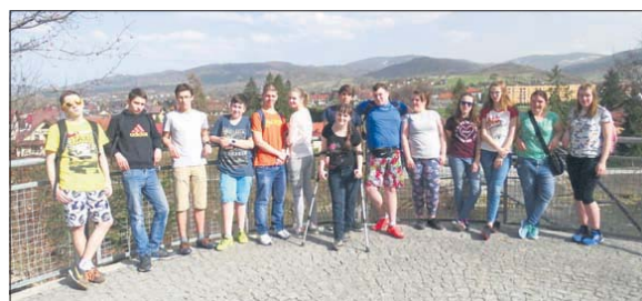
Młodzież powtarzała materiał, ale też relaksowała się przed egzaminem

W dniach od 4 do 8 kwietnia 2016 r. w Węgierskiej Górcie odbył się III Obóz Naukowy dla uczniów Gimnazjum nr 3 w Mysłowicach. Już od pierwszego dnia gimnazjaliści zaczęli rozwiązywać testy. Każdego dnia, przez wiele godzin, ciężko pracowali, aby powtórzyć jak najwięcej wiadomości z każdej dziedziny.