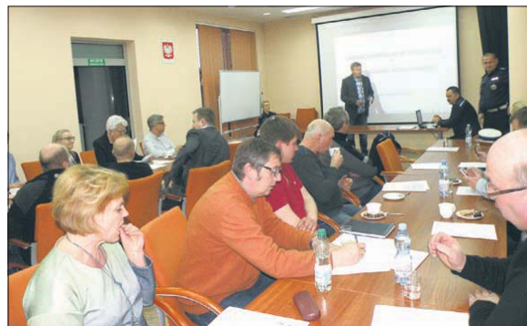
Debata z przedsiębiorcami

Omówiono m.in. zdarzenia niebezpieczne odnotowane w Imielinie na tle powiatu. Od zebranych funkcjonariusze oczekiwali oceny skuteczności działań policji, w dyskusji mieszkańcy zgłosili swoje uwagi pod adresem mun-