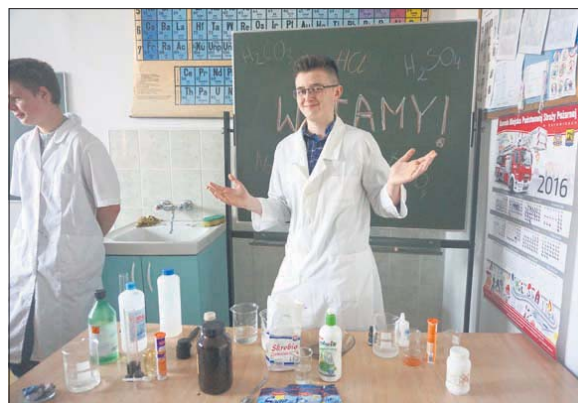
Uczniowie przekonywali młodszych kolegów, że warto wybrać ich szkołę