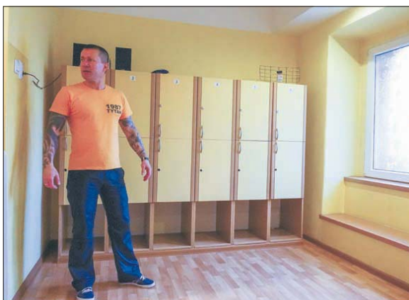
Odremontowana została już szatnia damska