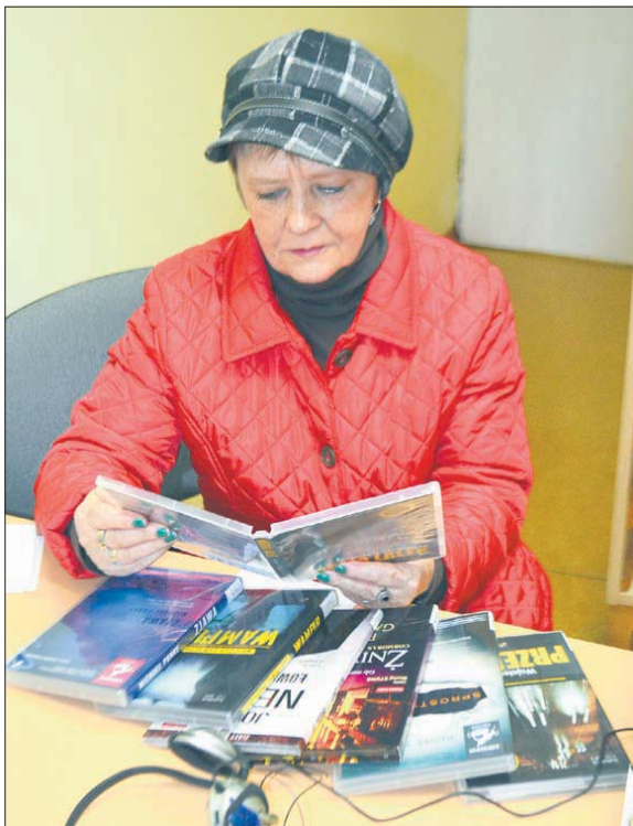
W zbiorach znajdują się audiobooki dla dzieci i dorosłych, zarówno bestsellery jak i klasyka literatury

Ważnym udogodnieniem dla czytelników jest format zapisu książek elektronicznych – DA-