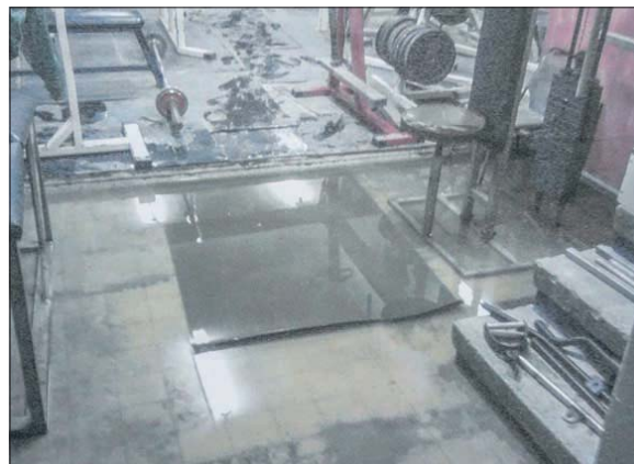
Tak wyglądała siłownia po zalaniu przez wodę