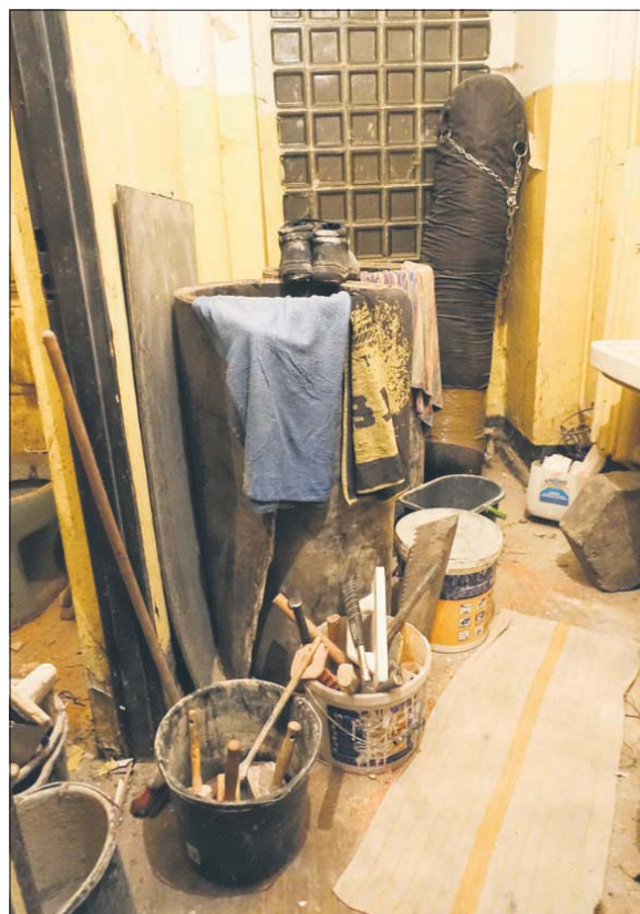
W tym pomieszczeniu Tytan planuje wykonać ubikację i prysznice