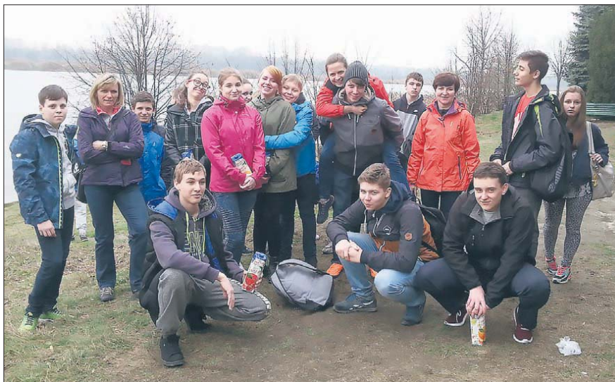
Gimnazjaliści wraz z Kołem nr 37 PZW uporządkowali zbiornik wodny i okoliczne alejki

Uczniowie klas drugich Gimnazjum Sportowego wzięli udział 11 kwietnia w akcji „Sprzątanie Hubertusa”.