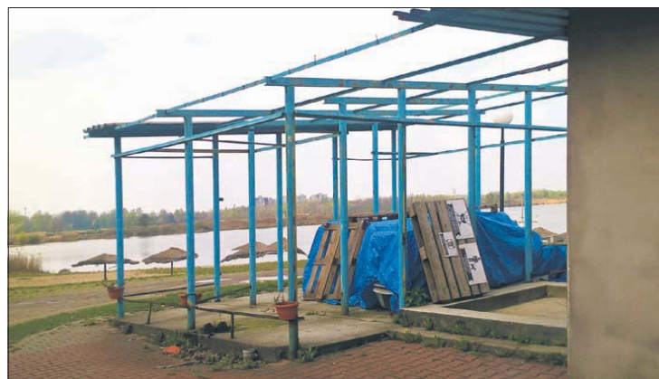
Zdewastowane przebieralnie podobno mają w tym sezonie zniknąć

Przyglądamy się temu z zadróżką, bo leżąc po naszej stronie część Hubertusa od lat nie jest wykorzystana tak jak by mogła być. W 2013 roku nad wodą powstał wyciąg do wakeboardu, czyli ślizgania się na tafli na desce. Przez jeden sezon była dyskoteka, a w zeszłym roku zmienił się właściciel wakeboardu. Pod koniec 2014 roku pojawiła się szansa, że na Hubertusie powstanie szkoła żeglarska dla dzieci i młodzieży, list intencyjny w tej sprawie podpisała fundacja żeglarska Silesian Sail, dyrektor MOSiR-u, który administruje tym terenem i prezydent Mysłowic. Minę