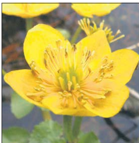
Kwiat knieci błotnej

Wiosną, wiele gatunków ma bardzo żółte kwiaty, ponieważ ten kolor przywabia wiele owadów. Oto chociażby bardzo wcześniej pojawiający się podbiał. Tu i ówdzie zakwita pięciornik piaskowy, cechujący się bardzo ni-