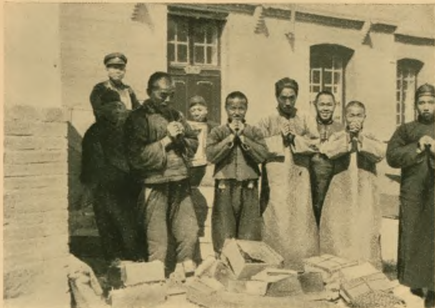
Chińczycy dziękują za dary nadesłane z Polski.