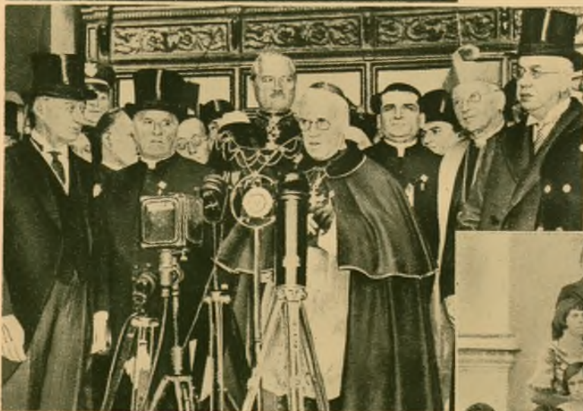
Kardynał Nowego Jorku Hayes (przed mikrofonem) jako legat papieski otwiera uroczyste 7-my Krajowy Kongres Eucharystyczny w Cleveland.