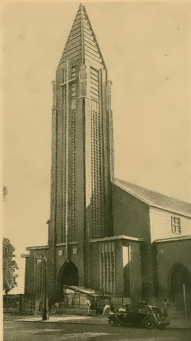
Po prawej: Kościół pod we- zwaniem św. An- toniego z Padwy, który wzniesio- no w Paryżu na miejscu dawnych fortyfikacji. Po- święcenia doko- nał kardynał Verdier. Kościół odznacza się piękną o nowo- czesnym stylu wieżą.