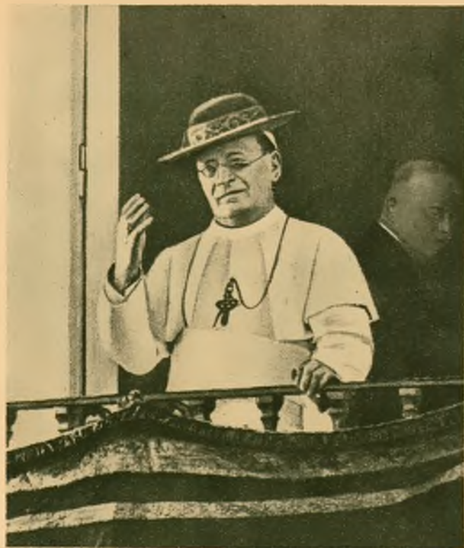
Po lewej: Ojciec św. opu- ścił swoją rezy- dencję letnią w Castel Gandolfo i na odjeźdźnym błogosławi lud- ność tego miasta.