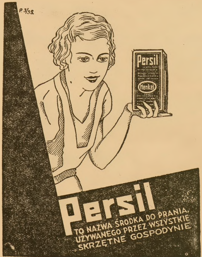
Do moczenia bielizny: H E N K O, soda do prania i bielienia.