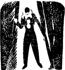
Z WIEDNIA PIĄTEK 21 LUTEGO 1936

„Nominacja rządu p. Kościłkowskiego w październiku 1935 r. powitana została przez opinię jako wyraz częściowego przyznania zwycięstwa tego kierunkowi, który głosił potrzebę porozumienia się ze społeczeństwem. Nikt nie spodziewał się, aby p. Kościłkowskiego mógł i chciał być razem przelotnym politycznym, ale wszyscy oczekiwali, że w ramach sanacyjnego systemu nastąpi pewna „zmiana kursu” w sensie złagodzenia stosunków między aparatem państwowym, a społeczeństwem”.