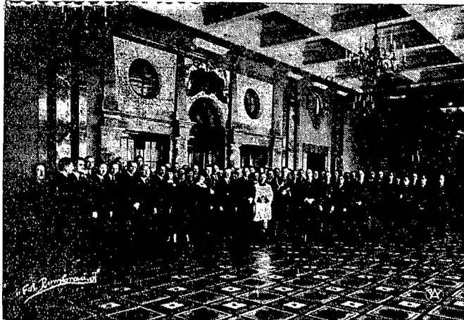
Klub społeczny pracującej inteligencji w Kielcach.

Ze ździe tutaj o mniej lub więcej silne mieszanie się do wewnętrznych spraw hiszpańskich, wynika z dalszego pilnego zalecenia komunistom hiszpańskim, by się nie zadowalali temi tylko krokami. Pożądana jest raczej dalsza walka na rzecz rewolucji i podniecanie działalności mas pracujących w mieście i na wsi.