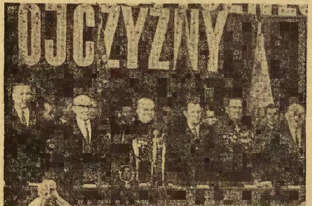
Prezydium centralnej akademii w Zabrzu