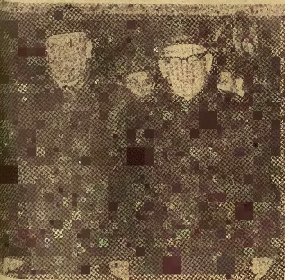
Powitanie i sekretarza KC PZPR tow. Władysława Gomułki na katowickim dworcu.

Przemówienie tow. WŁADYSŁAWA GOMUŁKI — publikujemy na stronie 3