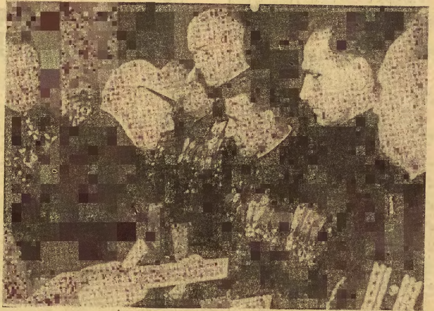
Tow. Władysław Gomułka dekoruje produjących górników odznaką „Zasłużony Górnik PRL”.