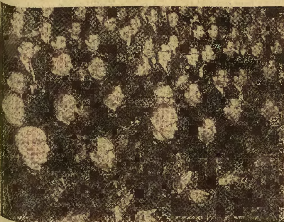
Salę zabrzańskiego Domu Muzyki i Tańca wypełniła brat górnictwa.

Przemówienie tow. WŁADYSŁAWA GOMUŁKI — publikujemy na stronie 3