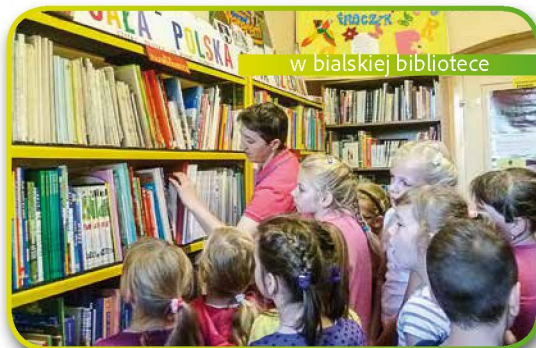
w białskiej bibliotece