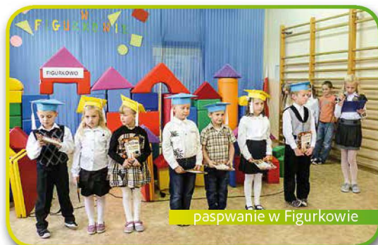
pasowanie w Figurkowie