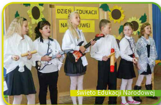
święto Edukacji Narodowej