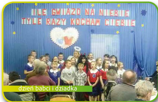
dzień babci i dziadka