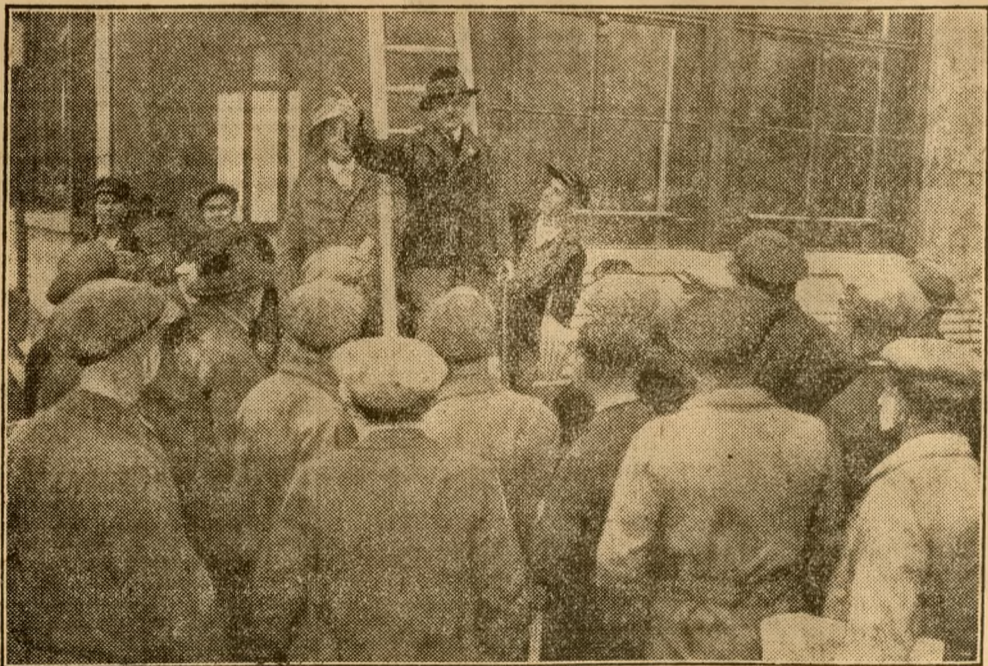
Streikverkündung auf einer Zeche.

70 000 Bergarbeiter im mitteldeutschen Braunkohlenrevier sind in den Streik getreten. Die schwierigste Frage ist, ob sich ihm auch die Grube Golpa anschließen wird, die augenblicklich noch arbeitet. Golpa beliefert nämlich das Großkraftwerk Bismarck mit Kohlen und Bismarck versorgt unter anderem die Reichshauptstadt mit Strom.