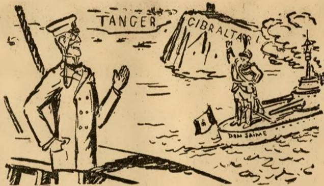
Nach der Zusammenkunft Chamberlains mit Primo de Rivera.

In Kreisen, die mit den Vorgängen im Memelgebiet gut vertraut sind, wird darauf verwiesen, daß trotz der Zusagen des litauischen Ministerpräsidenten, daß sich die Regierungsbildung im Memelgebiet auf parlamentarischer Grundlage vollziehen werde, die Litauer offenbar wieder eine Verschleppungspolitik betreiben. Obwohl der memelländische Landtag schon am 7. d. Mts. zu seiner ersten Sitzung zusammentrat und obwohl bereits vor dieser Sitzung das im