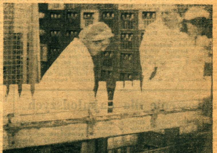
Podczas dziennej zmiany linia do butelkowania mleka wykorzystywana jest do przygotowywania do sprzedaży śmietany, kefiru i maślanki.