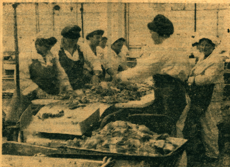
Zakłady Mięsne w Rybniku. W rozbieralni mięsa.

O rybnickich Zakładach Mięśnych i raciborskiej Spółdzielni Mleczarskiej — piszemy na str. 3.