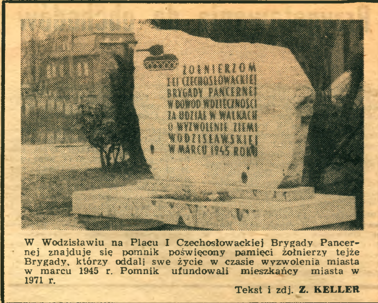
W Wodzisławiu na Placu I Czechosłowackiej Brygady Pancernej znajduje się pomnik poświęcony pamięci żołnierzy tejże Brygady, którzy oddali swe życie w czasie wyzwolenia miasta w marcu 1945 r. Pomnik ufundowali mieszkańcy miasta w 1971 r.