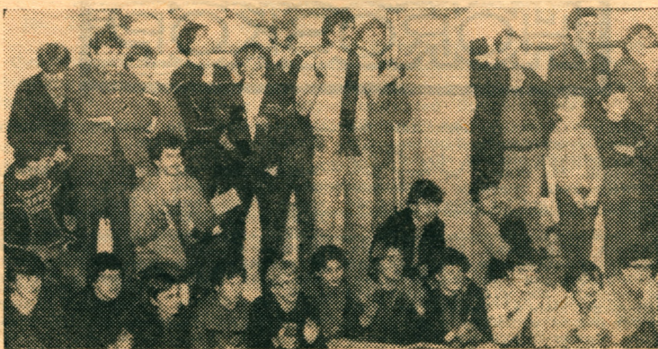
Mała sala Górniczego Ośrodka Wychowania Fizycznego i Sportu przy ul. Powstańców wypełniona do ostatniego miejsca. Widownia gorąco dopinguje ulubioną drużynę KS ROW .

— Drużyna jest młoda i rozwijająca. Wszystkie zawodniczki łączą ambicję i solidne podejście do treningów. W minionych rozgrywkach zespół okrzepł, ma dobrą