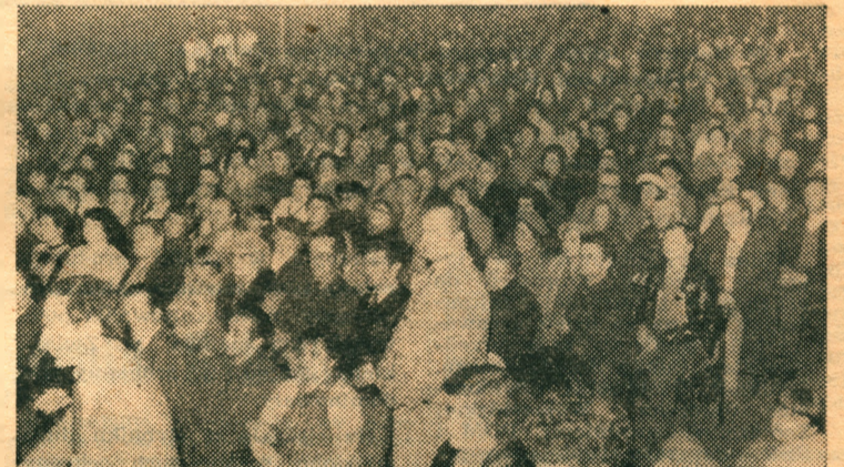
Na cztery spotkania ze znanym bioenergoterapeutą przybyło do Teatru Ziemi Rybnickiej ponad cztery tysiące osób.