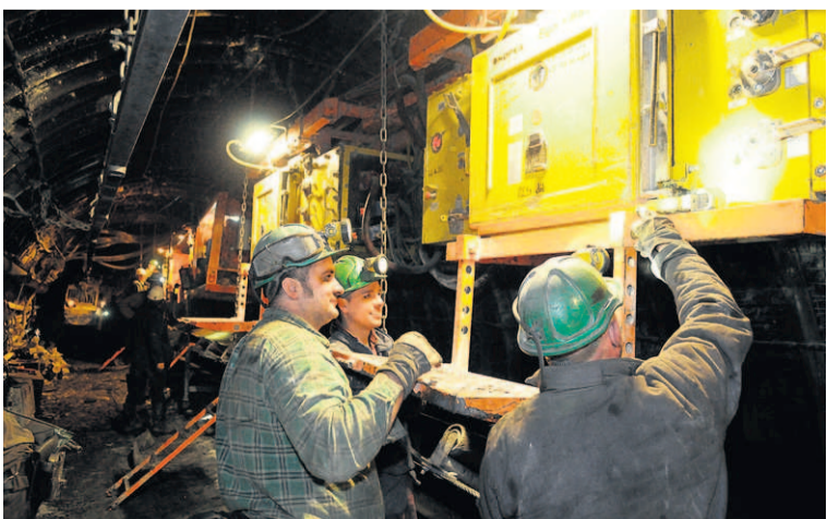
Ostatnie sprawdzanie urządzeń przed ostrym fedrowaniem na najwyższej ścianie kopalni Zofiówka.

Ściana G-4 została wyposażona w 103 sekcje liniowe oraz 10 sekcji skrajnych – każda po kilkadziesiąt ton.