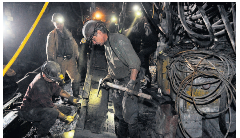
Wprawdzie kombajnem steruje się za pomocą pilota, ale nadal bez kilofa i masywnego klucza na dole ani rusz...