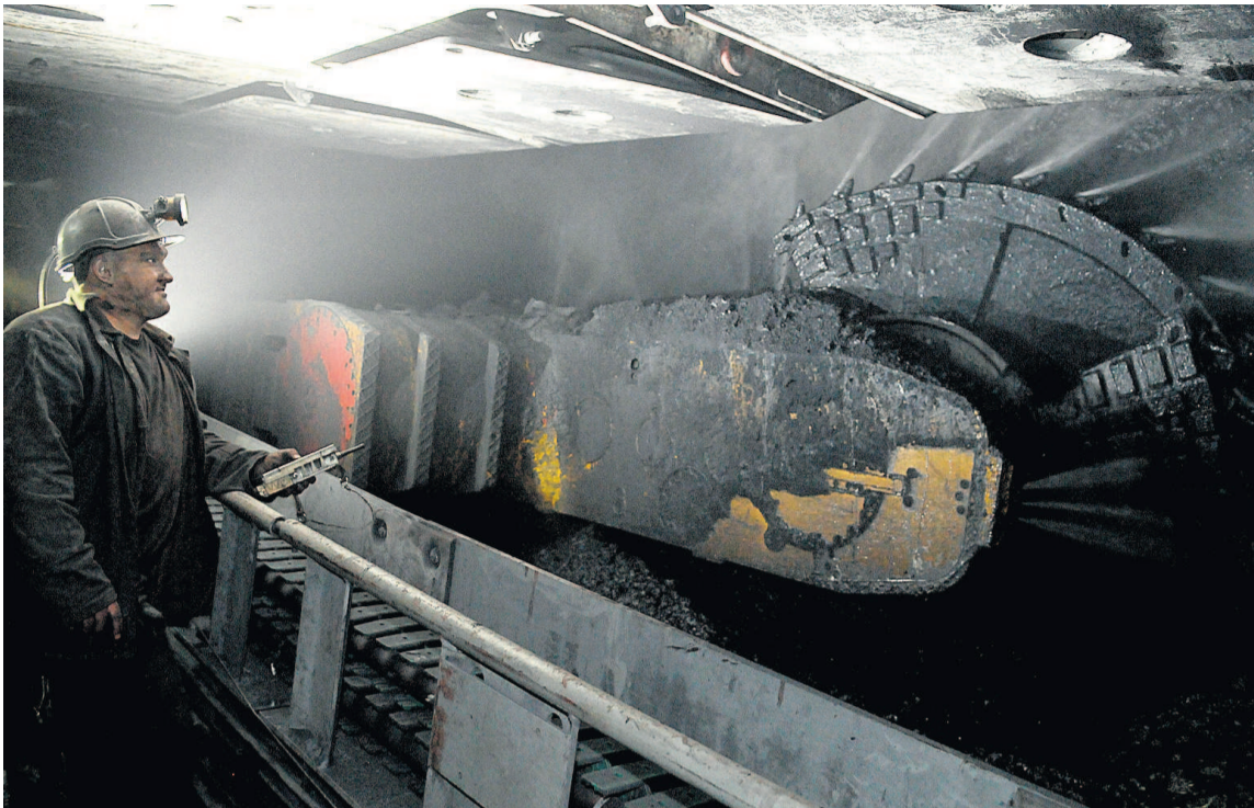
Jednym z największych kombajnów ścianowych w polskim górnictwie, ważącym 90 ton, steruje się niczym telewizorem, bo za pomocą pilota. Tyle tylko, że do jego obsługi trzeba mieć dużo większe kompetencje.

Z kolei pozostawienie niewybranego węgla w zrobach grozi jego zagrza-