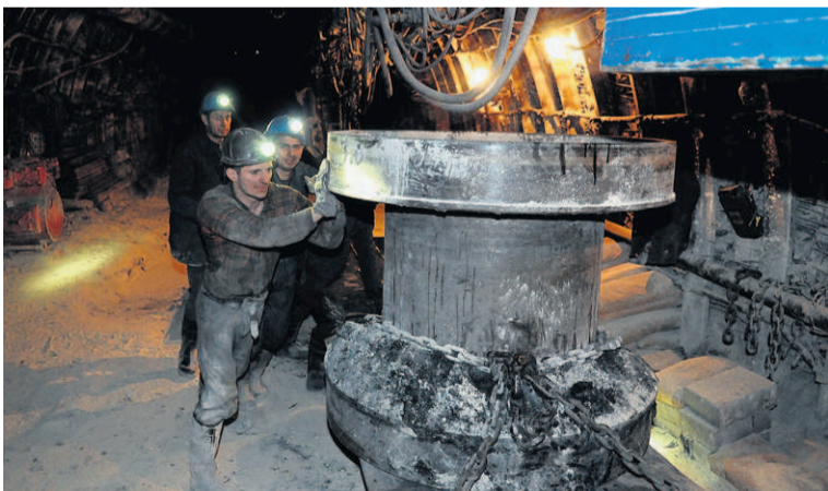
Bęben kołowrotu, którym ciągnięto najcięższe elementy wyposażenia ściany G-4, jest teraz wywożony z przodka.

Wcześniej załoga Zofiówki zdobywała jako pierwsza w polskim górnictwie doświadczenia w eksploatacji strugowej, po 11 latach zaniechania stosowania tej techniki w krajowych kopalniach.