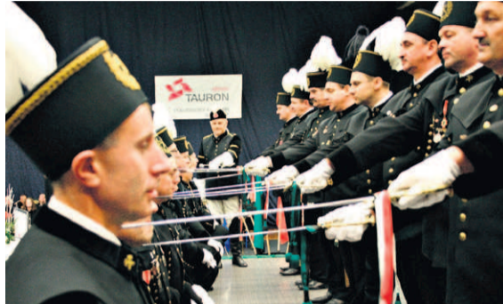
Wręczenie górniczych szpad nawiązuje do aktu pasowania na rycerza.

Wszyscy jego uczestnicy – w tej sprawie nie wyobraża sobie jakiegokolwiek odstępstwa – są obowiązkowo ubrani w galowe mundury górnicze, czarna i białe rękawiczki. Po stylizowanym przemówieniu prowadzącego Lis Major wprowadza wezwanych gwardii – kandydatów na Stare Strzechy. Następnie Stare Strzechy –