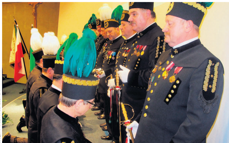
Akademię barbórkową uświetniła ceremonia nadania szpad górniczych.