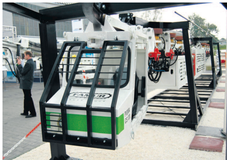
Kolejki podwieszane to polska specjalność. Znalazły zastosowanie w wielu kopalniach na całym świecie.