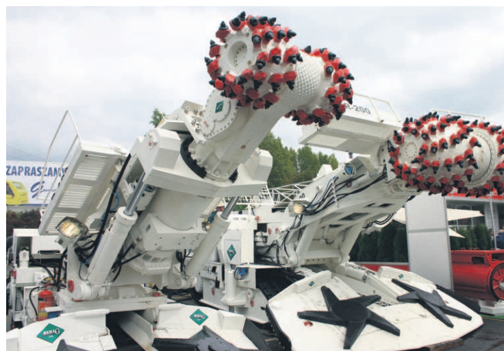
Kombajny zaprezentowane przez REMAG cieszyły się sporym zainteresowaniem wśród gości z Ameryki Południowej.