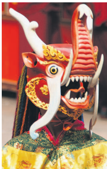
Fantastyczne maski przedstawiają gniewne bóstwa.