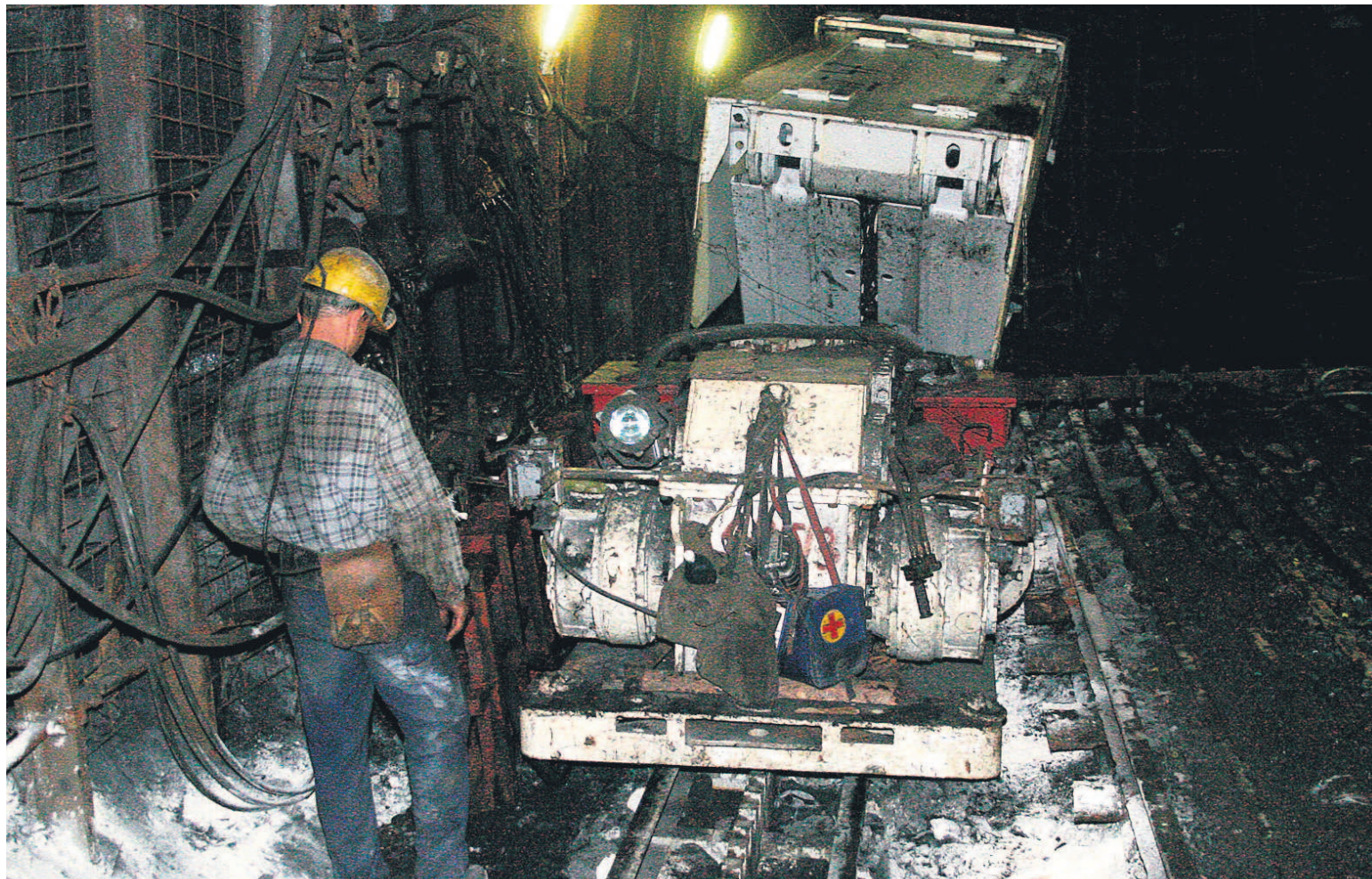
Państwowa Inspekcja Pracy przez dwa lata kontrolowała kopalnie w aspekcie przestrzegania norm czasu pracy na stanowiskach górniczych.

PRAWO Państwowa Inspekcja Pracy będzie zabiegać o zmiany ustawowe, mające na celu ukrócenie pracy górników na tych samych stanowiskach bez wypoczynku przewidzianego przepisami.