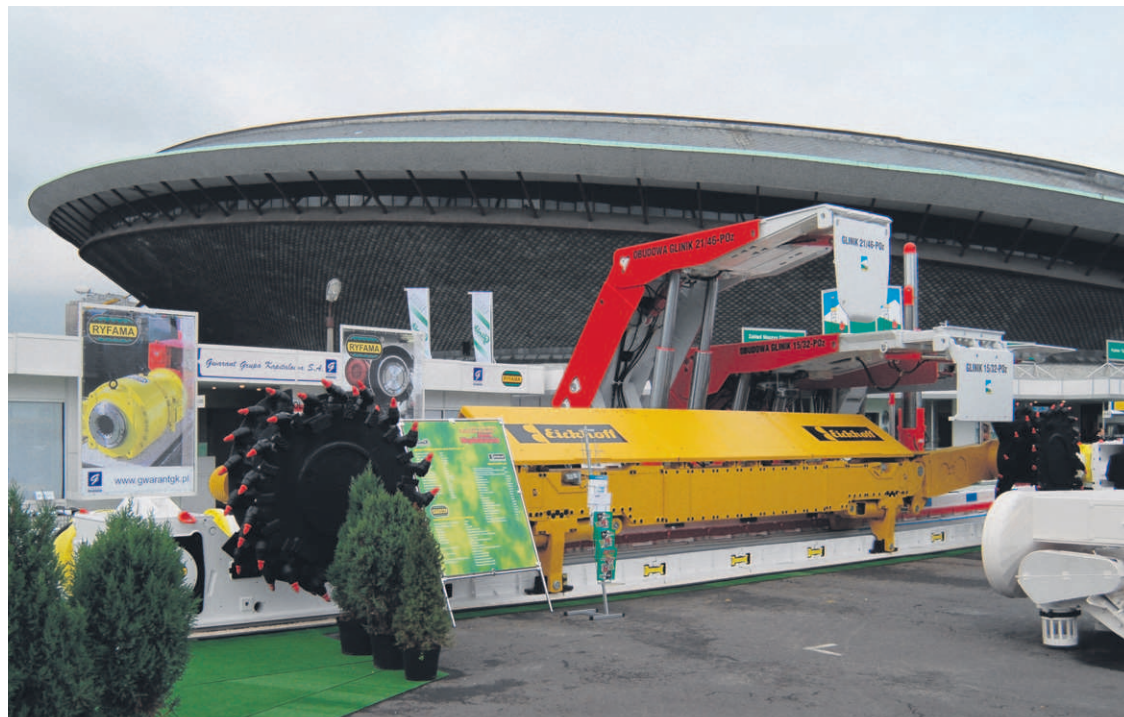
Międzynarodowe Targi Górnictwa, Przemysłu Energetycznego i Hutniczego to jedna z największych tego typu imprez na świecie. W tym roku mają być wyjątkowe pod każdym względem – zapewniają organizatorzy.

Najbliżej do Katowic mają oczywiście Czesi. Dwa lata temu nasi południowi sąsiedzi prezentowali swą ofertę na placu za Spodkiem. Co ciekawe, drugiego i trzeciego dnia targów ich stanowiska szturmowali... rodacy, przedstawiciele kadry kierowniczej ostraw-