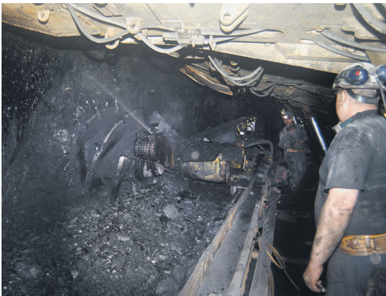
Praca ponadwymiarowa nie może być zlecana w celu wykonywania normalnych, planowanych zadań – akcentują inspektorzy Państwowej Inspekcji Pracy.

– Praca ponadwymiarowa nie może być zlecana w celu wykonywania normalnych, planowanych zadań. I nie możemy przyszykować na to oczu pod ciężarem argumentu, że weekendowe zatrudnienie jest dobrowolne. Wieloletnia praktyka spowodowała, że górnicy oczekują, że praca w dni wolne będzie dla nich dodatkowym źródłem dochodu w postaci wynagrodzenia wraz ze 100-procento-