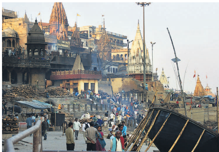
Varanasi. Spotkanie życia i śmierci.