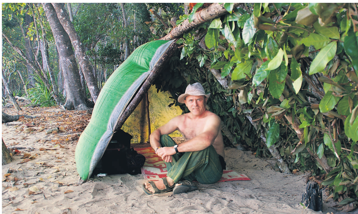
Tędy przetoczyło się tsunami.

– Statek lada chwila ma odpłynąć, a tu gigantyczna kolejka i nie ma biletów. Co robić? Patrząc, pośród nieprawdopodobnej ilości walizek i tobołów stoi Hinduska. Nie przorszy chwytam dwie walizy i gnam po trapie. Bileter pomyślał pewnie, że jestem tragarzem i machnął ręką.