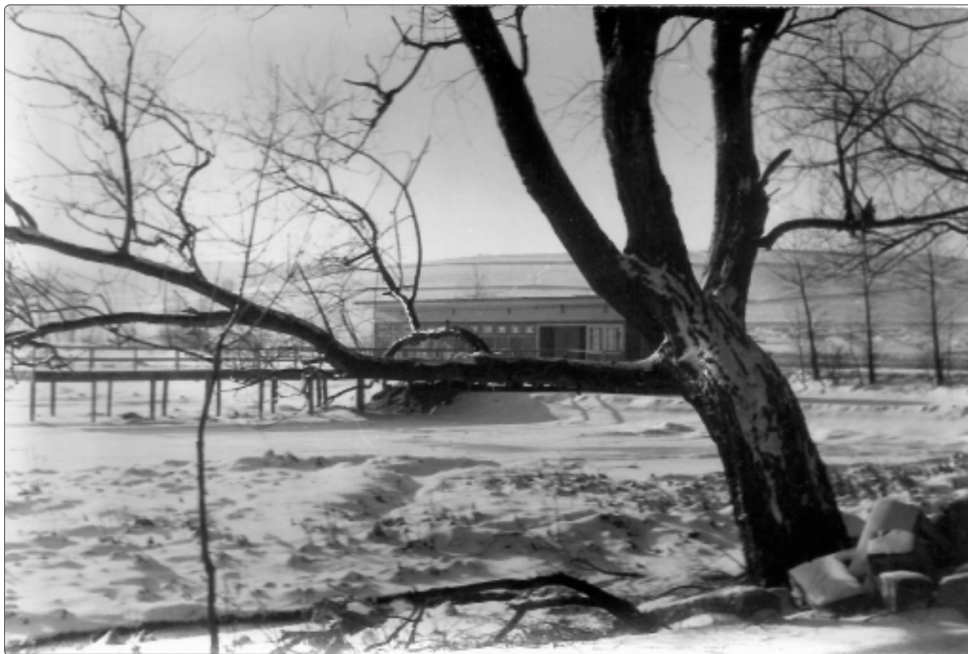
Lata 70-te XX w. Prawdziwa zima nad stawem.