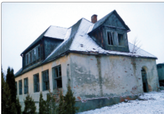
Budynek dawnej szkoły