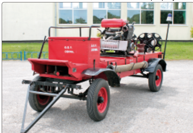
Konny wóz rekwizytowy OSP Cisowa