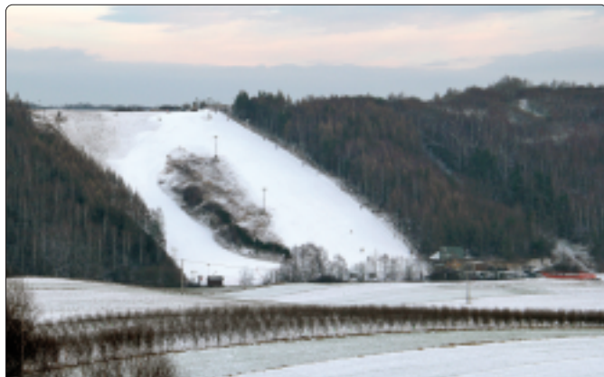
Stacja narciarska Cisowa