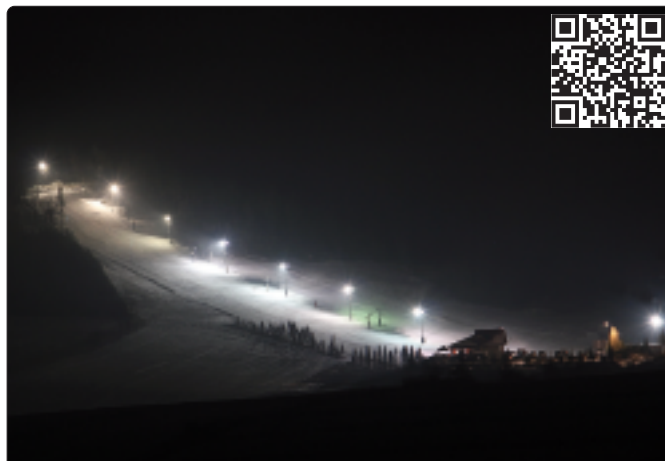
Zimowe atrakcje gminy - stok narciarski w Smoleniu