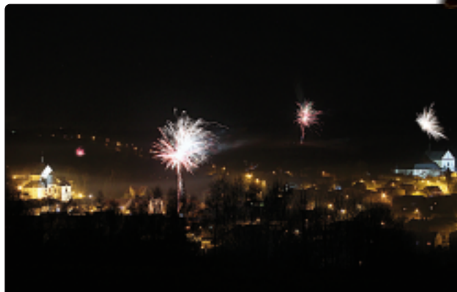
Sylwester 2015/2016 w Pilicy widziany ze wzgórza św. Piotra