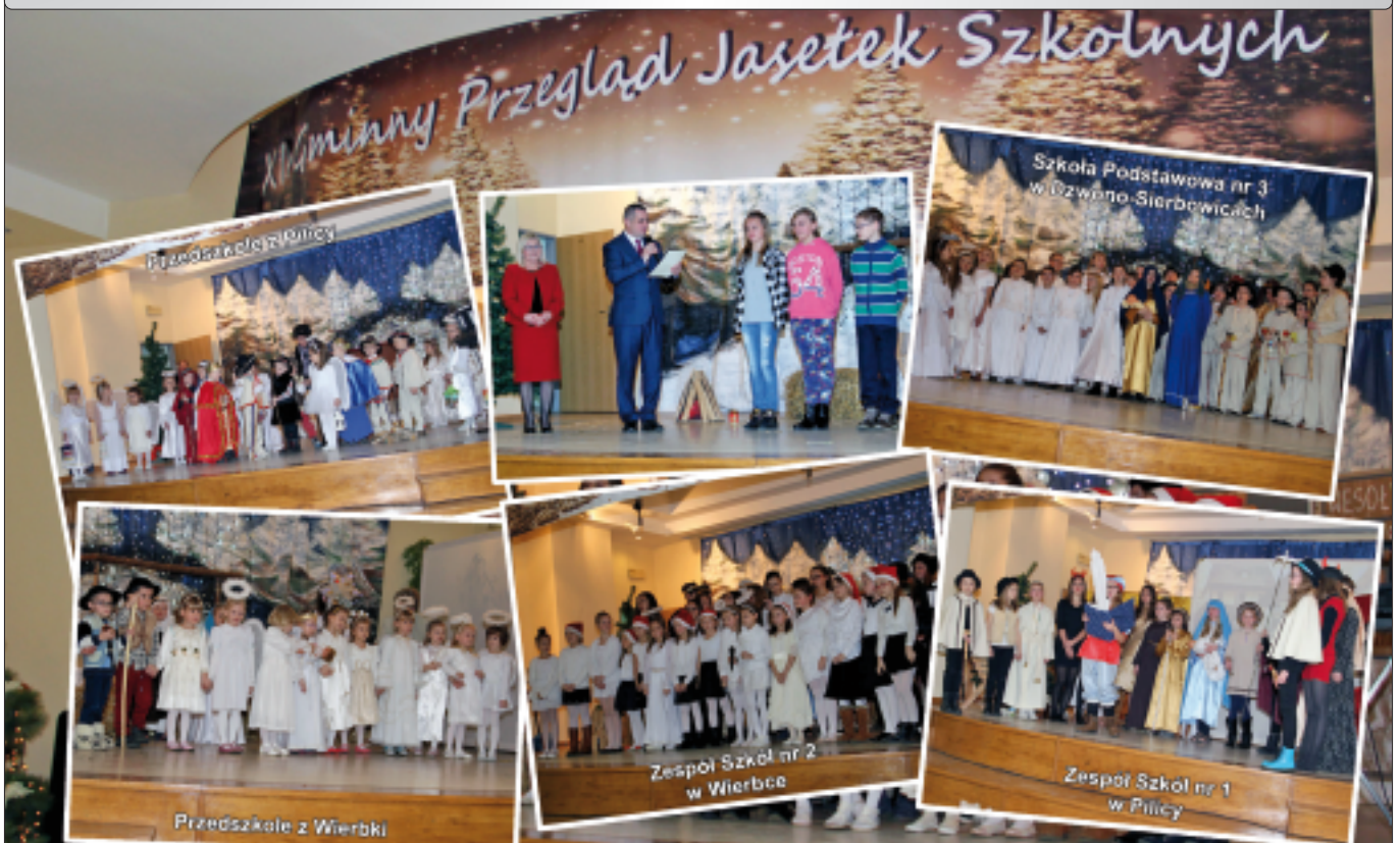
Reprezentanci przedszkoli oraz szkół biorących udział w XIV Gminnym Przeglądzie Jasełek