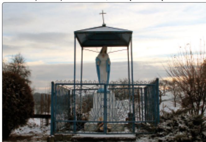
Kapliczka z figurą Matki Boskiej