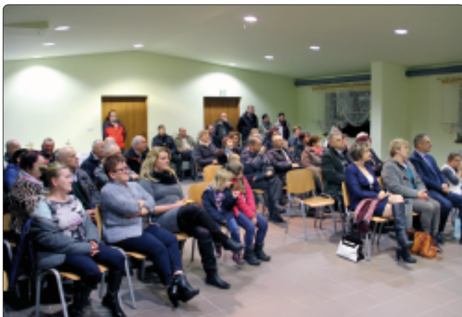
Prezentacja sukcesu Kocikowej zgromadziła sporą publiczność

konkursu i opowiedziały o przebiegu rywalizacji. Jak przystało na okres mikołajkowo-świąteczny były okolicznościowe upominki, a muzyczną oprawę w pastorałkowych klimatach zapewnił zespół Los Veteranos. [ANK]