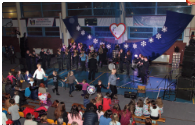
Młodzieżowa Orkiestra Dęta z Dzwono-Sierbowic tradycyjnie poderwała dzieciaki do zabawy

10 stycznia 2016. Za nami XXIV Finał Wielkiej Orkiestry Świątecznej Pomocy. Już wstępne wyniki w skali gminy i w skali kraju pozwalają przypuszczać, że końcowy wynik może być rekordowy. Według wstępnych wyliczeń pilicka Orkiestra zebrała ponad 17 tysięcy zł. Nie o rekordy jednak w tej szlachetnej akcji chodzi. Ważne jest to, że idea dobroczynności zakorzeniła się mocno w społeczeństwie. Pilicki finał został tradycyjnie przygotowany przez społeczność Zespołu Szkół nr 1 w Pilicy wspartą przez grupę lokalnych sponsorów. Pomimo nieco skromniejszej niż zwykle oprawy impreza była udana. W wielu miejscowościach naszej gminy działali wolontariusze zbierający datki. Były oczywiście licytacje przedmiotów przekazanych przez sponsorów.