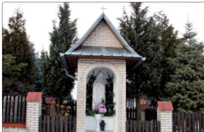
Kapliczka z figurą Matki Boskiej