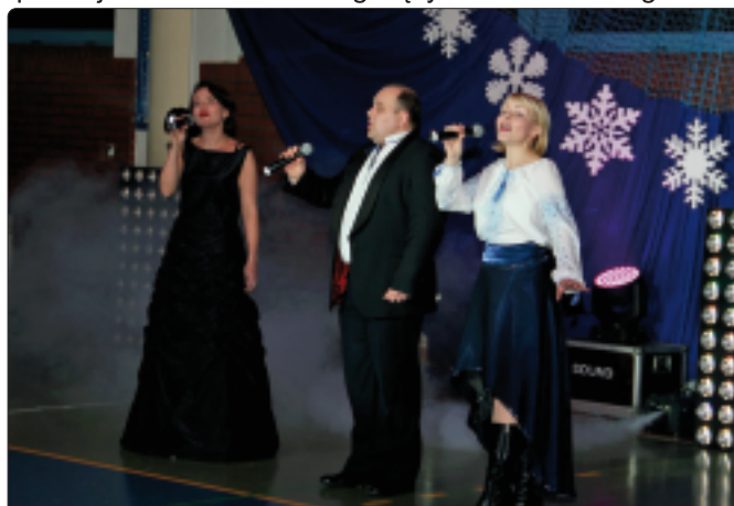
Zespół Pieśni i Tańca "Zbrucz"

Tradycyjną część artystyczną w wykonaniu miejscowych amatorskich wykonawców, reprezentujących różne pokolenia i różne nurty muzyczne, uzupełniły występy, które śmiało można uznać za profesjonalne. Widzowie gorącymi brawami nagrodzili