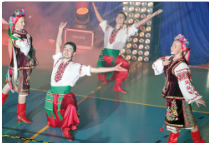
Zespół "Kalina Czerwona"

grę Młodzieżowej Orkiestry Dętej z Dzwono-Sierbowic, która w swoim rewelacyjnym występie pokazała, że orkiestra strażacka to nie tylko utwory marszowe. Ukraińskie zespoły „Kalina Czerwona” i „Zbrucz” zaprezentowały widzom niezwykle kolorowe widowisko, na które złożyły się dynamicznie wykonane tańce ludowe i przepiękne utwory zaśpiewane przez solistów. Podsumowaniem wieczoru było wspólne wykonanie przez artystów i widownię utworu znanego i chętnie śpiewanego w obu krajach - „Hej sokoły”. Imprezę zakończyło tradycyjne „Świąteczko do nieba”. [SZK]