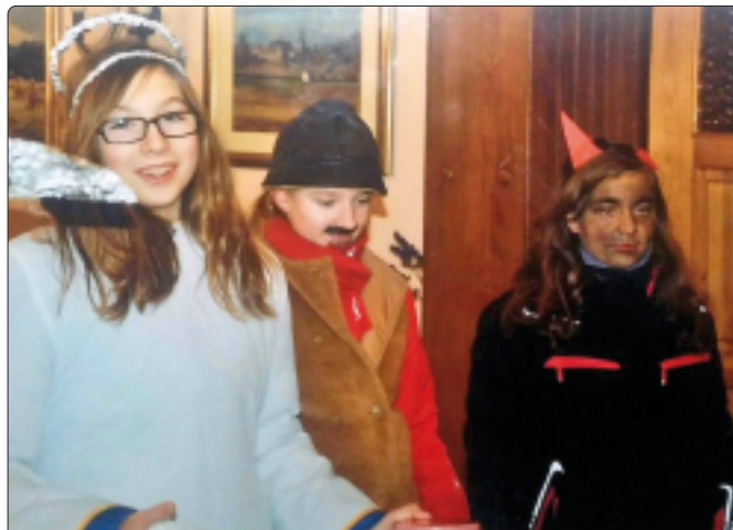
Kołędnicy... czyżby wymierająca tradycja?

stroje, po to aby kultywować piękną tradycję. Kołędnikiem może być każdy z nas. Nie trzeba do tego żadnych kwalifikacji, ani niezwykłych zdolności aktorskich. Potrzeba tylko pewności siebie. Zapobiegajmy więc umieraniu tego obrzędu. Zaczniemy chętnie chodzić po kołędzie, lub po prostu doceniemy tę garstkę przebierańców i zapraszamy do swych domów. Niech nie gasną światła na dźwięk dzwonka do drzwi w świąteczny wieczór. Kołęda przecież nie musi kosztować, wystarczy nawet „Bóg zapłać”, ale ratujmy ten niezwykły obyczaj. [Magda Pleban]