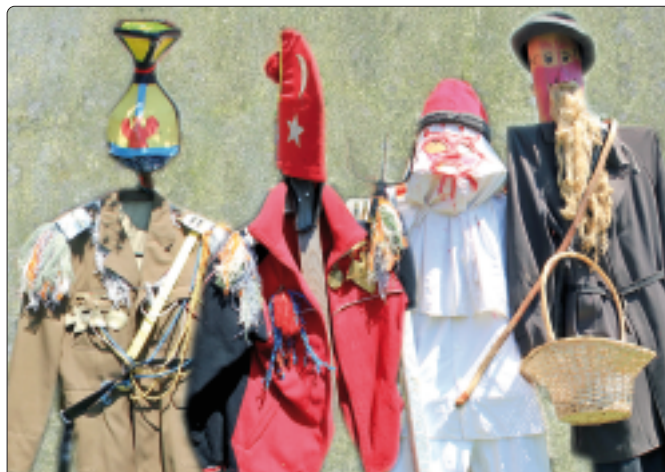
Barwne stroje kolędników z Kleszczowej

opłatkiem z rodziną i przyjaciółmi. Artystyczna forma kolędy jest wartością wyróżniającą mieszkańców regionu, a nie tylko dzieciinną maskaradą. Dobrze mieć też świadomość, że skład grupy nie jest przypadkowy, a wynika z tradycyjnego, ludowego postrzegania kosmologii świata. Czas świąt Bożego Narodzenia jest okresem kończenia tego co stare, zapraszaniem tego co nowe, w literaturze nazywany czasem liminalnym, w którym wedle wierzeń pojawiają się postacie Obce, spoza znanego świata. Jaki jest skład grupy kolędniczej w regionie Pilicy? Król Herod, Anioł, Diabeł, Marszałek, Turek, Śmierć, Żyd. Anioł – dobra dusza, pyta gospodarza czy mogą wejść; Marszałek Królowi przynosi krzesło – tron; Żyd stawia się na wezwanie Heroda, śpiewać jednak nie chce, jest Szabas; Turek wraca z wojny, a wojska za nim pięć tysięcy; przebiegły Diabeł - ogon ma napchany szpilkami gdyby go tylko jakaś panna chciała za niego złapać, aż w końcu przychodzi Śmierć, tej się oprzeć Król nie może. Bogata inscenizacja, kreatywna charakteryzacja i popisy kawalerów to pretekst do wymiany darów. Od dawna zwykło się dawać kolędnikom pieniądze, kiedyś wystarczył kęs świątecznego ciasta w zamian za dobre słowo życzeń. Stare serbskie powiedzenie głosi, że świat nie zginie, póki ludzie będą dzielić się chlebem. A jak wyglądają ostatnie lata?