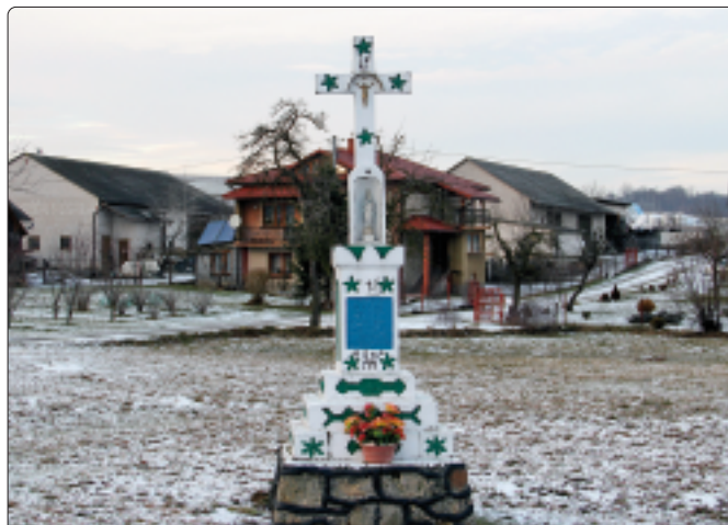
Kapliczka pomiędzy remizą OSP a kaplicą

pięciu górali. Po raz pierwszy Cisową wymieniają dopiero w dokumenty pilickiej parafii z 1786 r. kiedy to odnotowano wieś Ciszowa, leżącą w ówczesnym województwie krakowskim. W opisie topograficznym z 10 października 1790 r. wymieniono Cisową-Pustkowie. W 1791 r. odnotowano Podcisową, w której, według rejestru parafialnego, znajdowało się 5 jednoizbowych domów zamieszkałych przez 35 mieszkańców. Po III Rozbiorze Polski Cisowa, położona po południowej stronie rzeki Pilica, stanowiącej granicę między zaborem pruskim i austriackim, znalazła się w należącej do Austrii