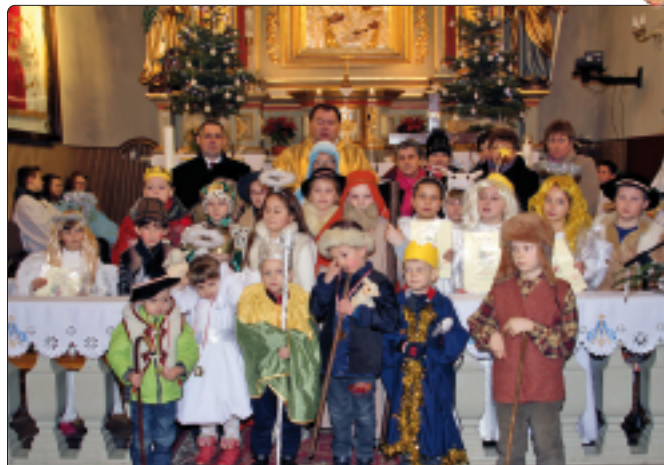
Barwny orszak Trzech Króli w Kidowie