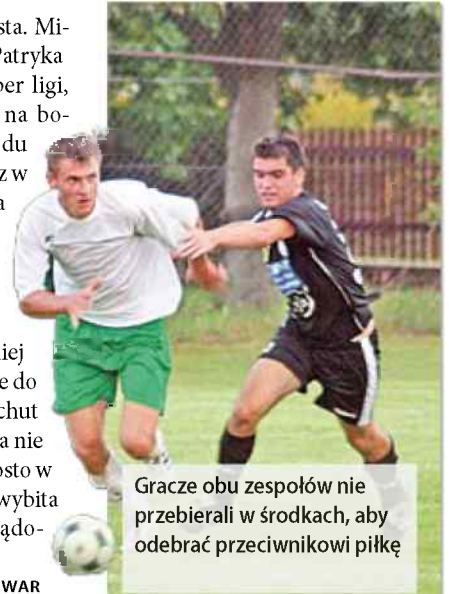
Gracze obu zespołów nie przebiegali w środkach, aby odebrać przeciwnikowi piłkę