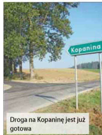
Droga na Kopaninę jest już gotowa

Teraz gmina ma w planach kolejne remonty. Aktualnie przy-