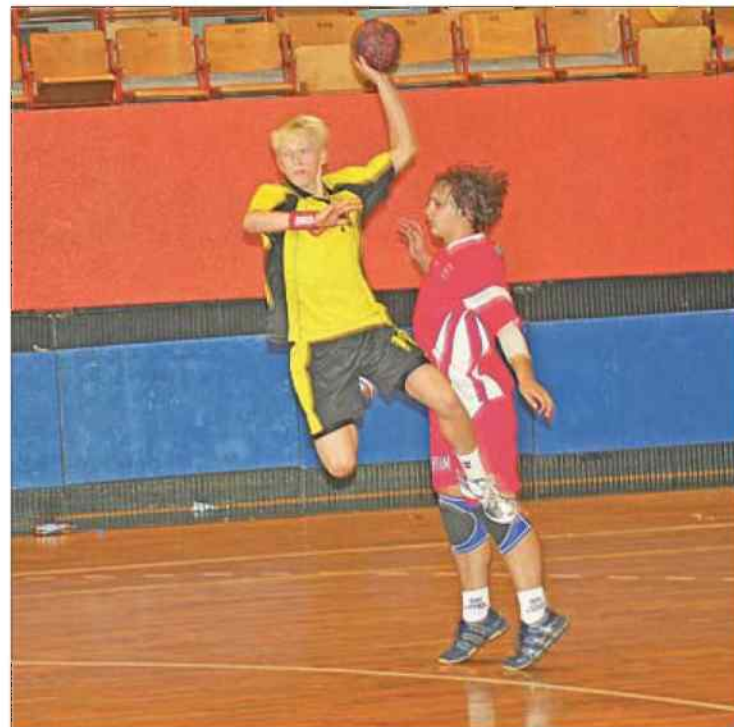
Tak rzucali gole zawodnicy podczas ubiegłorocznego turnieju

rozgrywany był bowiem w Zawadzkim. Tytułu mistrzowskiego broni KSSPR Końskie. W obecnej edycji zawodów prócz pucharów i dyplomów dla najlepszych będą przyznawane również nagrody indywidualne dla najlepszego