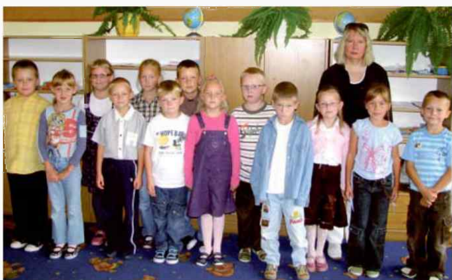
Publiczna Szkoła Podstawowa w Zalesiu Śląskim