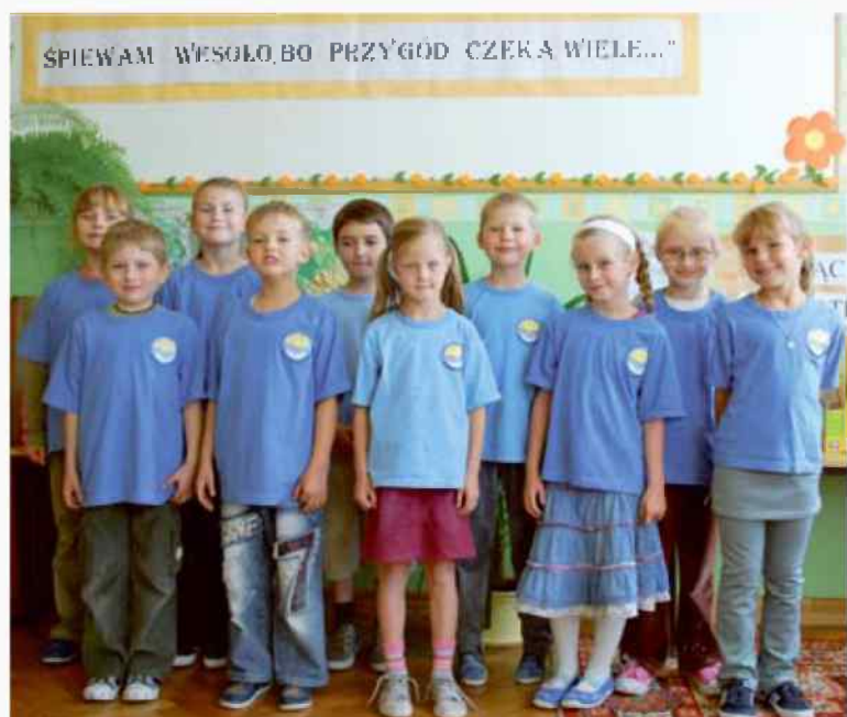
PS nr 2 Starniszcz Wielkie - Kolonowskie 3