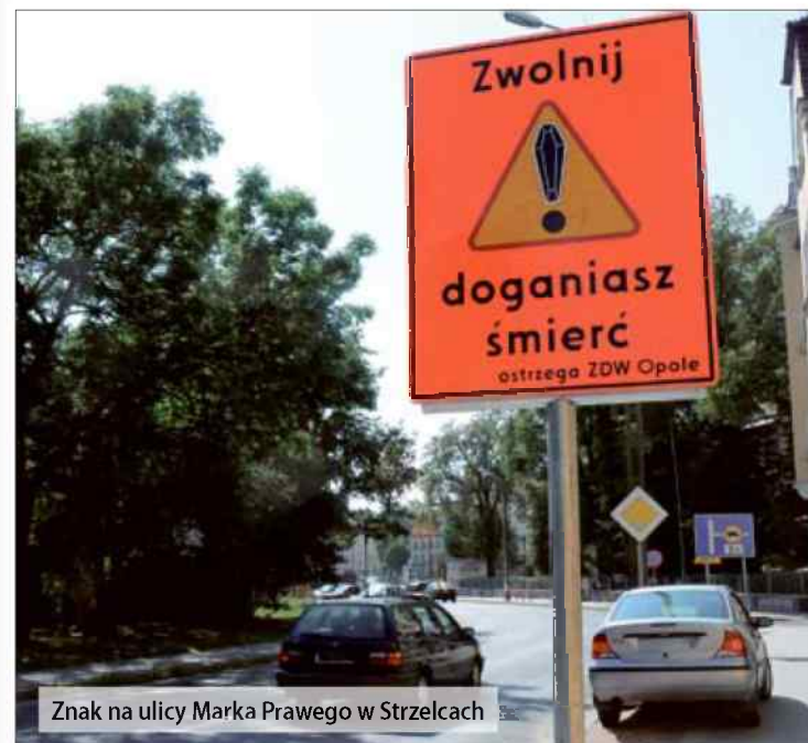
Znak na ulicy Marka Prawego w Strzelcach

- Ta trumna jako wykrzyknik wygląda koszmarnie, ale właśnie dlatego zwraca uwagę – mówi. – Od