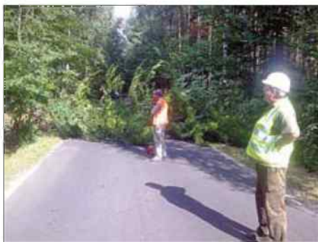
Pracownicy nadleśnictwa Strzelec Opolskie podczas usuwania ściętego drzewa z drogi