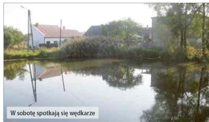
W sobotę spotkają się wędkarze

- Teraz jest wysoki poziom wody. Na zimę opadnie. Aby ryby się nie podusiły - wyłowimy je. Planujemy zrobić