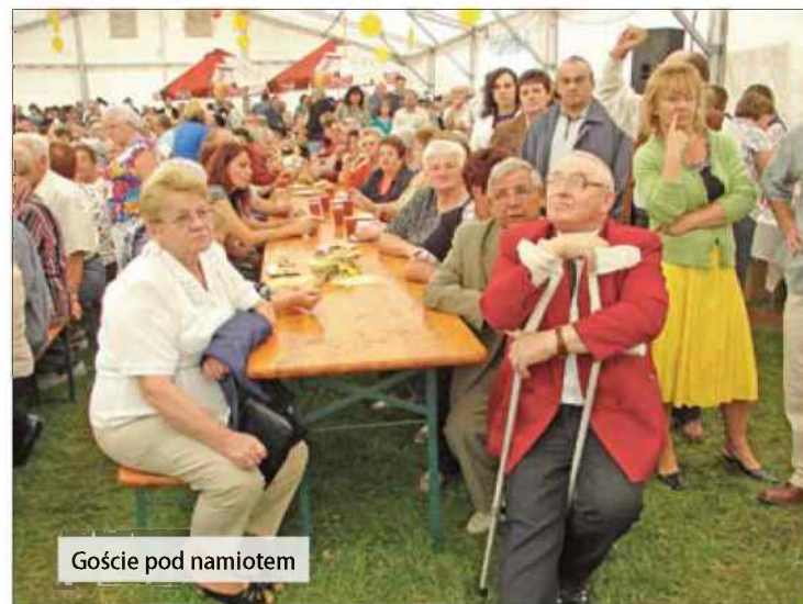
Goście pod namiotem

Niedzielne popołudnie upływało pod znakiem muzyki i dobrego humoru. Gwiazdą wieczoru byli m.in. soliści zespołu Śląsk – grupa Karlik. Imprezę uświetniły też lokalne zespoły – m.in. Jemielnicka Orkiestra Dęta i Centavia. Świętowanie zakończyła zabawa taneczna.