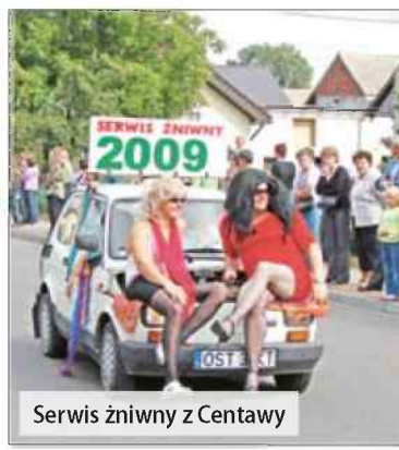
Serwis zniwny z Centawy

- Cieszylibyśmy się, gdyby odwiedziło nas 500-600 ludzi – mówił z uśmiechem burmistrz.