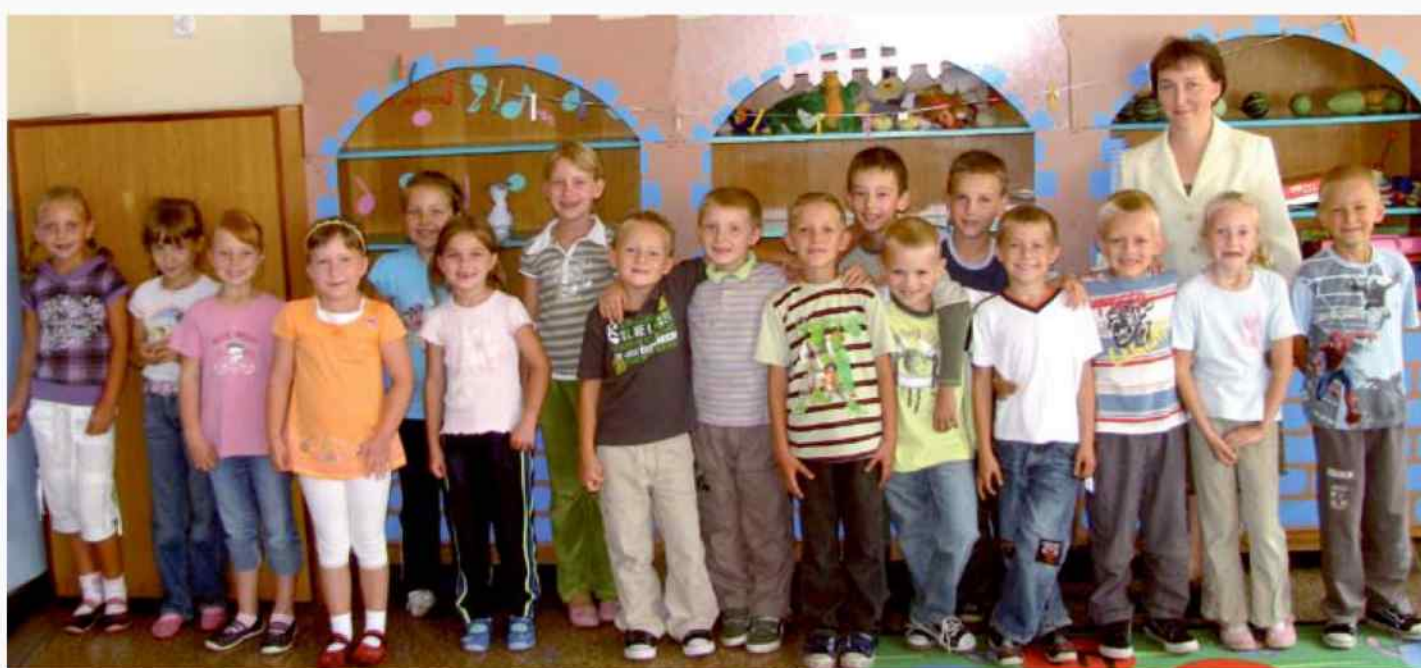
Publiczna Szkoła Podstawowa w Raszowej

Życzymy Wam wszystkiego najlepszego, samych szóstek i dobrych wspomnień ze szkolnej ławy.