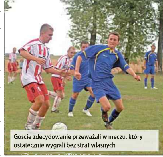
Goście zdecydowanie przeważali w meczu, który ostatecznie wygrali bez strat własnych