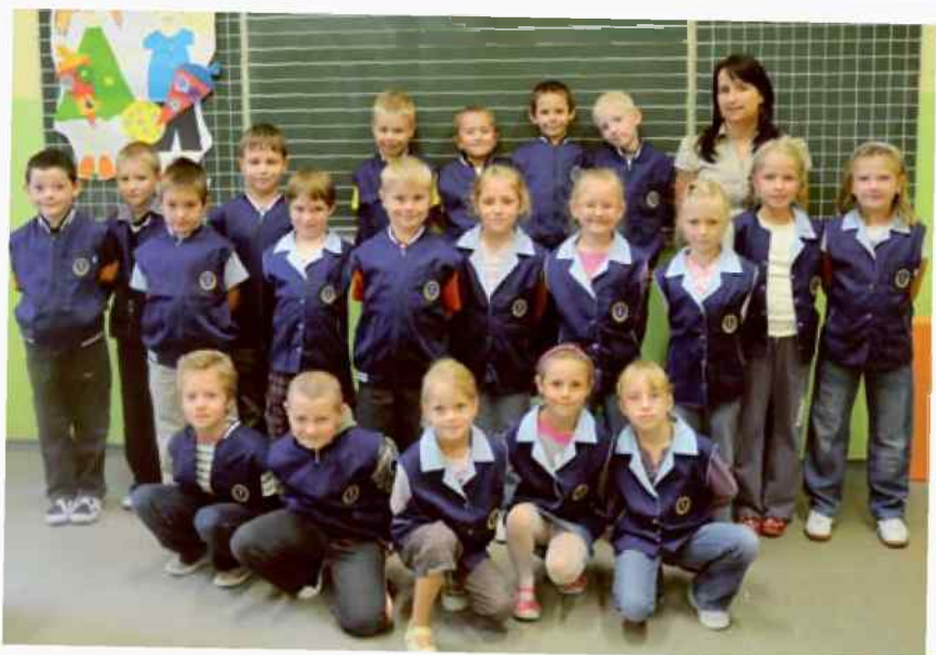
Publiczna Szkoła Podstawowa numer 1 w Strzelcach Opolskich