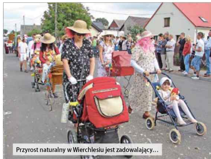
Przyrost naturalny w Wierchlesiu jest zadowalający...