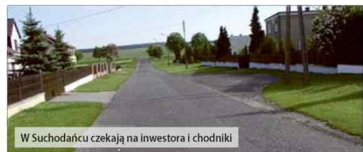
W Suchodańcu czekają na inwestora i chodniki

Uwzględnili bowiem wniosek inwestora, który chciałby na Kolonii Lwowskiej wybudować osiedle domków jednorodzinnych, zamierza również rozwijać inne kierunki działalności.