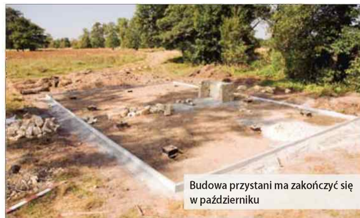
Budowa przystani ma zakończyć się w październiku

N ie tak dawno opisywaliśmy dawne miejsce zabaw we wsi, które przez lata zarosło chaszczami. Dziś ta informacja jest nieaktualna. Na brzegu Małej Panwi ruszyła z kopyta budowa przystani kajakowej. Wyspano tłużeń i gotowe są już fundamenty pod platformę, która wyłożona będzie deskami. Wymurowano też palenisko grilla.