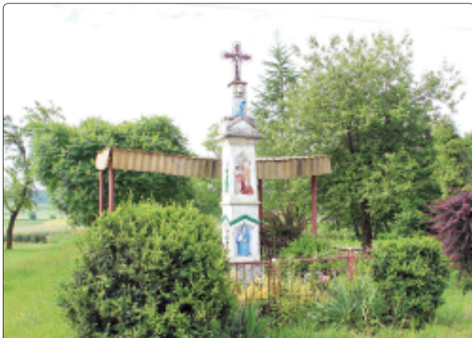
Kamienna kapliczka z 1898 r.