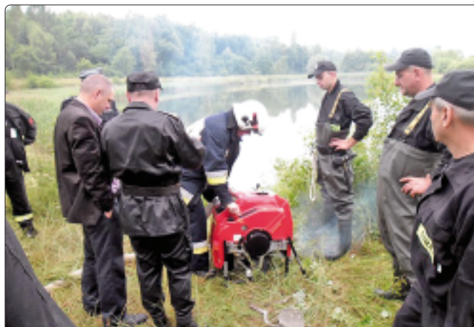
Motopompa na stanowisku wodnym