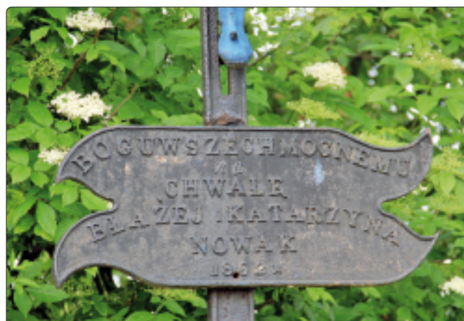
Krzyż przydrożny z 1862 r.