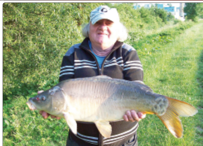
Karp o długości 72 cm ...

Wędkarstwo rekreacyjne jest jedną z bardzo niewielu czynności, które są prowadzone w ten sposób, jak setki lat temu, kiedy człowiek żył w harmonii z naturą. Fizyczny i psychiczny wypoczynek, jaki miliony ludzi znajdują w wędkarstwie, jest wartością samą w sobie. Korzystny efekt prawdziwego wypoczynku na łonie natury trudno przecenić. Ponadto wędkarze przyczyniają się do zachowania w naturalnym stanie środowiska wodnego, poprzez zaangażowanie się w sprawy ochrony i rewitalizacji naszych wód, co też czynią członkowie naszego SSWiW. Zbiorniki wodne w Pilicy, wg opinii fachowców, należą do jednych z najlepszych łowisk w Polsce, nie tylko z powodu czystej źródlanej wody, ale również przez prowadzenie racjonalnej gospodarki zarybieniowej, zwracając uwagę na zachowanie równowagi w ekosystemie naszych stawów. Podstawową rybą naszych zbiorników jest karp, ale możemy się pochwalić i innymi gatunkami takimi jak: