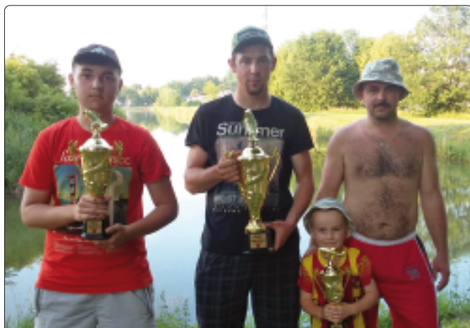
Zwycięzcy zawodów wędkarskich

Wędkarstwo rekreacyjne jest jedną z bardzo niewielu czynności, które są prowadzone w ten sposób, jak setki lat temu, kiedy człowiek żył w harmonii z naturą. Fizyczny i psychiczny wypoczynek, jaki miliony ludzi znajdują w wędkarstwie, jest wartością samą w sobie. Korzystny efekt prawdziwego wypoczynku na łonie natury trudno przecenić. Ponadto wędkarze przyczyniają się do zachowania w naturalnym stanie środowiska wodnego, poprzez zaangażowanie się w sprawy ochrony i rewitalizacji naszych wód, co też czynią członkowie naszego SSWiW. Zbiorniki wodne w Pilicy, wg opinii fachowców, należą do jednych z najlepszych łowisk w Polsce, nie tylko z powodu czystej źródlanej wody, ale również przez prowadzenie racjonalnej gospodarki zarybieniowej, zwracając uwagę na zachowanie równowagi w ekosystemie naszych stawów. Podstawową rybą naszych zbiorników jest karp, ale możemy się pochwalić i innymi gatunkami takimi jak: