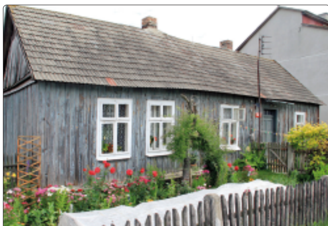
Budynek mieszkalny zabytkowej zagrody okołowej