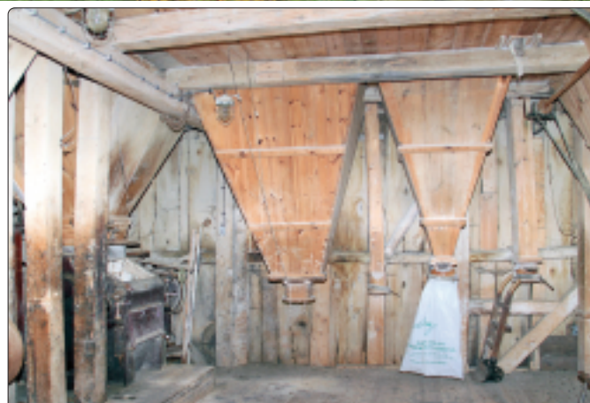
Wnętrze młyna Makiety