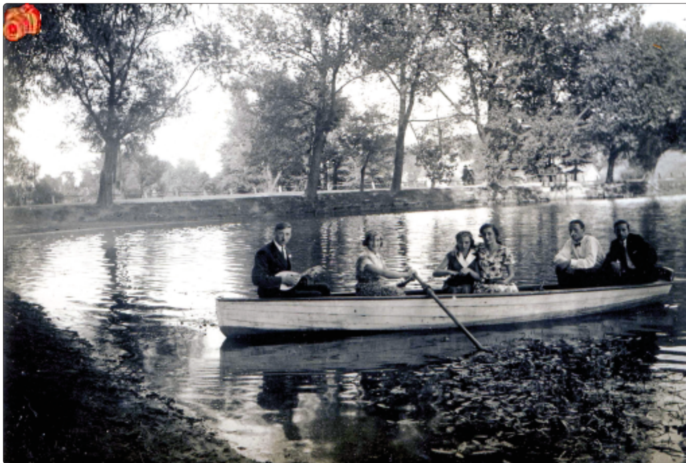
Trudno dzisiaj o łódki i cień na pilickim stawie.