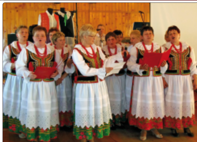
KGW Kleszczowa w pieśni o swojej miejscowości