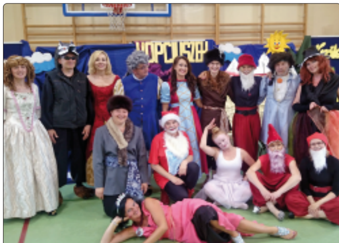
Nauczyciele ZS nr. 1 w nowym wcieleniu