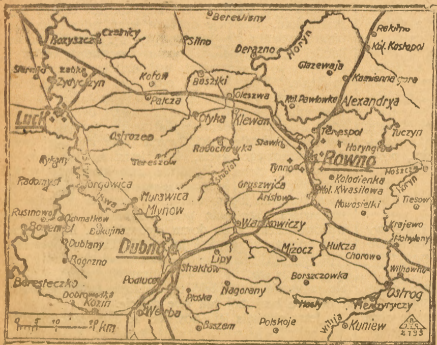
Wojna na wschodzie.

Nowe rozporządzenie co do garderoby ma służyć ilemożności nie tylko interesom nieuniknionego oszczędnego użytku zapasów oraz konsumpcji, lecz także interesom handlu. Urząd garderobiany Rzeszy nie zamierza centralizować po za niezbędne granice ani stwarzać monopolu, lecz chce pozostawić otwartą drogę zwykłą towaru pomiędzy producentem a konsumentem i sam używać tej drogi. Urząd będzie się wprawdzie musiał podjąć uregulowania cen ku ochronie konsumentów, lecz tak handel hurtowny jak i detaliczny będzie miał w ten sposób upewniony wystarczający zarobek.