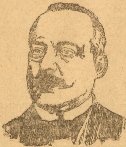
Antoni Salandra, dotychczasowy prezes włoskich ministrów.