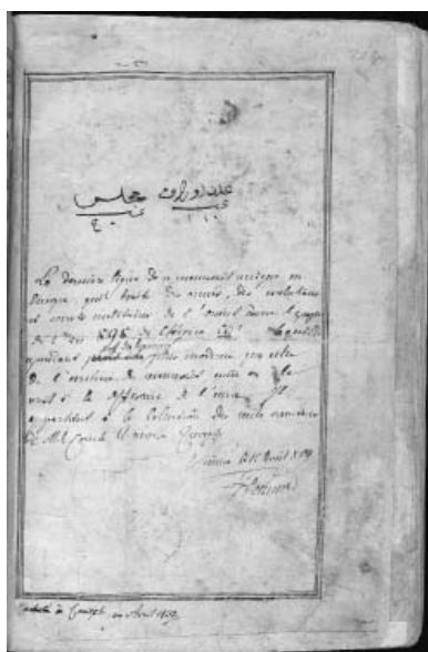
Ил. 3. «Китаб ал-махзан ва джама ал-фунун». Запись Хаммера. Институт восточных рукописей, С-Петербург, С-686, л. 108v.