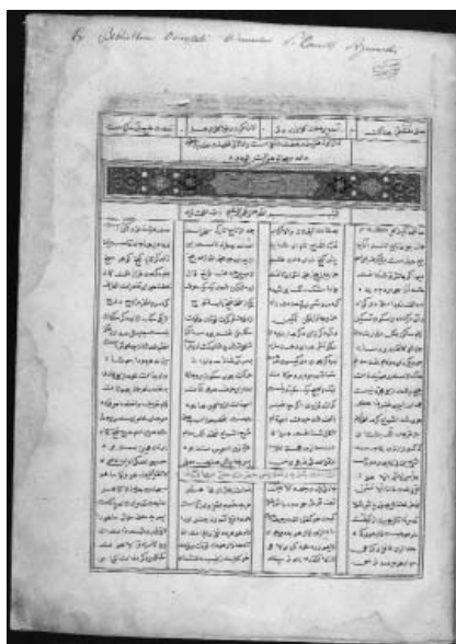
Ил. 4. Абд ар-Рахман Джами. «Кулийат» (Собрание сочинений). На персидском языке. 15 в. Экслибрис Ржевуского. Институт восточных рукописей, С-Петербург, D-204, л. 3г.