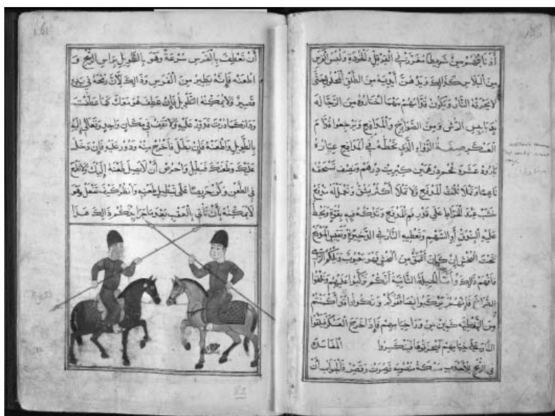
Ил. 2. «Китаб ал-махзан ва джама ал-фунун». Институт восточных рукописей, С-Петербург, С-686, л. 81v–82r.