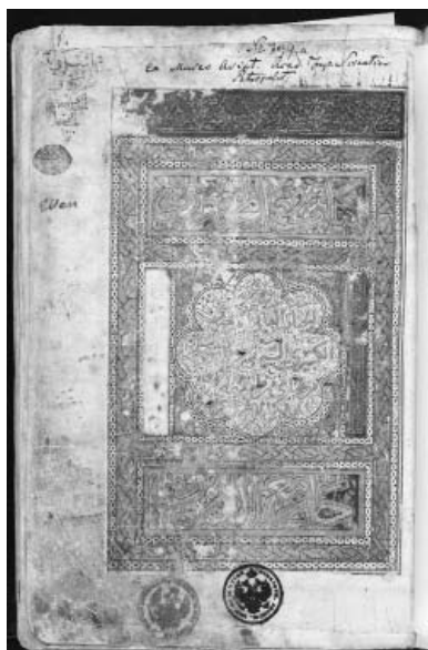
Ил. 1. «Китаб ал-махзан ва джама ал-фунун». На арабском языке. 1474 г. Фронтиспис. Институт восточных рукописей, С-Петербург, С-686, л. 1 г.