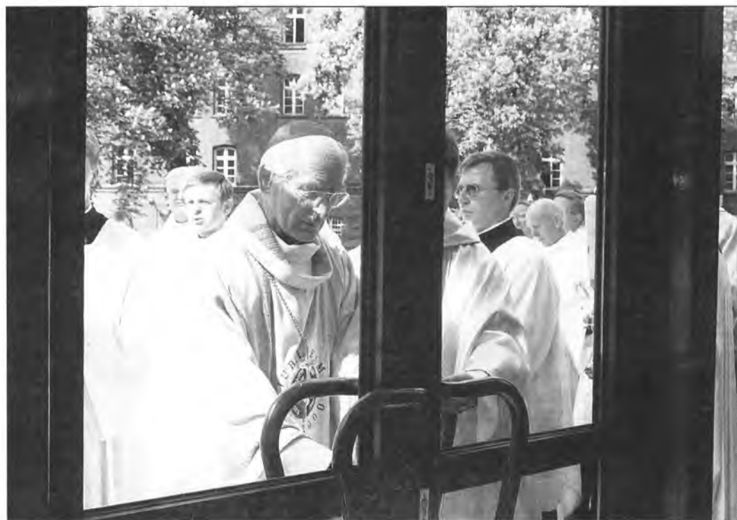
Konsekracja kościoła seminaryjno-akademickiego przy Wydziale Teologicznym UO. 8 maja 2000 r.

Pomyślność Uniwersytetu Opolskiego niech będzie dla nas najwyższym nakazem.