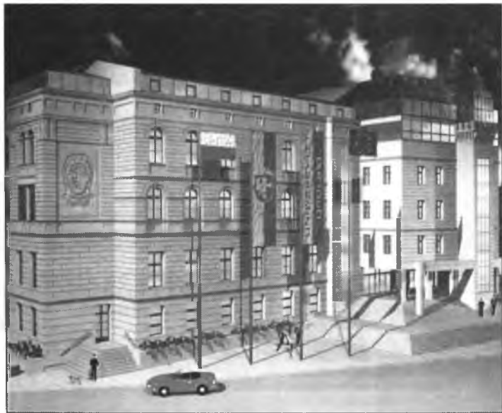
Tak będzie wyglądać remontowany właśnie przez firmę „Rekonsbud” gmach przy placu Kopernika.