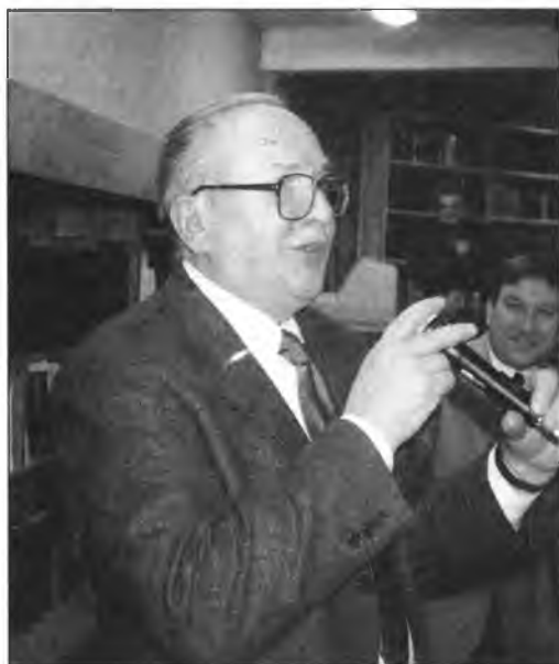
Wykład „Nacjonalizm a religia”, wygłoszony w ramach Złotej Serii Wykładów Otwartych przez prof. Jerzego Szackiego; styczeń 2000 r.