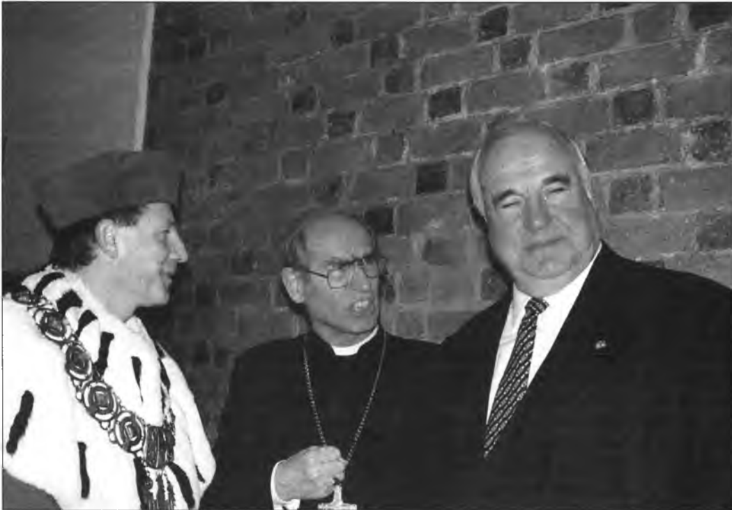
Spotkanie z kanclerzem Helmutem Kohlem we Wrocławiu, podczas uroczystości nadania mu tytułu doktora honoris causa przez Papieski Fakultet Teologiczny we Wrocławiu. 11 stycznia 2000 r.