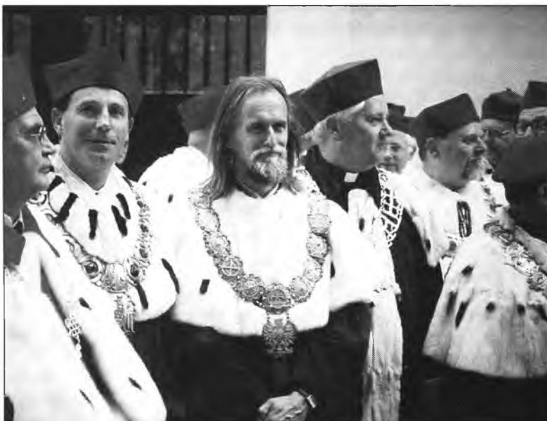
Obchody 600-lecia istnienia Uniwersytetu Jagiellońskiego.