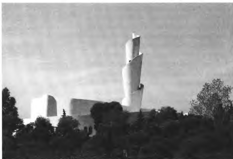
Uniwersytet w Tunisie

Tutaj wykładali m.in. Jakub Kresa – słynny matematyk zwany „Euklidesem Zachodu”, Gregor Johann Mendel – twórca współczesnej genetyki oraz Karel Slaviček – astronom, który pracował również dla cesarza chińskiego.