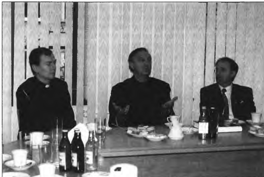
Krzysztof Piesiewicz gościem UO. W trakcie sesji „Skazani na tajemnicę”, poświęconej twórczości Krzysztofa Kiesłowskiego, zorganizowanej przez studentów Wydziału Teologicznego UO.

Sukcesy odnosił również studencki ruch kulturalny organizując m.in. imprezy „piastonaliowe” z udziałem czołówki polskich młodzieżowych zespołów estradowych (Stanisława Sojki, T. Love, Grzegorza Turnau'a, Kayah), Giełdę Piosenki Studenckiej, rajdy studenckie, maratony i przeglądy filmowe (m.in. przegląd filmów Krzysztofa Kiesłowskiego z udziałem scenarzysty i polityka Krzysztofa Piesiewicza; przeglądowi towarzyszyła sesja naukowa). W klubach studenckich miały