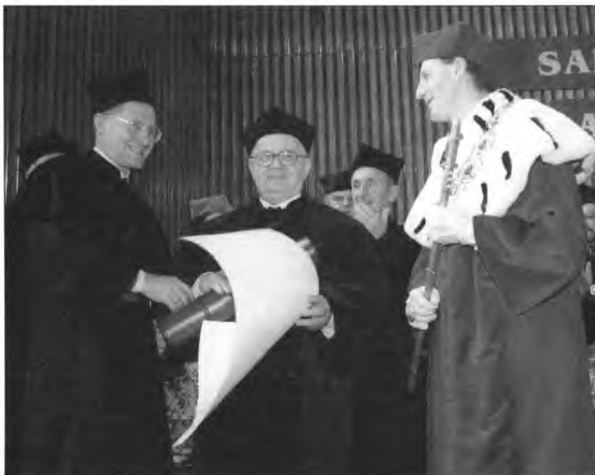
Nadanie doktoratu honoris causa UO prof. Januszowi Tazbirowi. 10 marca 2000 r.

W minionym roku akademickim utrzymywała się duża aktywność intelektualna naszego środowiska. Badania prowadzono w ramach 331 tematów (w roku ubiegłym 324) wynikających z głównych kierunków badawczych. Poniesione zostały na ich realizację nakłady w wysokości 2 miliony 587 tysięcy zł (w ubiegłym roku 2 mln 57 tys. zł).