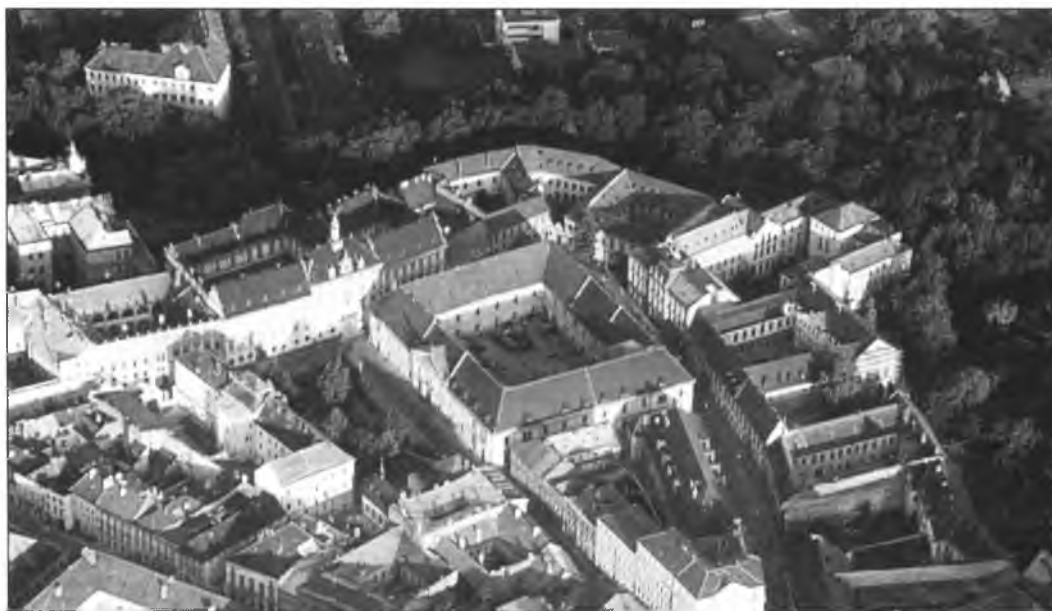
Uniwersytet w Ołomuńcu z lotu ptaka.

W dniu 21 lutego 1946 r. uczelnia wznowiła swą działalność jako Uniwersytet im. Palackiego w Ołomuńcu. Należy zaznaczyć, że Franciszek Palacký nie posiadał bezpośrednich związków z tym ośrodkiem życia naukowego, a nadanie imienia wybitnego czeskiego historyka, polityka i słowianofila okresu czeskiego odrodzenia narodowego miało dla uczelni charakter symboliczny. Pracę naukową i dydaktyczną rozpoczęły równocześnie cztery wydziały: medyczny, prawa, teologiczny i filozoficzny. Dwa ostatnie zostały niebawem zamknięte z powodów politycznych. Na ich miejsce w strukturze uczelni pojawiły się nowe, w tym wydziały: pedagogiczny i przyrodniczy, które przetrwały do „aksamitnej rewolucji” w 1989 r.