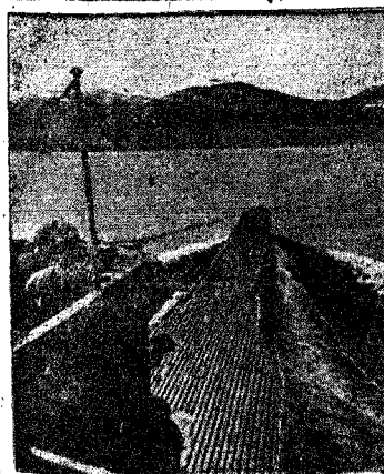
Niemiecki łódź podwodna wraca z rejsu bojowego na Oceanie Lodowatym. Przed dziobem jej widać pokryty wiecznymi śniegami góry Nordu.

Jak donoszą z Moskwy, Stalin przyjął ambasadora amerykańskiego Harrimana.