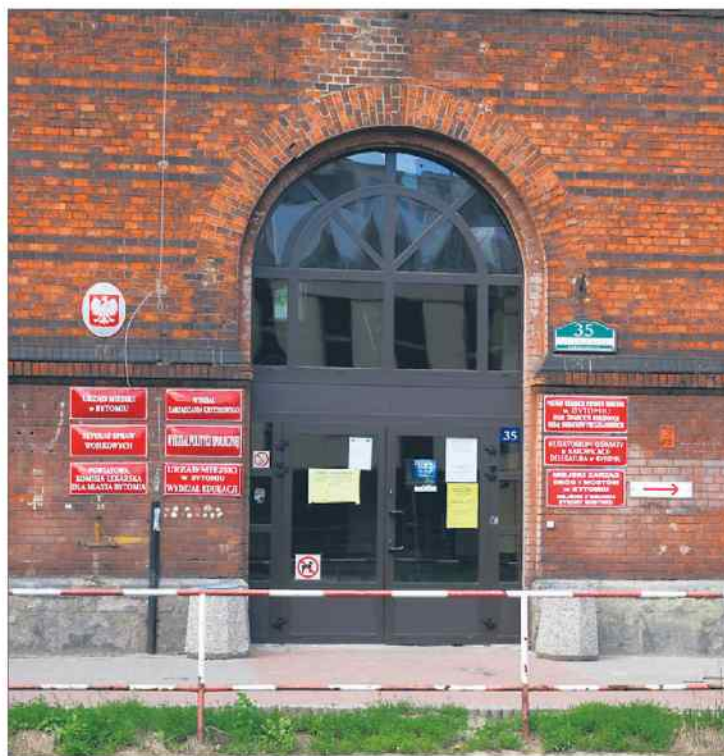
Wydział Edukacji Urzędu Miejskiego przeniósł się na ul. Smolenia.

Inaczej widzą tę sprawę szeregowi urzędnicy, których przeprowadzka dotknęła. Oczywiście nie chcą oni wypowiadać się pod nazwiskiem – w bytomskim Urzędzie Miejskim od dawna obowiązuje nakaz kontaktów z mediami tylko za pośrednictwem rzeczniczki prasowego. – Do tej pory Wydział Edukacji mieścił się bardzo blisko Urzędu Miejskiego – mówi jedna z osób, z którą rozmawialiśmy. – W Urzędzie Miejskim nie ma jeszcze elektronicznego obiegu wszystkich dokumentów, więc teraz z dokumentami do kancelarii wędrować będzie trzeba przez całe śródmieście, tracąc czas. Ponoć istnieje również plan przeniesienia na ul. Smolenia Referatu Dowodów Osobistych. – To może być uciążliwe dla mieszkańców – dodaje jeden z urzędników. – Okolice Urzędu Miejskiego są dobrze skomunikowane liniami