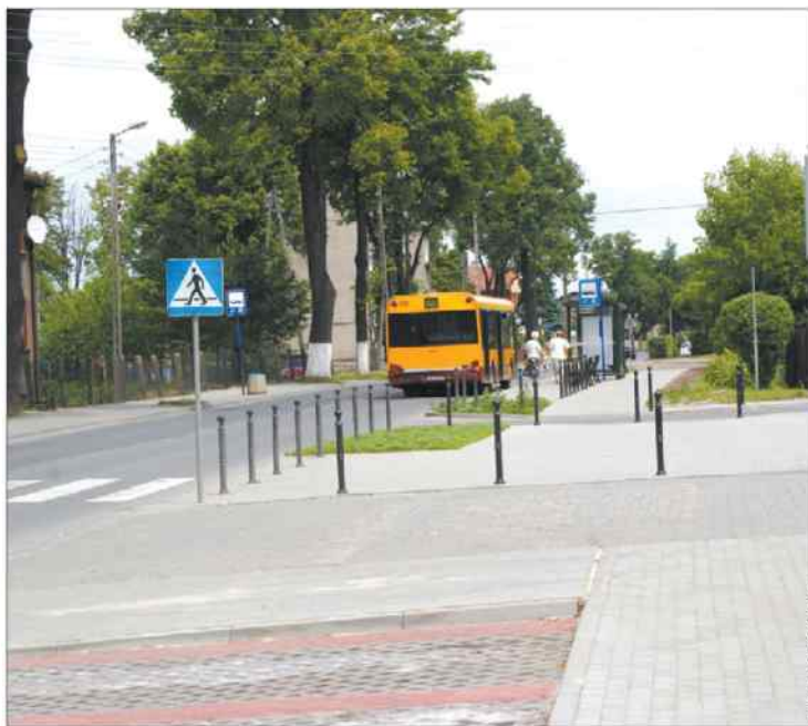
Nowy chodnik robi wrażenie.