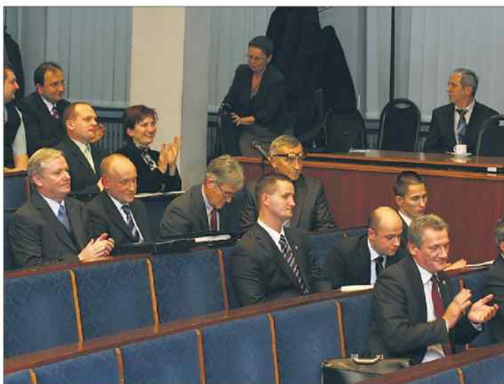
Do odwołania radnych potrzebna jest frekwencja na poziomie blisko 29 tysięcy. Czy uda się ją osiągnąć?

Co nas czeka po 17 czerwca? Niepowodzenie referendum oznacza brak jakichkolwiek zmian. Piotr Koj nadal będzie prezydentem, radni zachowają mandaty i zapewne wszyscy dotrą do następnych, zaplanowanych na jesień roku 2014 wyborów samorządowych. Suk-