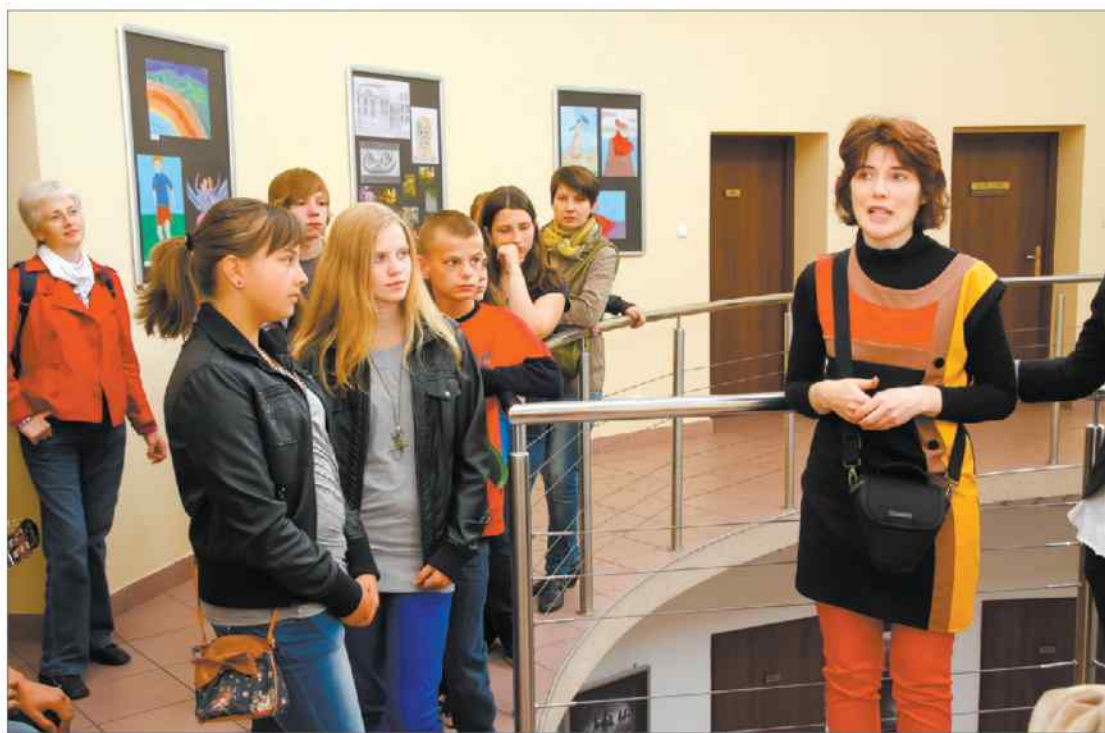
Prace uczniów można oglądać w Galerii „Rotunda”.

Wystawa w bibliotece. Zespół Szkół Ogólnokształcących nr 3 kojarzy się przede wszystkim ze sportem. Tymczasem wśród jego uczniów jest spora grupa młodzieży uzdolnionej także artystycznie.