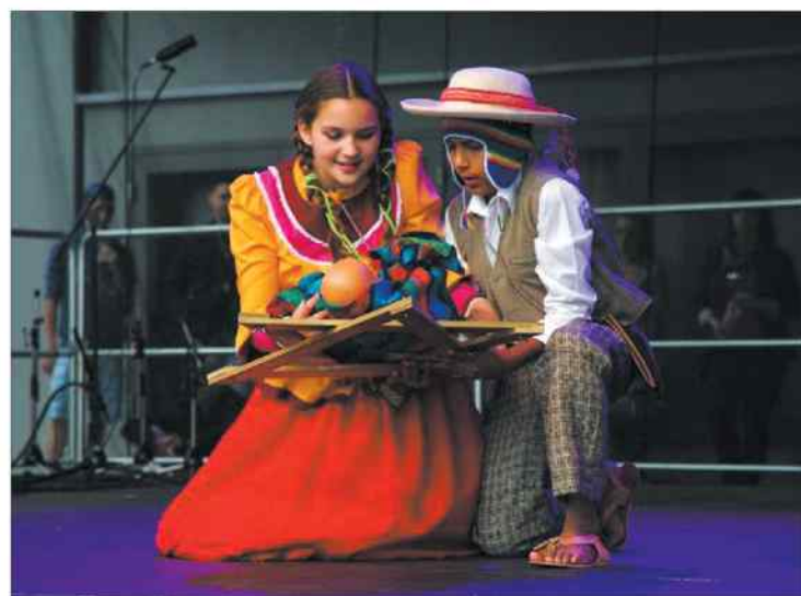
Na scenie goście z Meksyku.

Karolinka z węgla. Radzionków był gospodarzem 6. Międzynarodowego Festiwalu Par Folklorystycznych „Dancing for Peace in the World”. Takiego zaszczytu nie miało dotąd żadne inne polskie miasto.