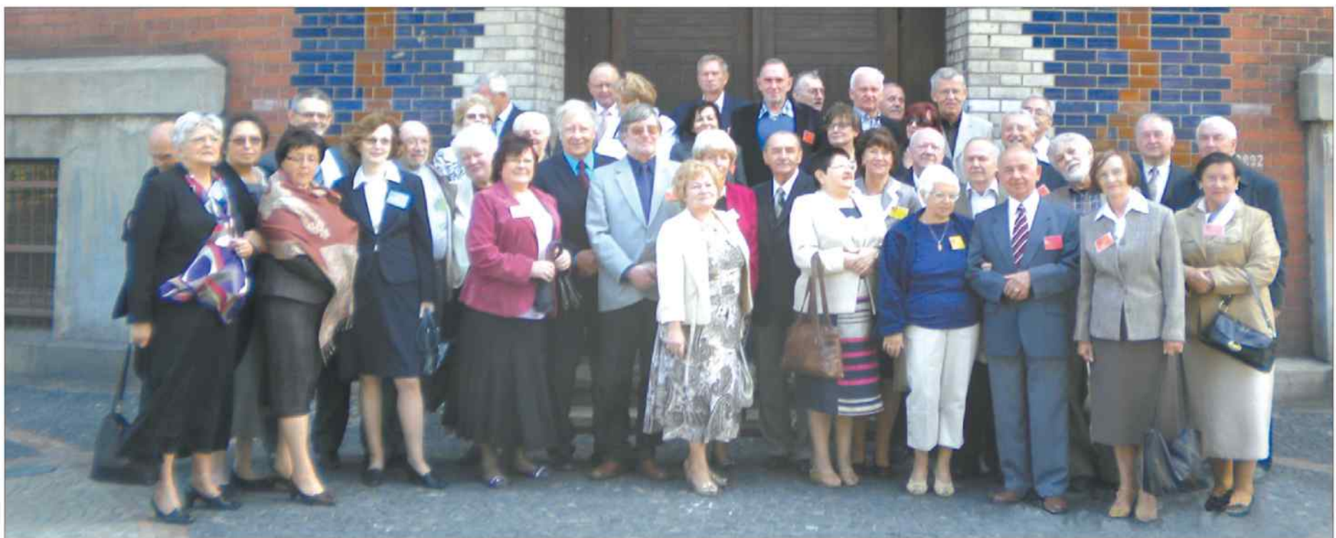
Uczestnicy spotkania zrobili sobie pamiątkowe zdjęcie przed gmachem swojej szkoły.

Dzień wspomnień. W roku 1962 wchodzili w dorosłe życie i zdawali maturę. Pół wieku po tym wydarzeniu postanowili się spotkać i powspominać.