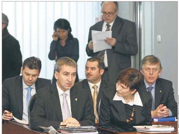
Czy rządzący obronią swe stanowiska?