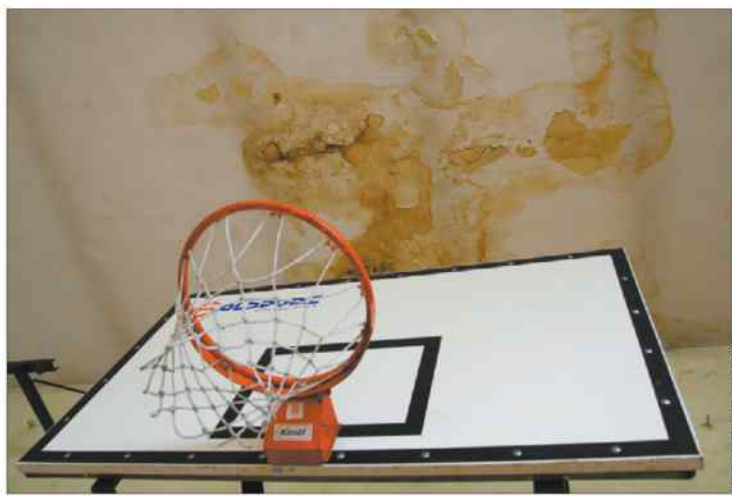
Drobny szczegół wyglądu wnętrza sali gimnastycznej I LO.

Sala główna hali sportowej wygląda tak, jakby przez dziesięciolecia stała zamknięta na cztery spusty, chociaż kilka lat temu doczekała się odświeżenia. Jednak na wilgotnej powierzchni farba długo się nie utrzymała. Znów pojawiły się bąble, wybrzuszenia, smrodliwy nalot, tynk zaczął się kruszyć. Największy problem pozostaje ze ścianą, przed którą niegdyś usytuowano liny i rurki do wspinania. W latach 90. wykonano w niej nawiercenia, wstrzykując