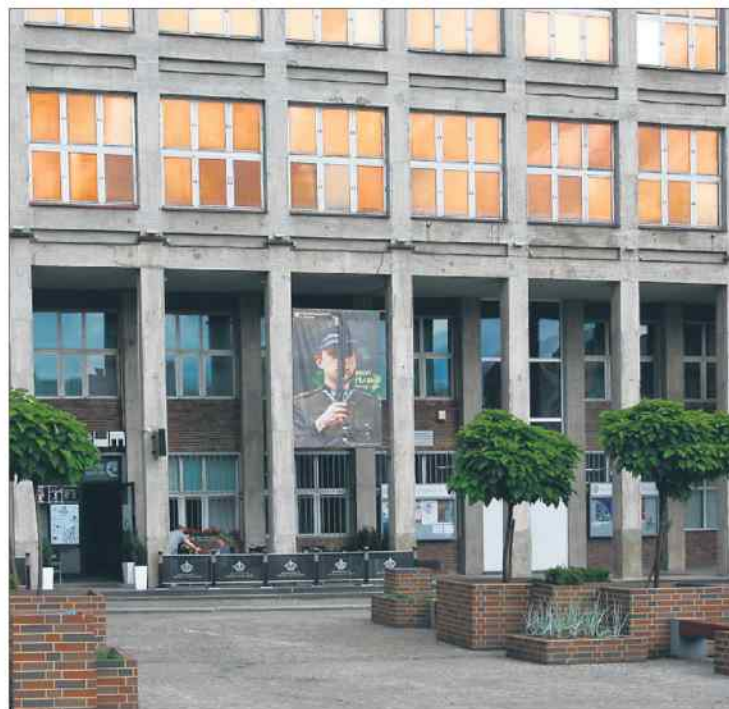
Bytomskie muzeum doczeka się kolejnej monografii.

Powstanie książka. Po uhonorowaniu wyróżnieniem marszałka województwa śląskiego wielkiej księgi jubileuszowej, wydanej z okazji 100-lecia Muzeum Górnośląskiego, finalizowane są prace nad kolejną, równie okazałą monografią poświęconą kontaktom z innymi muzeami, instytucjami kulturalnymi i stowarzyszeniami społecznymi.