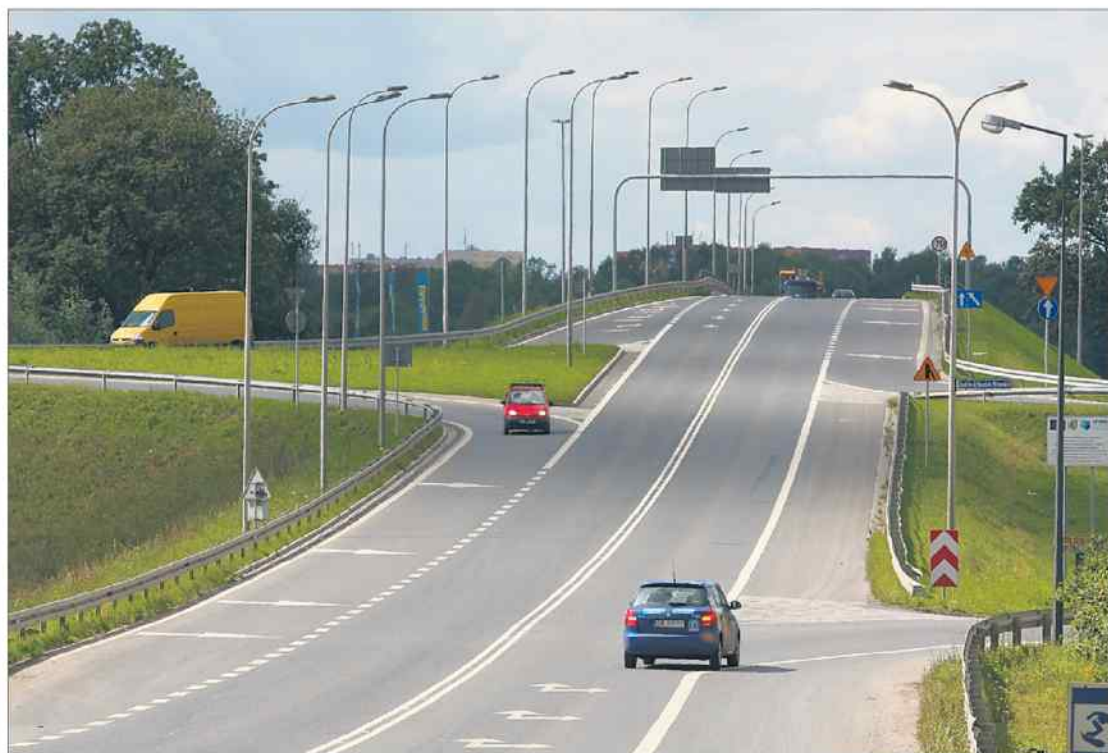
Elżbieta Bieńkowska chwaliła bytomskie drogi, między innymi obwodnicę północną.

grupy tak, jak to było w przypadku wypłat premii. Są to cztery grupy: pracownicy dołowi, pracownicy przeróbki, pozostali pracownicy powierzchni oraz administracja. – Do tych grup przyporządkowano odpowiednie przeliczniki. Pracownik dołowy ma przelicznik 100 proc., przeróbka 75 proc., pozostała powierzchnia 65 proc., a administracja 60 proc. Dodatkowo wysokość nagrody będzie uzależniona od liczby dniówek przepracowanych w 2011 roku – wyjaśnia Grzesik. Z tą propozycją zgodziła się większość związków zawodowych oraz zarząd KW i została ona zapisana w regulaminie. – Na razie nie możemy jeszcze podać precyzyjnie kwot, jakie będą wypłacane pracownikom z poszczególnych grup. Średnio będzie to około 1700 zł brutto dla każdego zatrudnionego – dodaje przewodniczący Solidarności. Termin wypłaty pieniędzy to 20 czerwca. izo