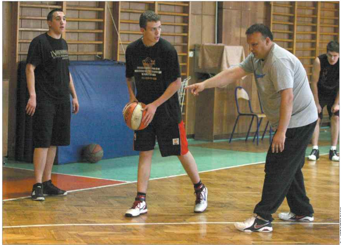
Drużyny juniorów UKS MOSM najlepiej czują się w „specyficznej” hali przy Kosynierów, lecz w nowym sezonie przyjdzie im grać w trzeciej lidze i trenować przy Modrzewskiego.

Szkoła Podstawowa nr 5 w Bytomiu ogłasza nabór uzupełniający do klasy sportowej o profilu koszykarskim – rocznik 2002 (IV klasa). Testy sprawnościowe odbędą się 11 czerwca o godz. 16 w hali sportowej SP 5 przy Al. Legionów. Szczegółowych informacji udziela trener Radosław Fudali pod numerem telefonu: 502-535-509.