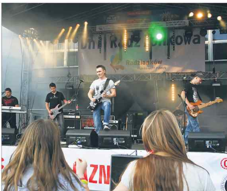
Święto Radzionkowa jak zwykle było udane.

W miniony piątek główną atrakcją okazał się barwny korowód zorganizowany na ulicach miasta. Utworzyli go między innymi przedstawiciele władz, członko-