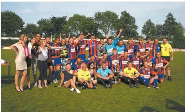
Młodzi poloniści pokonali wszystkich przeciwników.

Trzeba chuchać na talenty. Drużyny młodzieżowe Polonii z roczników 1994 i 1996 wygrały w Holandii 28. Międzynarodowy Turniej Piłkarski BouwMaat na Sportpark Vierhoeven Roosendaal.