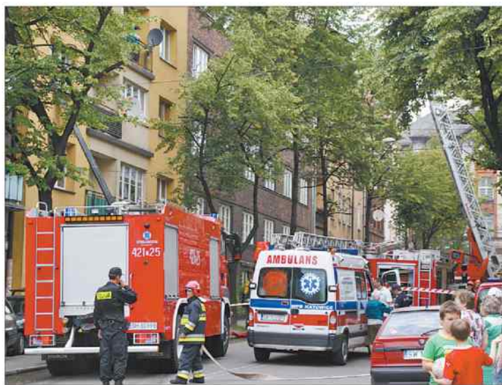
W akcji brało udział kilkudziesięciu strażaków.

Trudna akcja. Strzelające na kilka metrów w górę płomień, gęsty dym i tłum gapiów patrzących, jak płonie kamienica przy ulicy Drzymały 9, zwiastowały poważne problemy.