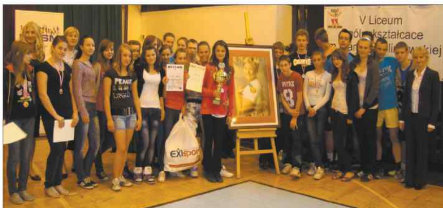
Po ogłoszeniu wyników zawodów i wręczeniu nagród, zwycięscy uczniowie szkół podstawowych i gimnazjalnych pozowali do zdjęć wraz z organizatorami I Memoriału.

nizował, załatwiał pieniądze. Samo się zrobiło? Dla osób tylko trochę orientujących się w realiach polskiej piłki jasne jest, że to, co udało się osiągnąć przez te 9 lat, należy traktować w kategoriach fenomenu. Biorąc pod uwagę potencjał gospodarzy Bytomia, brak odpowiedniej bazy oraz małe zaangażowanie miasta w sprawę klubu, to uratowanie Polonii, awanse, 4 lata gry w ekstraklasie okazały się wielkim naszym sukcesem, którego nam nikt nie odbierze. Możemy chodzić z podniesioną głową. Ludzie związani w ostatnich latach z Polonią oddawali jej serce. Za to im bardzo dziękuję. Mam nadzieję, że chwilowe niepowodzenie w perspektywie przyniesie klubowi wymierne korzyści. Wpłyne na zmianę spojrzenia sponsorów i władz miasta na Polonię. Gmina przejmie częściową odpowiedzialność za klub oraz zaangażuje się w budowę nowego obiektu lub w modernizację istniejącego stadionu.