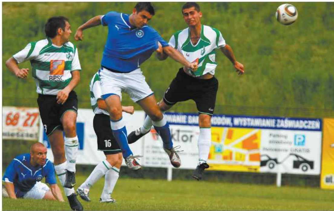
Dotychczas Szombierki przegrały tylko dwa mecze, w tym z Silesią.

Kończy się piłkarski sezon. Nie tylko w ekstraklasie kwestia spadku i awansu pozostała nierozstrzygnięta do ostatniego meczu.