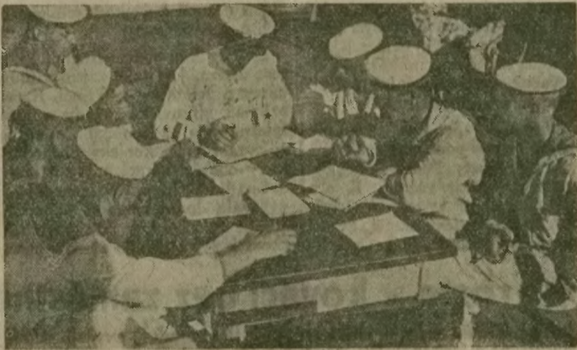
Rudoarmějci se připravují k volbám. Na obrázku vidíme rudé námořníky, jak sedí spolu se svými komandýry a stužují v kroužku volební zákon.

Do československých záležitostí nemá Berlín co mluvit! O našich věcech si budeme rozhodovat sami! — Taková musí být odpověď celé pokrokové veřejnosti, tak musí odpovědět i ostravsko-těšínská kováci.