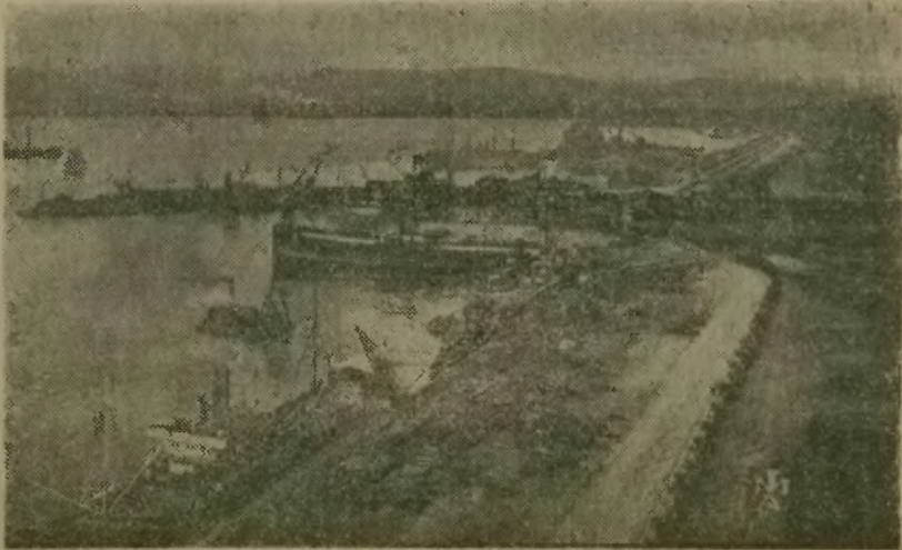
Gijonský přístav před pádem Gijonu.

pomoc. Gijon nechť je poslední obětí, za kterou padá odpovědnost také na hlavy zbabělých demokratických vládní! Aby byly splněny všechny požadavky SSSR, směřující k posile posic protifašistického lidu, o to se