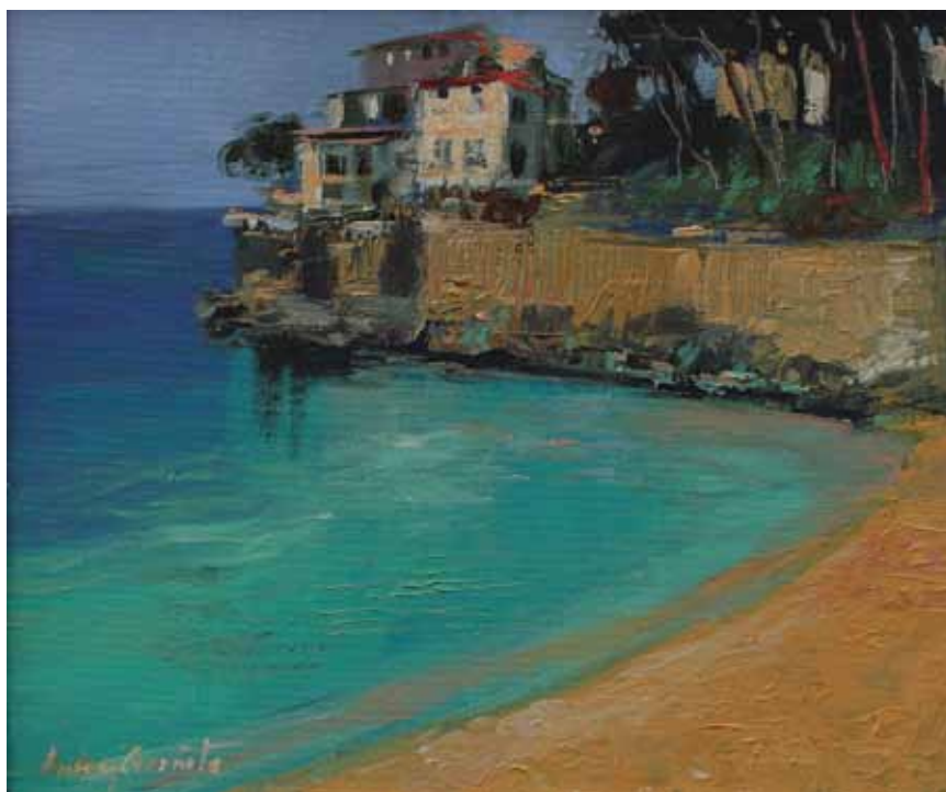
Cassis – plaża Bastian, akryl, olej na płótnie