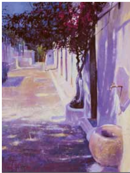
Simi – zimna woda, akryl, olej na płótnie

krajem. Nie było to łatwe, ale jakoś udało mi się zwiedzić Europę, wówczas szczególnie Skandynawię. Dotarłem do Afryki, poznałem skrawek Ameryki. To