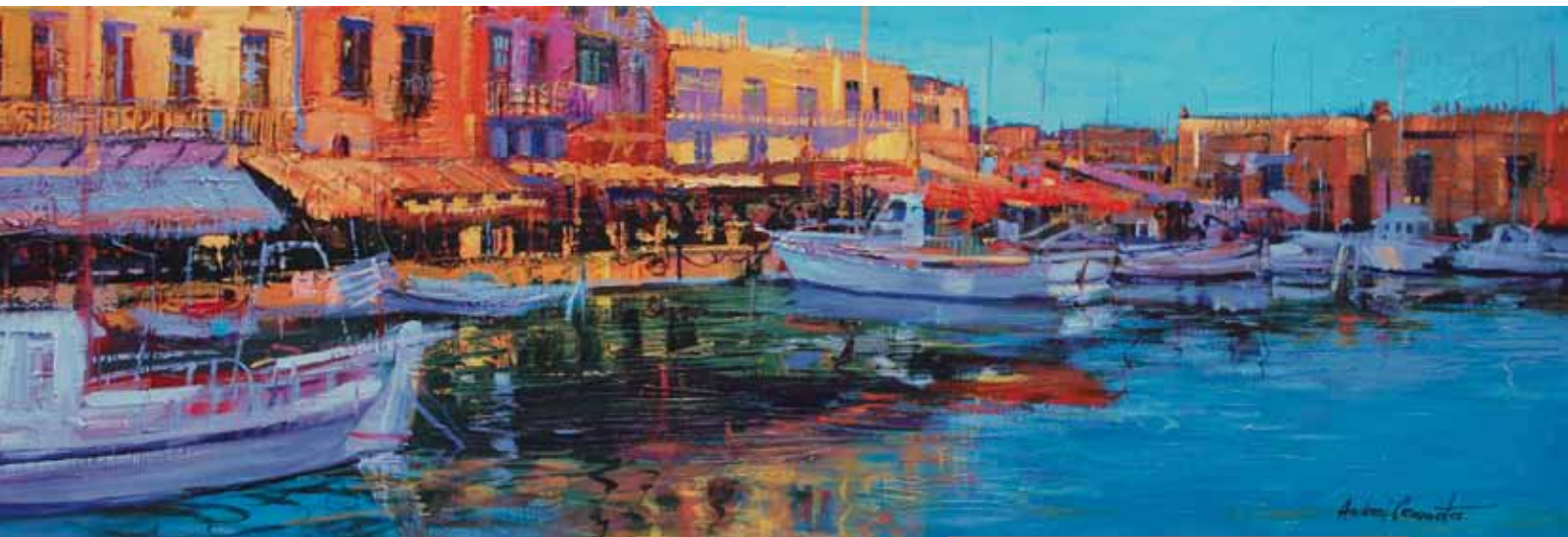
Port w Rethymonie II, akryl, olej na płótnie