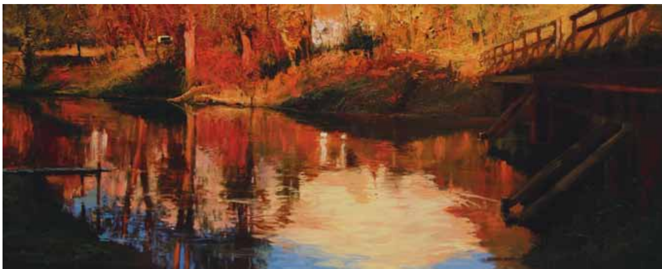
Jesienne opowieści, akryl, olej na płótnie

A.Cz. Klimat, koloryt, wszechobecna wtedy szarzyzna - gdy zaczynałem swą twórczą drogę - dopingowała mnie do wyjazdów i poszukiwań inspiracji poza