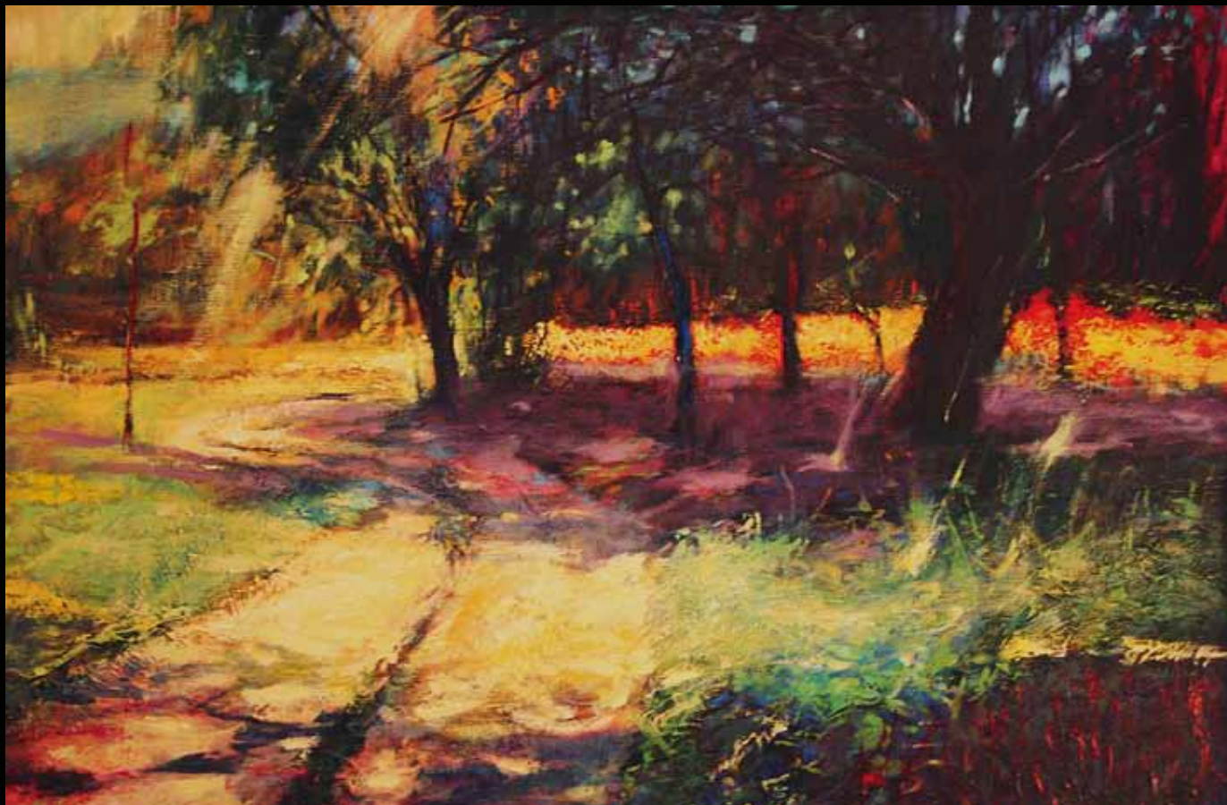
z cyklu „Drogi Polskie” Andrzej Czarnota