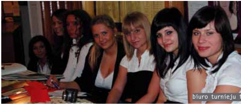
biuro turnieju