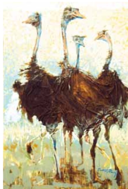
Strusie, akryl na płótnie

A.Cz.: ...a przecież to rzeźba jest wielką namiętnością mojego artystycznego żywota. Od niej zaczynałem, wciąż do niej próbuję wracać. Bezpośrednio po skończeniu uczelni stworzyłem rzeźbiarski cykl „Sen o lataniu”. Nazywałem to wtedy, pewnie słusznie „grafiką przestrzenną”, a były to instalacje pełne aniołów, ikarów, huzarów i... burych