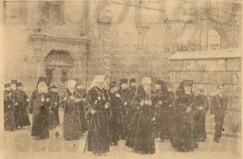
Die Oberhäupter und Bischöfe der autokephalen orthodoxen Kirche im Generalgouvernement, der autokephalen orthodoxen Kirche in der Ukraine und der autonomen Kirche begeben sich zum Empfang beim Generalgouverneur Dr. Frank in Krakau. Sie verlasen Erklärungen der heiligen Bischofskonkile ihrer Kirchen gegen die christentumsfeindliche Politik und die verbrecherischen Methoden Moskaus.