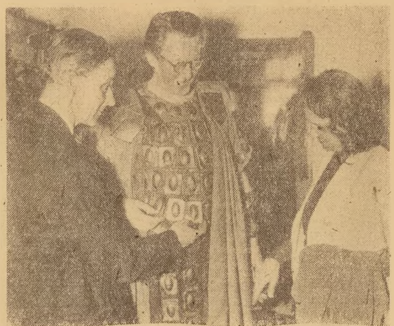
Aufn.: Pyka (4)