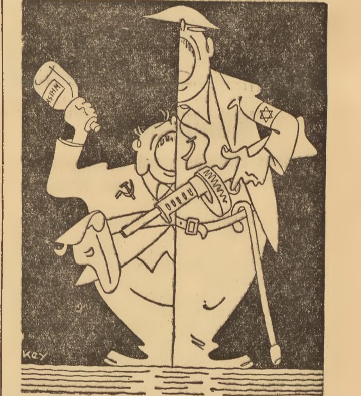
Das angloamerikanische Angriffsgeschrei und Offensivgeflüster hat schon merklich an Gleichklang verloren... Karikatur: Key/Dehnen-Dienst

Die Athener Erdbebenwarte verzeichnete am Montag gegen 10.30 Uhr Erdstöße, die leichter bis schwerer Natur waren und zunächst in Dirroda verspürt wurden. Der erste schwere Erdstoß erfolgte um 11.12 Uhr 19 Sek. Der Erdbebenherd scheint etwa 160 Kilometer von Athen entfernt zu sein und in westlicher Richtung zu liegen. Den bisherigen Nachrichten zufolge ist dieses Erdbeben in Amfissa, Galaxidi, Balu, Larissa und Levadia verspürt worden. Aus Dirrida werden Hauseinstürze gemeldet.