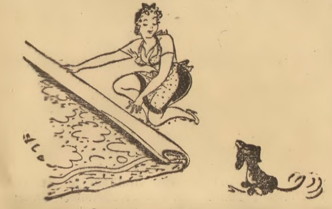
„So, Waldi, nachdem du dich jetzt acht Tage hintereinander als stubenrein erwiesen hast, werden wir wieder den guten Teppich auslegen und den alten in die Spinnstoffsammlung geben! Ich hoffe, du wirst diesen Beweis unseres Vertrauens zu würdigen wissen!“

Bei uns an Bord gibt es nach der glücklichen Ersatzteilübernahme bei windigem Wetter und hohem Seegang ein Freudengeheul ohne gleichen, wie es selbst Keger im Urwald nicht besser antimmen können, als wir wenige Stunden später durch Funk hören, daß unsere Kameraden von U... einen in Richtung England alleinfahrenden Tanker umlegen konnten. „Das hat ja glänzend hingehauen!“ sagt lachend der Obermaschinist aus dem Diesel, der doch Recht behalten hat.