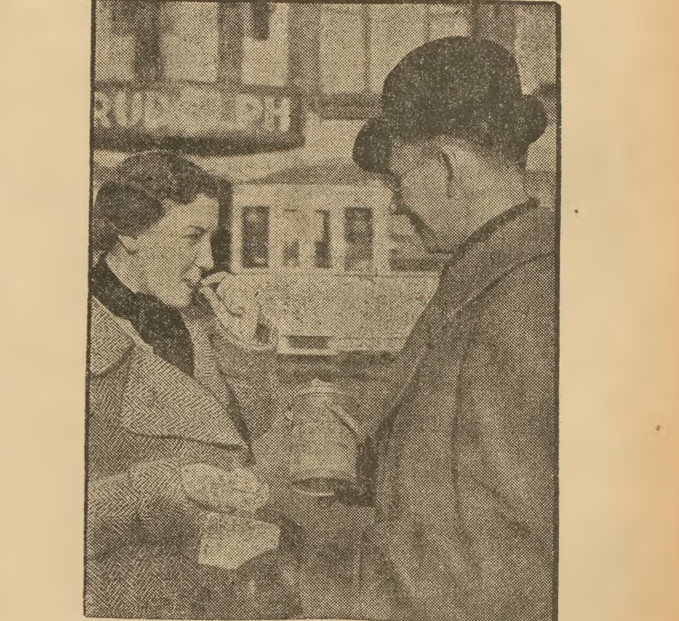
Berlin spielt Mundharmonika. Ein Schnappschuß von der Gaufraktionssammlung Berlin zugunsten des WSV. Zum Verkauf gelangen entzückende kleine Mundharmonikas.