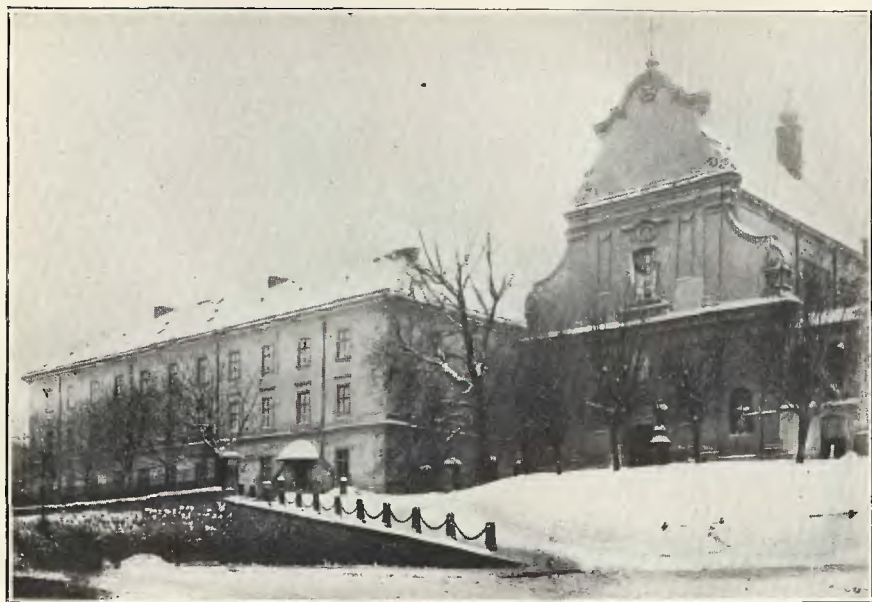
Stary Uniwersytet (ul. św. Mikołaja)