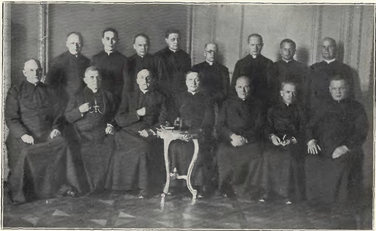
Grono Profesorów Wydziału teologicznego, maj 1932