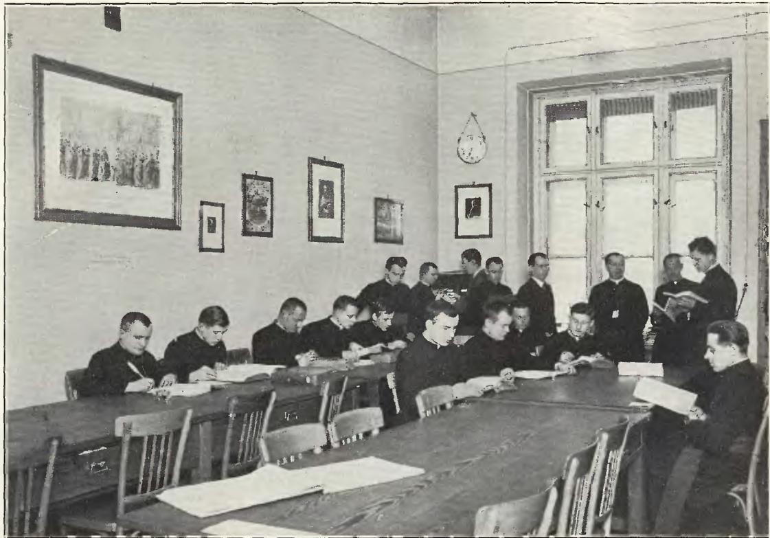
Seminarjum naukowe: Pracownia