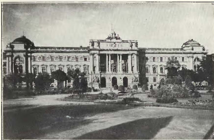
Nowy Uniwersytet (ul. Marszałkowska)