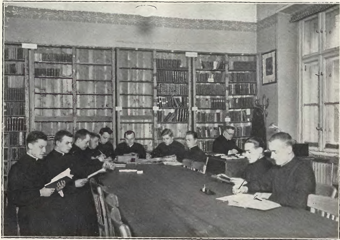
Seminarjum naukowe: Instytut homiletyczny