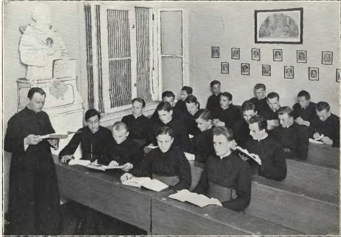
Seminarjum naukowe: Sala ćwiczeń I